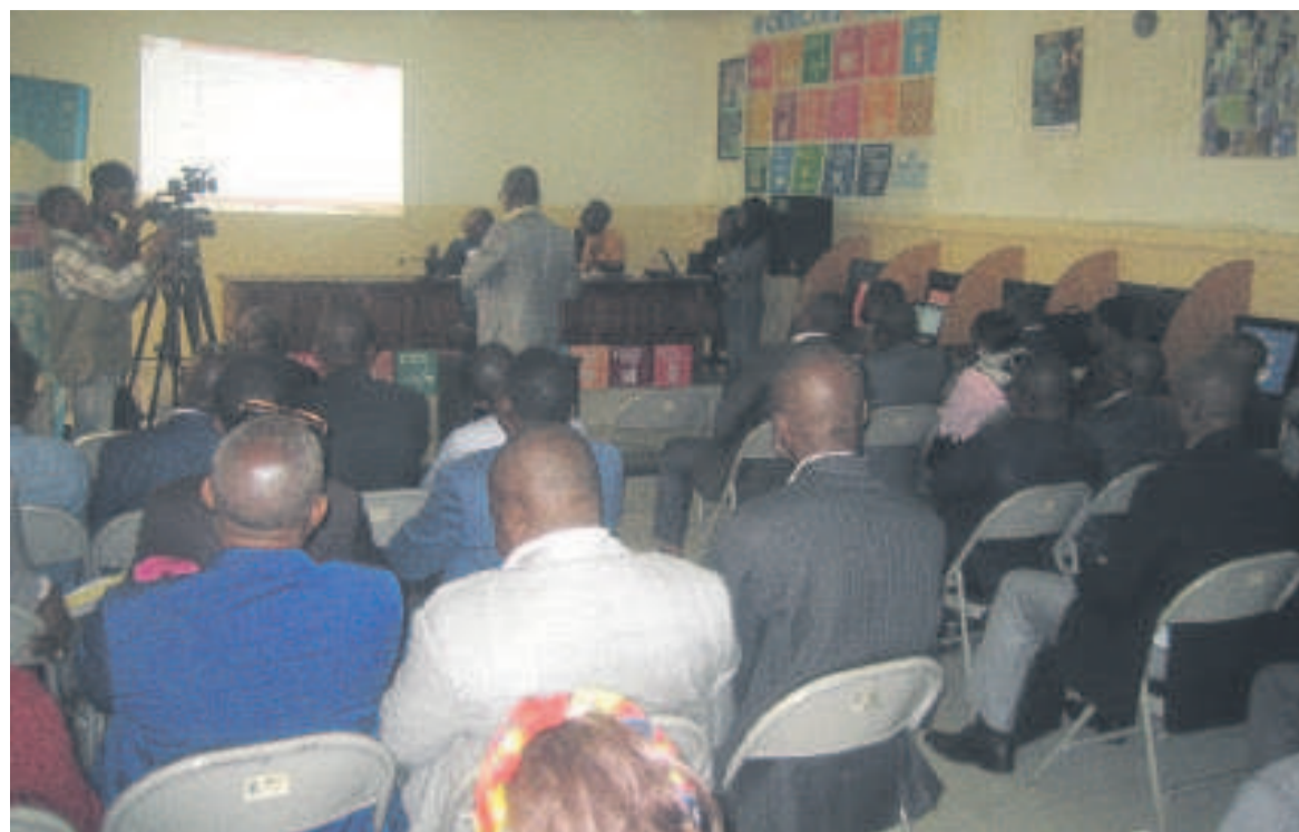
Les participants planchant sur les cibles prioritaires

portunité pour les DEP avec le concours des agences du système des Nations unies de mener des échanges novateurs pour mutualiser les efforts pour l'émergence d'une croissance inclusive, stable et durable », a-t-il déclaré.