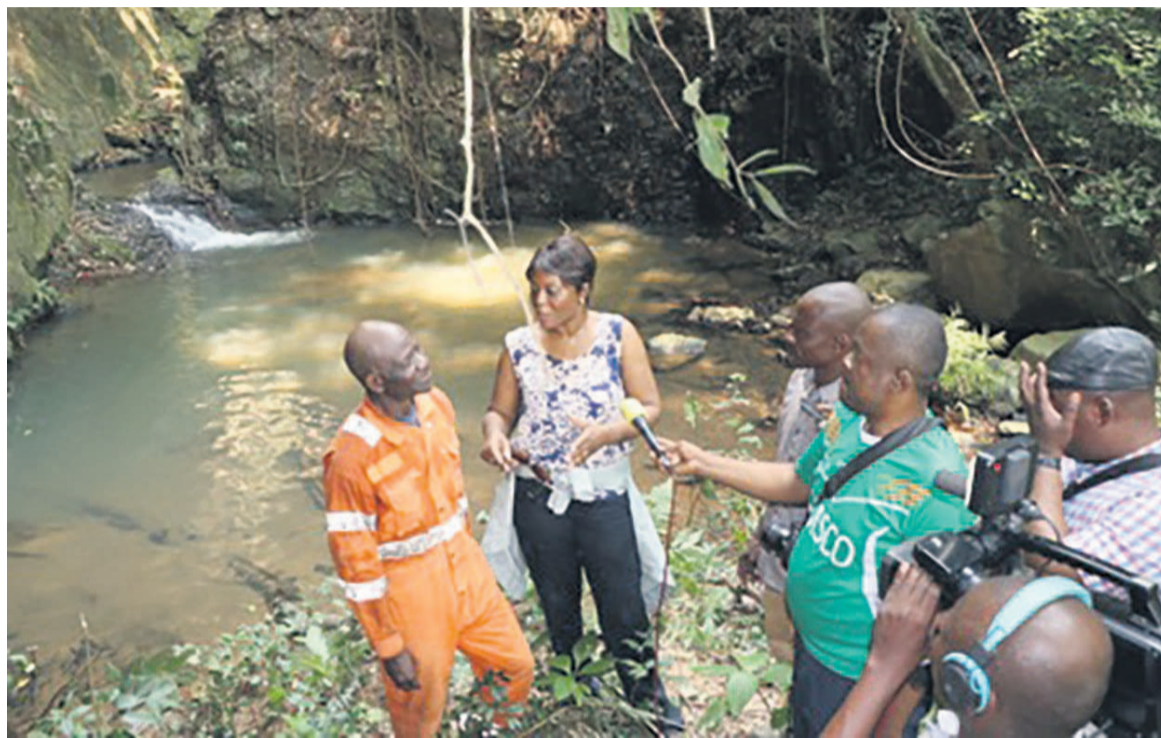
La ministre Arlette Soudan Nonault appréciant la cascade de Kikata