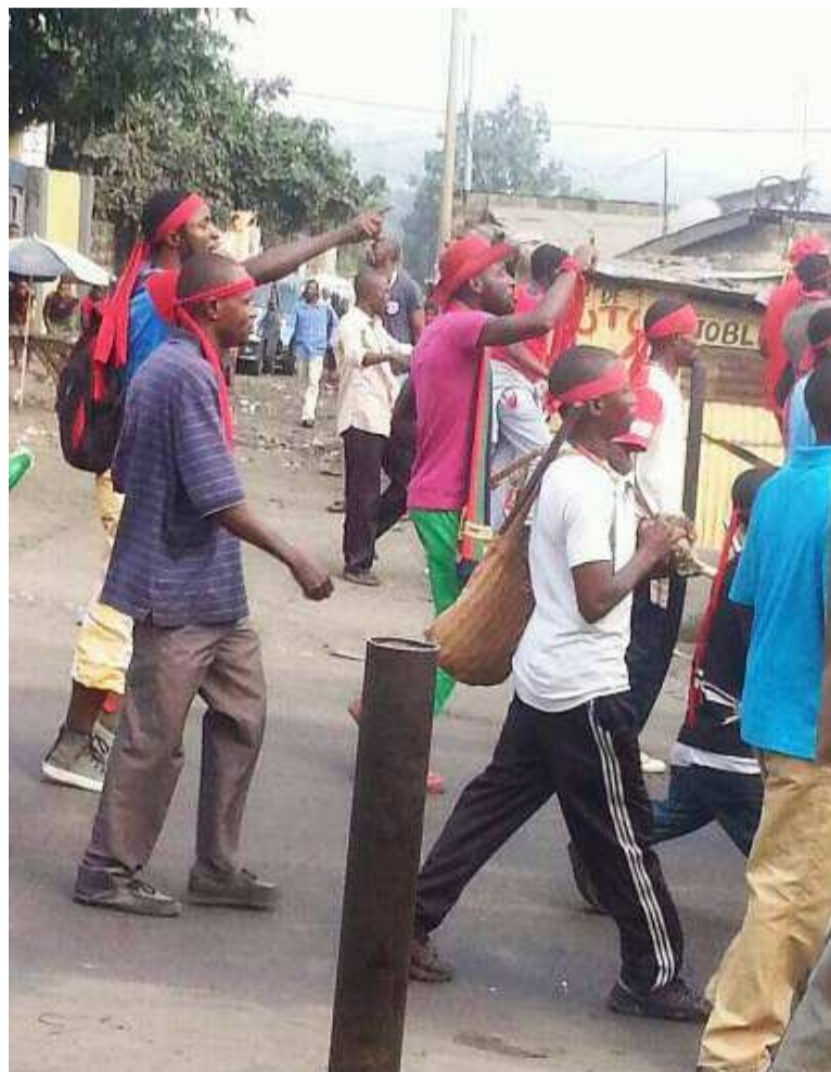
Des adeptes de Bundu Dia Mayala en action