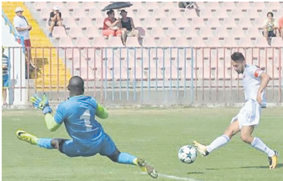
Nsendo Kololo et le Sportul Snagov font match nul sur le terrain du Luceafarul Oradea