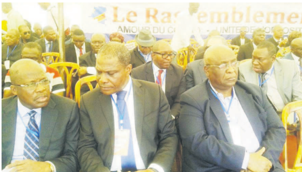
Quelques cadres du Rassemblement pendant le Conclave de Limete

Cette frange de l'opposition propose que la présidentielle soit organisée au cours de cette année 2017 comme le prévoit l'accord politique de la Saint-Sylvestre. Le Rassop/Limete suggère qu'en cas de blocage dans l'organisation des élections (présidentielle, lé-