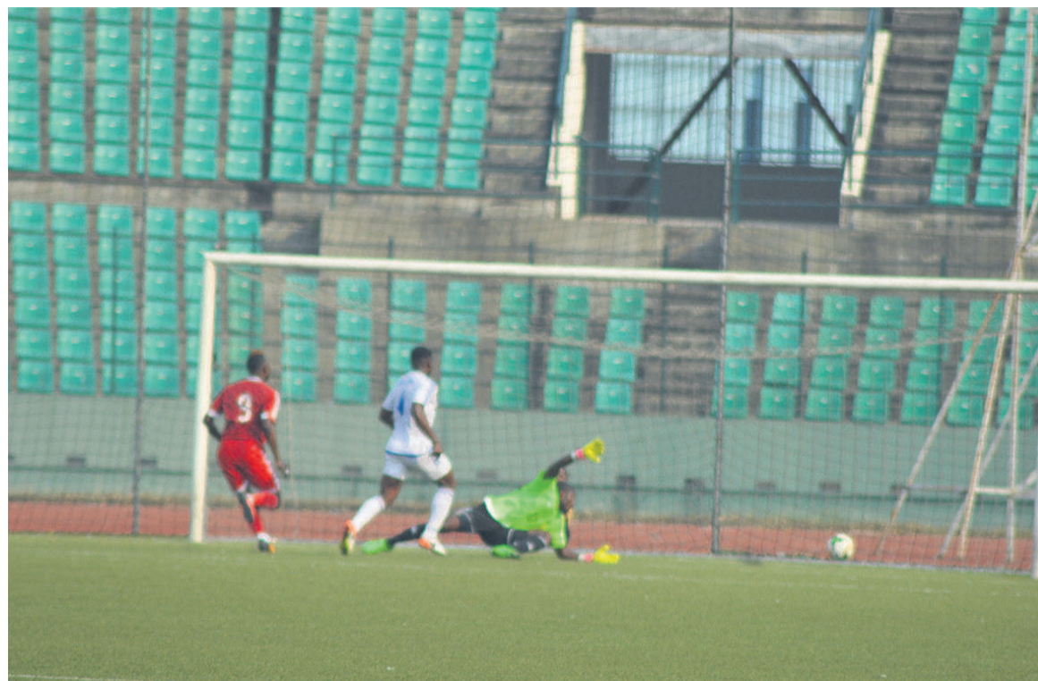
L'une des actions dangereuses des Congolais dans le camp équato-guinéen

suite très décisif sur l'action du deuxième but des Diables rouges. Il a fait parler sa pointe de vitesse, laissant sur le carreau une bonne partie de la défense équato-guinéenne avant de trouver dans la foulée Bersyl Obassi, bien placé,