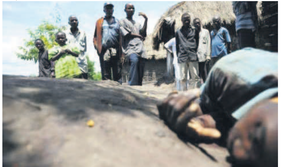
Au moins quatre-vingt charniers recensés dans la région

très sérieux » au gouvernement de la RDC, « afin d'agir sans délai pour empêcher que cette violence ne bascule dans un processus de purification ethnique à plus grande échelle ». En juin dernier, devant le Conseil des droits de l'Homme de l'ONU à Genève, M. Zeid avait accusé les autorités de la RDC d'armer une milice menant « d'horribles attaques » contre les civils dans la région du Kasai, en proie à des troubles. Il a dénoncé en particulier une milice, appelée Bana Mura, qui a mené « des attaques horribles contre les groupes ethniques luba et luluwa ». Devant