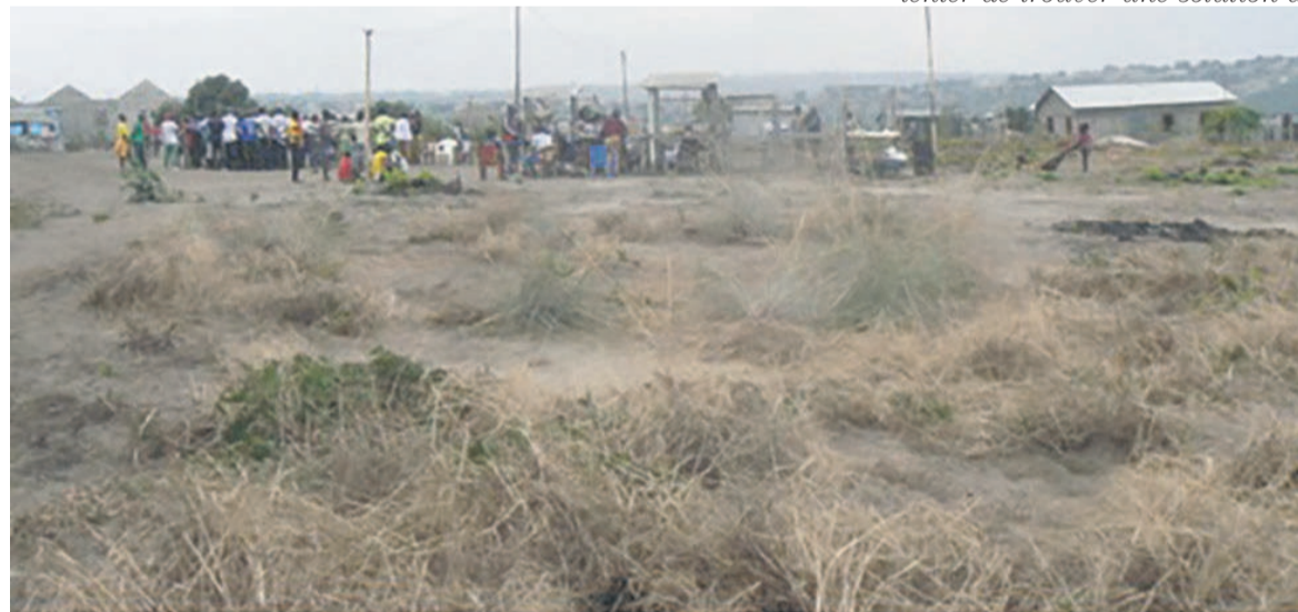
L'aire partielle du futur marché public, Edmond Itoua-Itounou, derrière la télévision congolaise

« Ces espaces réservés à la construction d'un marché public et d'un poste de police ont été classés, domaine public. Au regard de la vente illégale, j'ai été convoqué, en vain, dans deux postes de police pour évoquer et tenter de trouver une solution à