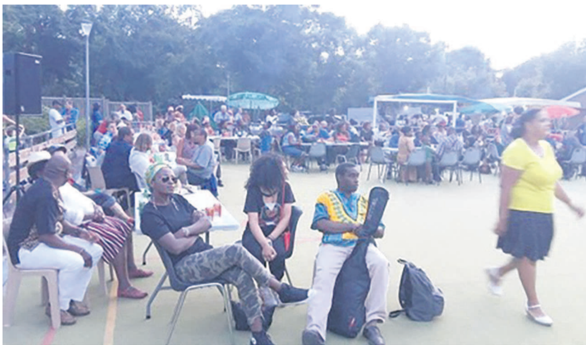
Vue partielle de la Guinguette africaine de Suresnes lors du « spécial Cameroun ».