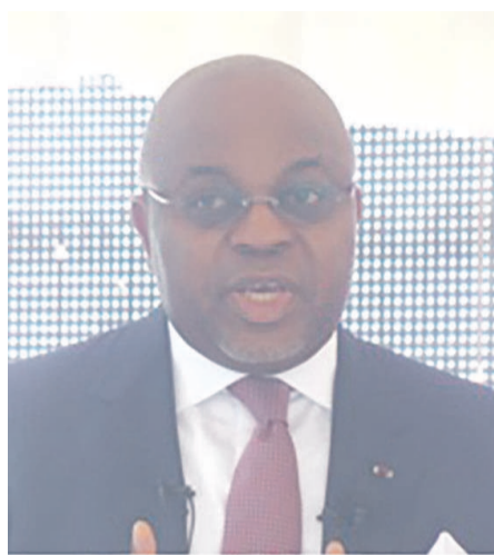
Le ministre Bruno Jean Richard Itoua

Le ministre de l'Enseignement supérieur, Bruno Jean Richard Itoua, qui a animé une conférence de presse le 9 août à Brazzaville, s'est dit confiant quant au paiement de la bourse des étudiants au titre de cette année