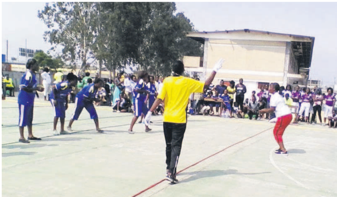
Vue d'un match de nzango au lycée Poaty Bernard