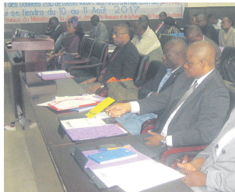
Les participants aux travaux de l'atelier

L'Ofac est une cellule technique du secrétariat exécutif de la commission des forêts d'Afrique centrale, dont la mission vise à