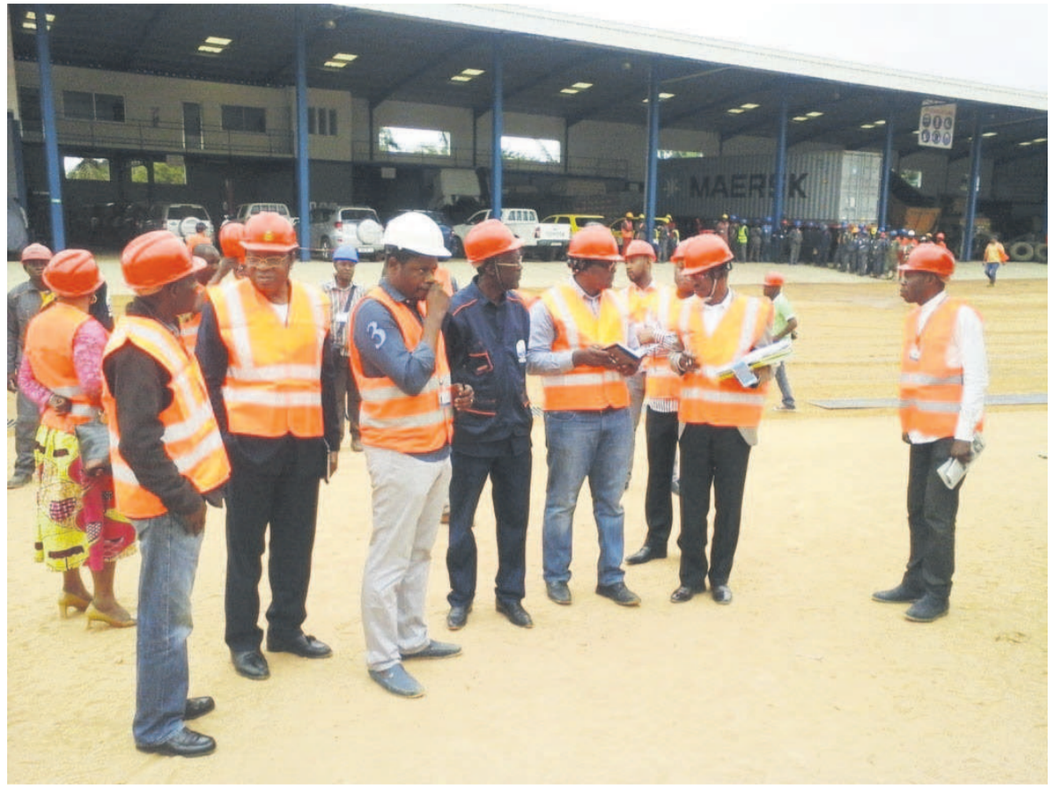
La délégation du Peedu sur le site de MBTP

Tous les neuf feeders prennent leur source au poste THT Mongo Kamba 1 et ont pour point de chute les postes MT/BT CT3 au quartier Songolo ; Moe Poaty à Loandjili ; Loango ancien, situé dans le quartier de Télé Congo Pointe-Noire ; Saint-Jean Bosco, non loin du marché Fond Tié Tié ; Augouard (à côté du stade