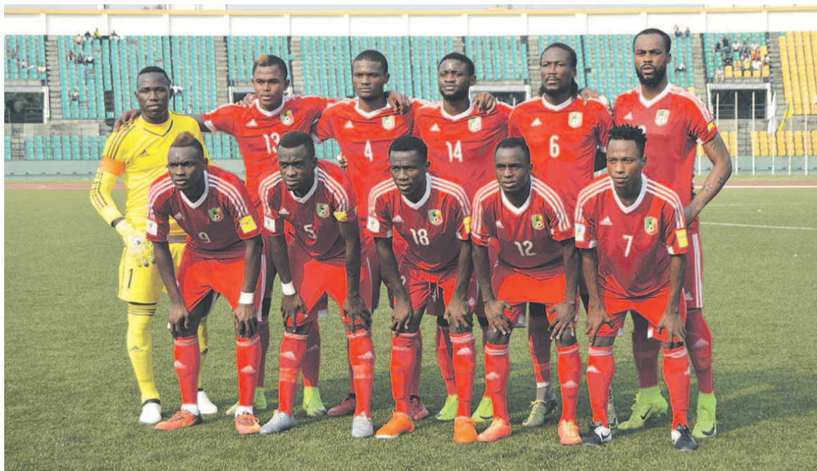
Les Diables rouges locaux