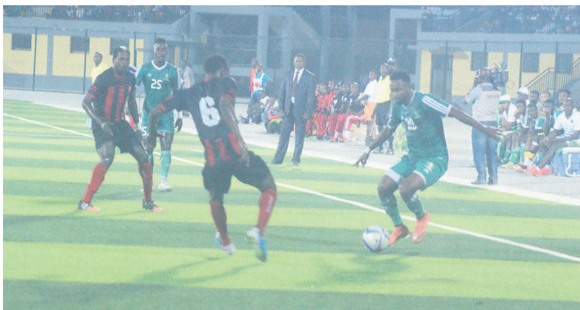
Le 14 août à Madingou l'AC Léopards battait Cara en finale

Comme à Madingou en 2016, la finale de la Coupe du Congo mettra aux prises le 13 août au stade de l'Unité à Kintélé et devant le chef de l'Etat, le Club athlétique renaissance aiglons (Cara) à l'Athlétic club Léopards de Dolisie