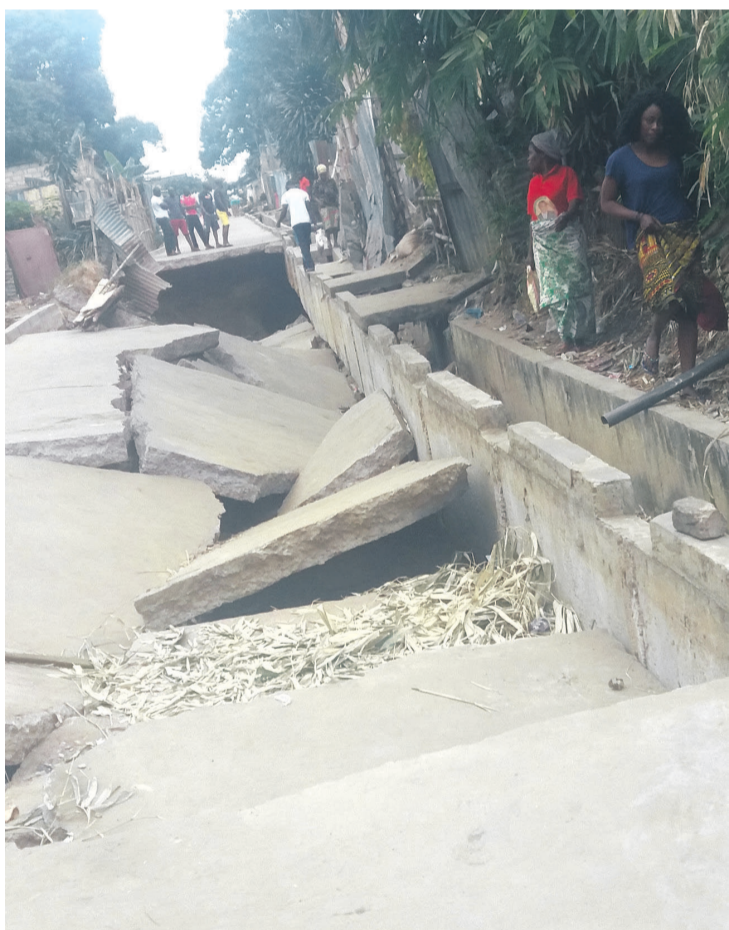
Une vue de la rue endommagée

L'unique desserte pavée du quartier Jacques Opangault, qui le longe sur des centaines de mètres et facilite la mobilité des habitants dans l'arrondissement 6 Talangai, est sous la menace d'une dégradation qui pourrait empirer avec l'arrivée dans quelques mois de la saison des pluies. Il s'entend que si la partie dégradée (nos photos) n'est pas réparée dans les délais, les efforts remarquables fournis pour construire cette voie seront réduits à néant. Evidemment, les riverains, à l'instar des jeunes qui se trouvent près du trou béant, ou de ces deux dames qui négocient leur passage avec précaution, sont inquiets.