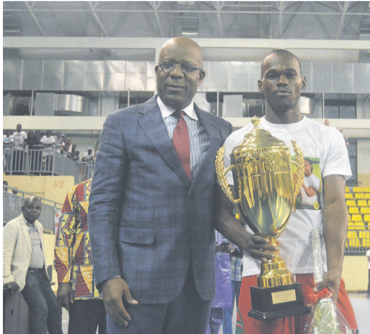
Le président de la Fecohand avec le capitaine de Caïman, équipe championne en hommes

En hommes, Caïman ne s'est pas fait prendre deux fois. Face à Inter Club qui les avait privés du titre national en 2015, les handballeurs de Caïman se sont vengés en empêchant l'équipe adverse de rééditer l'exploit, d'il y a deux ans. Le sacre du champion n'a pas été facile pour autant. Le score final en témoigne d'ailleurs : (22-21) en faveur de