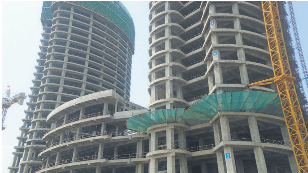
Une vue de l'ossature des Tours jumelles de Mpila

Le quatorzième étage de chacun de ces immeubles sera réservé à l'abri, en cas d'incendie. Le 30ème niveau de chaque bâtiment sera affecté aux locaux techniques.