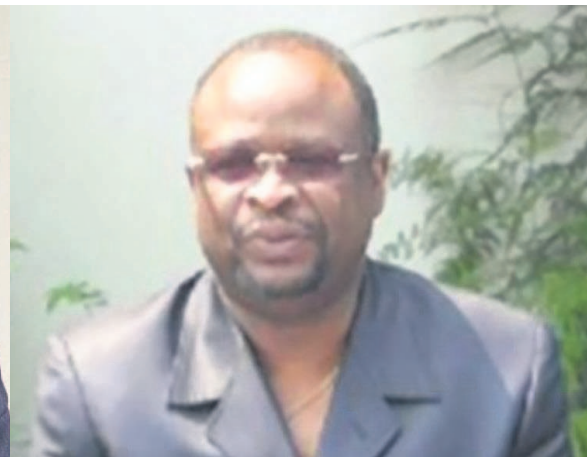
Guy-Brice Parfait Kolelas

Les leaders des deux principales formations politiques de l'opposition à la future assemblée nationale, Pascal Tsaty Mabilia et Guy-Brice Parfait Kolelas ne voient pas d'inconvénient à unir leurs forces dans un même groupe à l'Assemblée nationale.