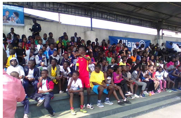
Une vue des gradins du stade de l'espace du trentenaire «adiac»

Ouverte gratuitement à tous les enfants de la capitale économique, la troisième édition de la compétition réservée aux enfants dont l'âge va-