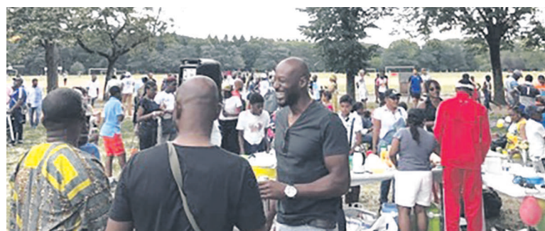
L'ambiance de la fête au Parc de Parilly à Bron près de Lyon par l'ACGL