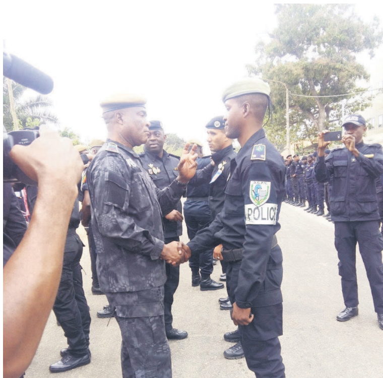
Serge Pépin Itoua-Poto félicitant les nouveaux promus

L'orateur a aussi rappelé aux policiers les principaux défis actuels de la police dans les départements du Kouilou et de Pointe-Noire basés sur le démantèlement des bandes et réseaux des malfaiteurs. « Après avoir bien veillé au bon déroulement des élections législatives et locales,