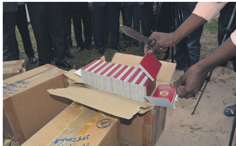
Des stocks de passeports prêts à être incinérés.

Sur recommandation du juge d'instruction, le ministère des Affaires étrangères, de la coopération et des Congolais de l'étranger a procédé le 17 août à la destruction d'un important lot de passeports diplomatiques déclassés, en présence du corps diplomatique, de la DGST et d'un huissier de justice.