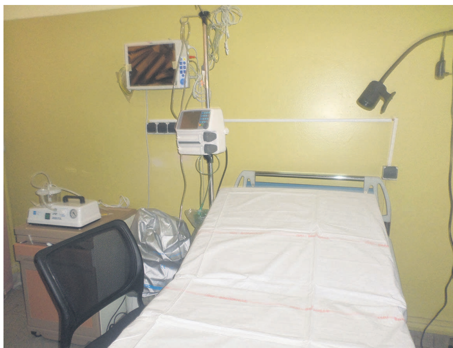
Une image de l'Unité des soins Intensifs Cardiolgiques du CHU Brazzaville

Il sied de souligner que ces appuis de LCB Bank traduisent sa volonté de matérialiser permanentement