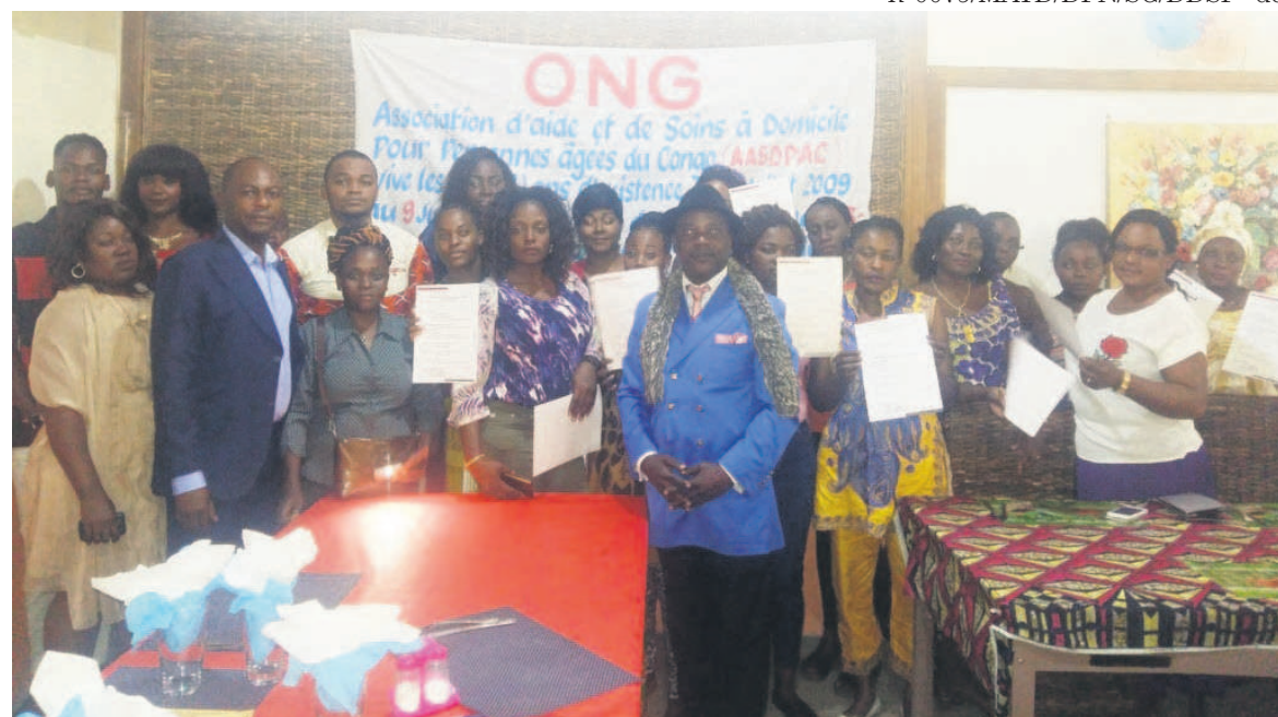
Photo de famille de la cérémonie

Notons que l'AASDPAC a un protocole d'accord avec l'Union nationale de l'aide, des soins et des services aux domiciles (UNA) de France. Les activités de l'AASDPAC sont appuyées par la société Total E&P Congo et le ministère congolais de la Santé et de la Population. Cette ONG est présente à travers beaucoup des départements du Congo. La fin de cette rencontre était marquée par la remise des certificats d'assistance de soins en gérontologie aux membres de l'AASDPAC, suivie d'un apéritif offert pour la circonstance. Cette association est enregistrée sous le récépissé n°0079/MATD/DPN/SG/DDSP de