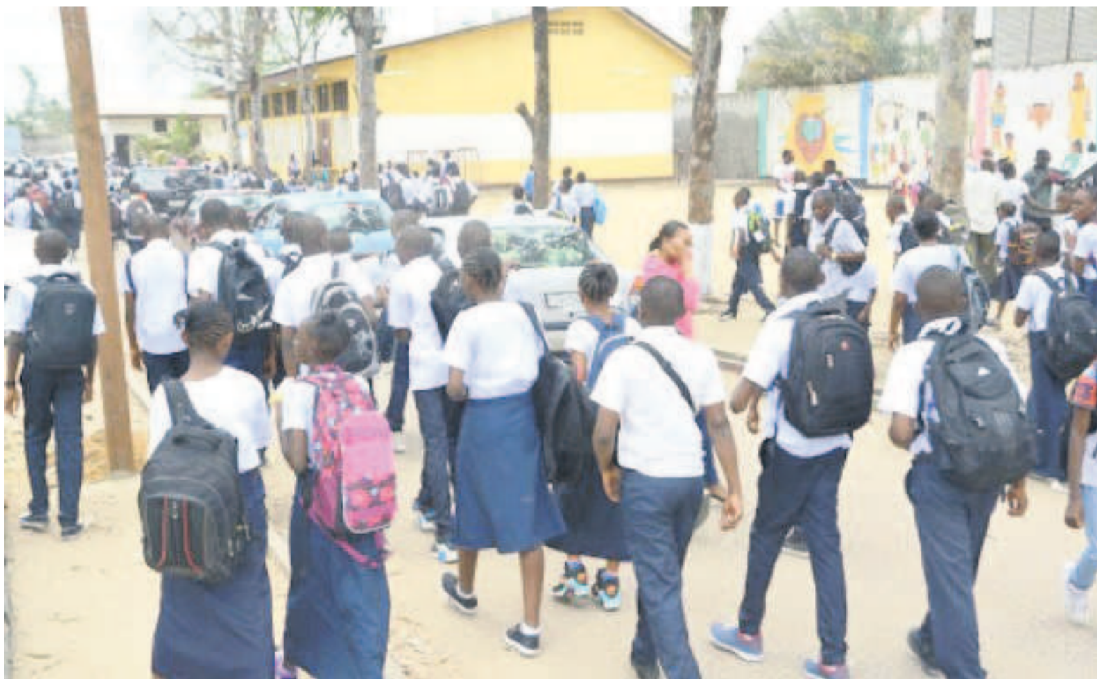
Des élèves traversant une rue à Kinshasa

La Synergie des syndicats des enseignants de la RDC, qui s'était réunie le vendredi 25 août en assemblée générale extraordinaire, a finalement levé l'option d'une grève sèche consécutive à ce qu'elle considère comme indifférence du gouvernement à sa requête. «On s'est rendu compte que l'indexation des salaires qu'il avait promise au mois de juillet n'a pas été respectée, la légère augmentation de salaires, dont il a parlé pour