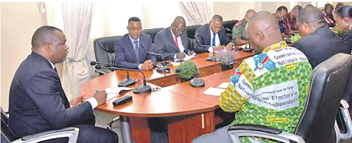
Les participants aux travaux de Kananga

Le premier atelier d'évaluation du processus électoral, qui s'est tenu du 28 au 31 août à Kananga dans le cadre de la tripartite CNSA-Céni-gouvernement conformément au point IV de l'accord du 31 décembre, a finalement livré ses secrets. La réunion a permis à la Céni de mesurer l'ampleur des défis légaux, juridiques, logistiques, financiers et politiques.