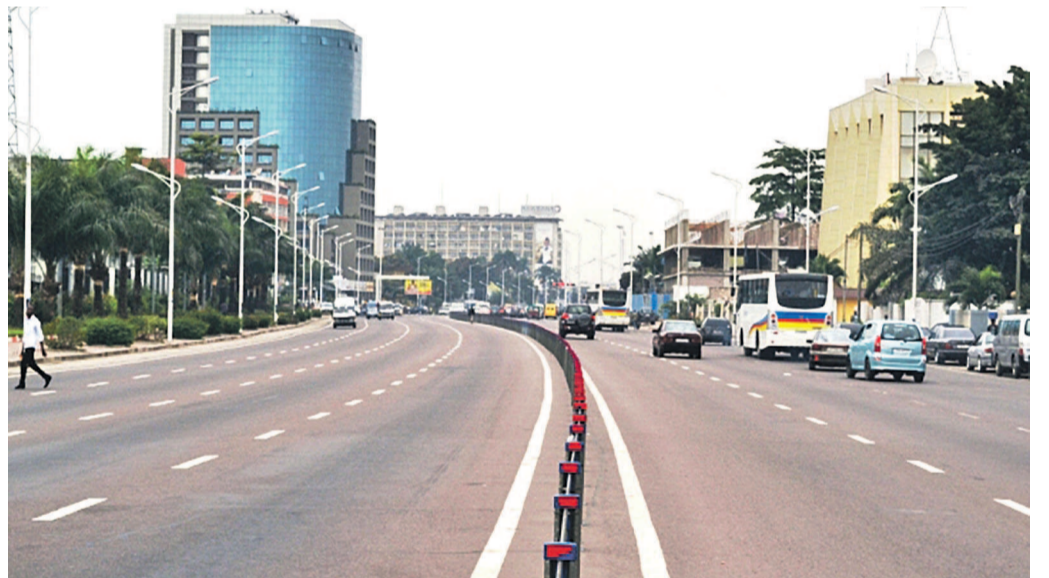
Le centre des affaires à Kinshasa