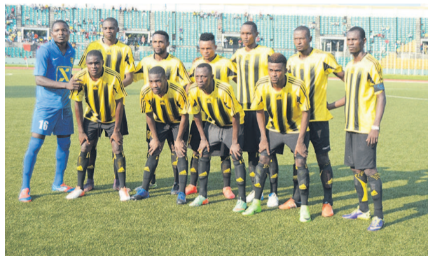
Les Diabes noirs/Adiac

Vainqueurs à Pointe-Noire (2-0) face au FC Nathalys dans le cadre de la fin de la 30 e journée, les Diablotins ont fait le pas le plus important pour le maintien. Encore faut-il confirmer lors des quatre dernières journées.