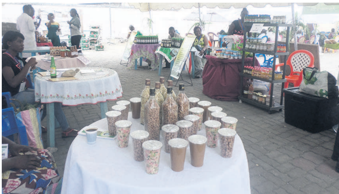
Une vue de l'exposition

Encourager et sensibiliser les Congolais à consommer local En marge de cette exposition, il s'est tenu le 31 août, une conférence-débat sur le thème : « Le consommer local, locomotive de l'alimentation de demain ». Une façon pour les organisateurs de la foire d'encourager et sensibiliser les Congolais à consommer local. Ainsi, des échanges ont porté sur