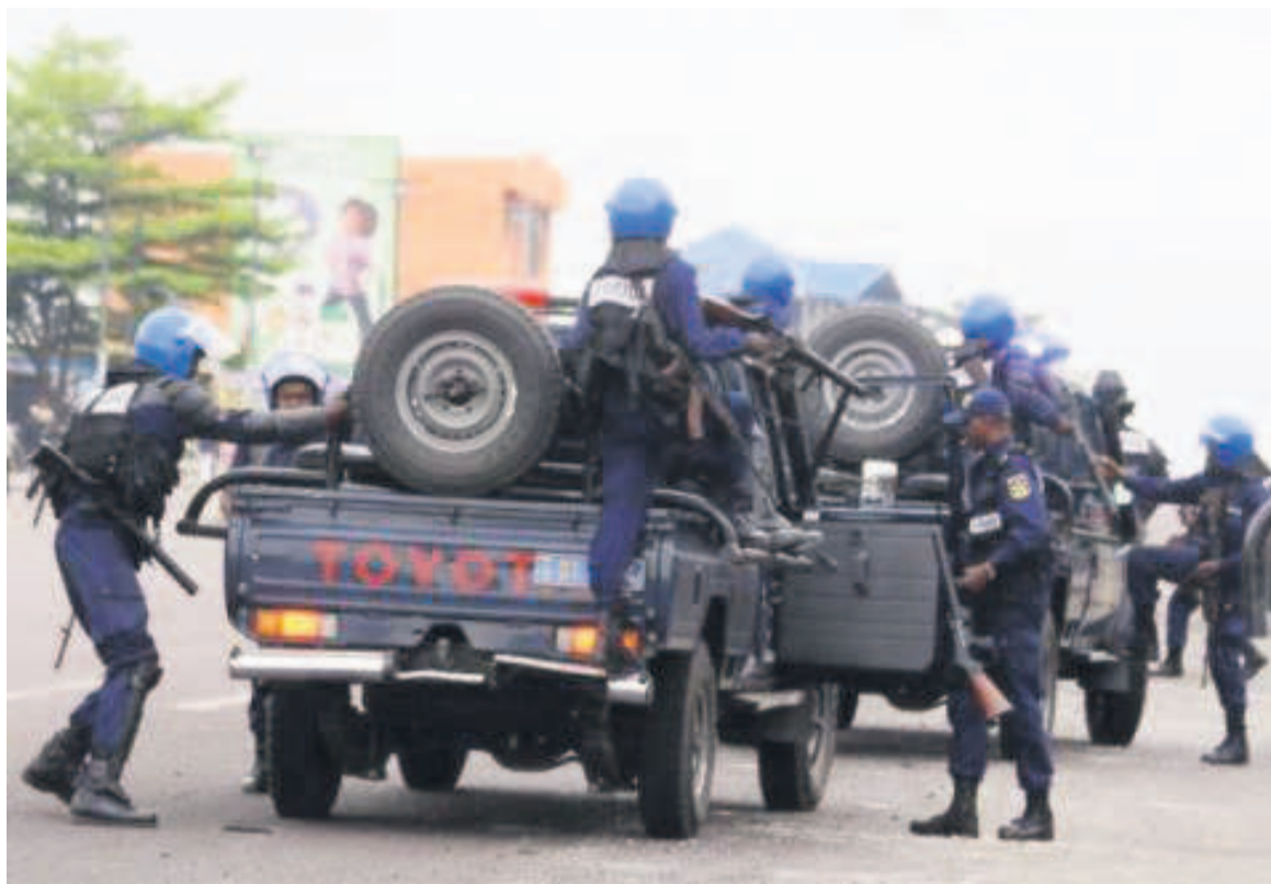
Des policiers congolais

Après le départ de la police et de l'armée, qui était venue en soutien, des jeunes ont érigé des barricades et brûlé des pneus scandant des slogans hostiles au régime, a constaté jeudi un correspondant de l'AFP. Depuis un mois, des vols à mains armées sont régulièrement signalés à Lubumbashi,