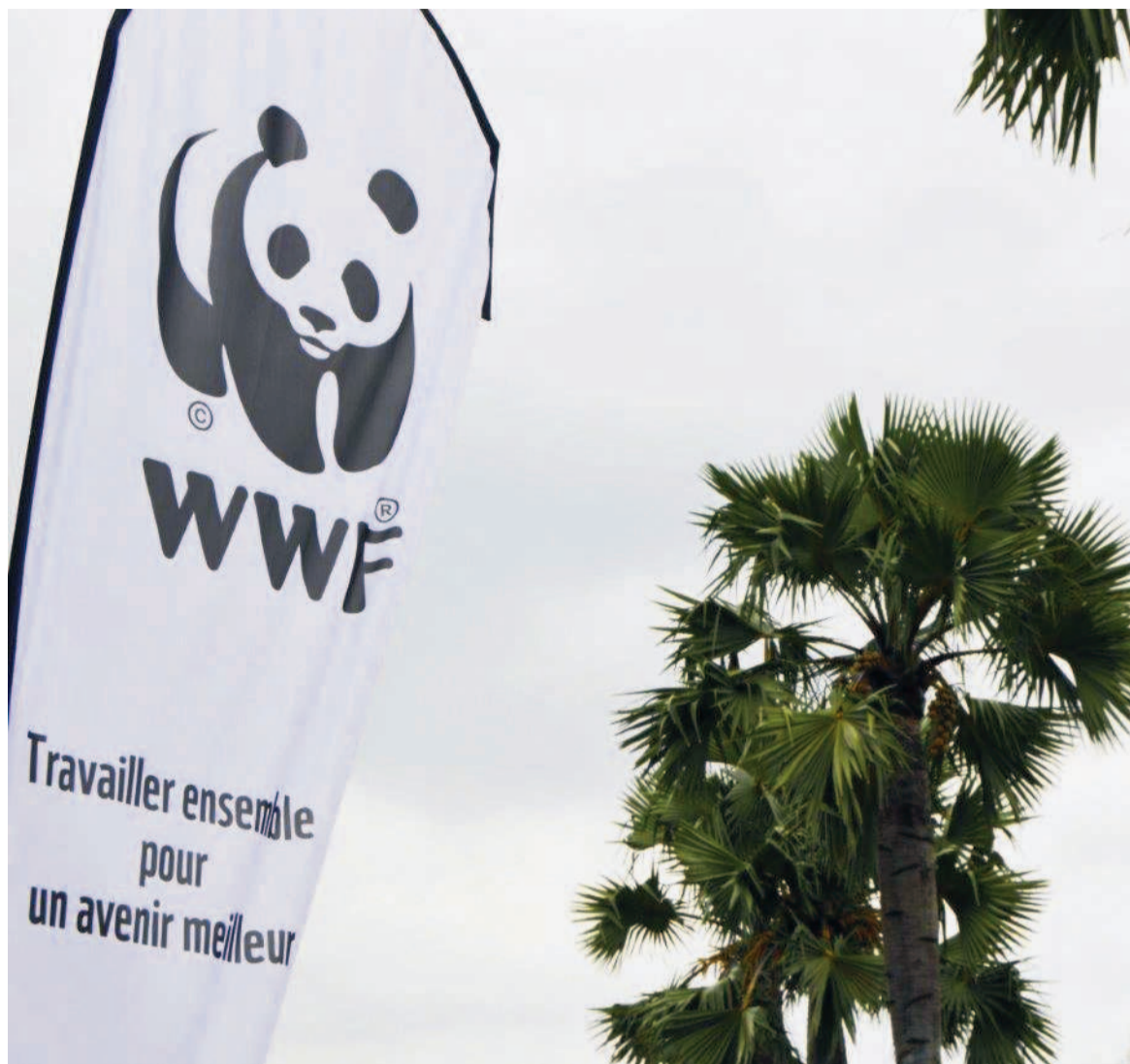
Une enseigne de WWF