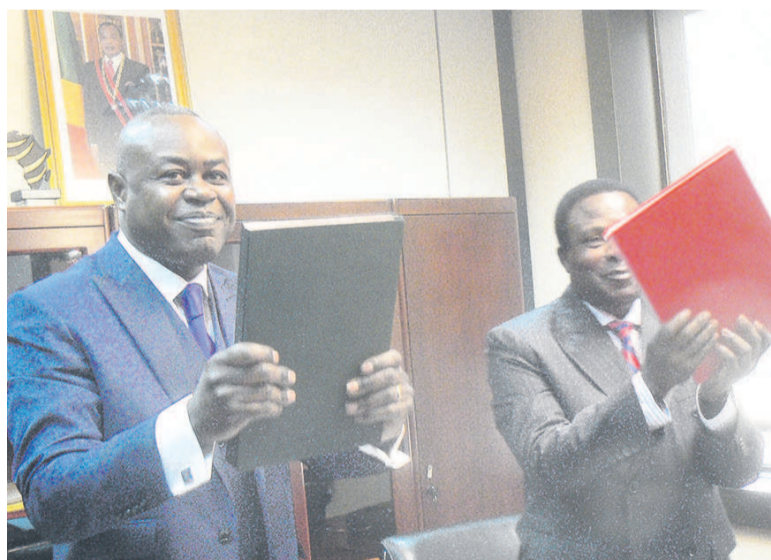
Léon Juste Ibombo et Benoit Bati (adiac)

Le ministre des Postes, des télécommunications qui hérite de l'économie numérique, Léon Juste Ibombo s'est engagé le 31 août à Brazzaville, lors de la passation de service avec le ministre sortant de l'économie numérique et de la prospective, Benoit Bati, à mettre en place l'e-gouvernement et l'e-administration pour moderniser l'administration publique et simplifier les procédures.