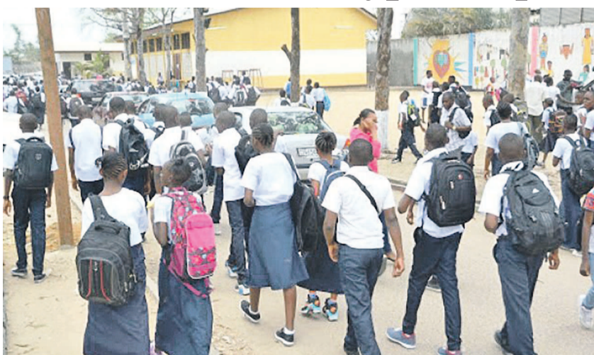
Des élèves dans une rue à Kinshasa