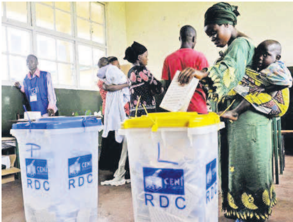
Une dame accomplissant son devoir civique

Par ailleurs, note le communiqué, la Céni a présenté le chemin critique des élections et les agrégats dont dépend l'élaboration du calen-