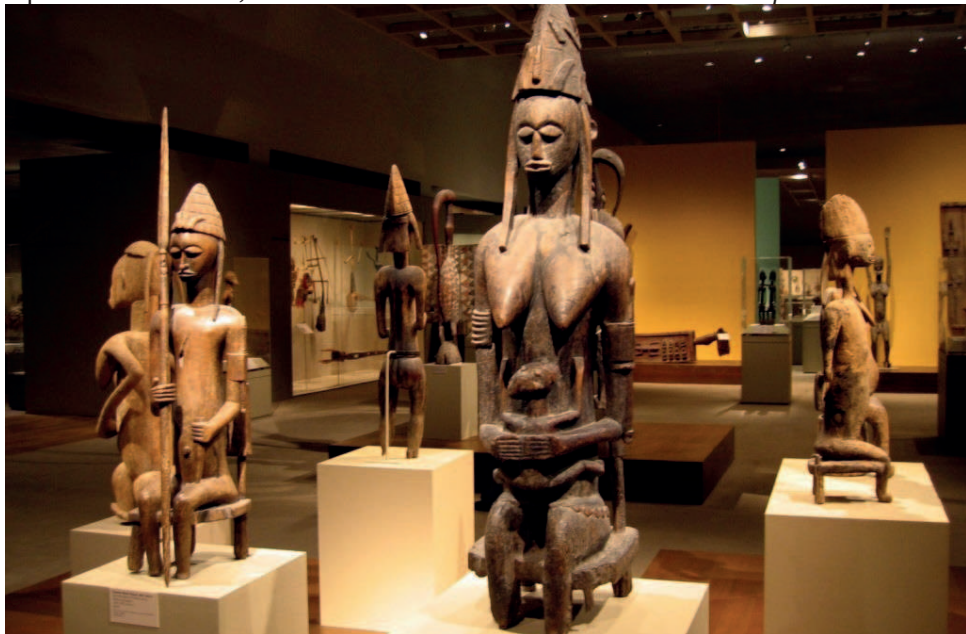
Le musée des civilisations à Abidjan