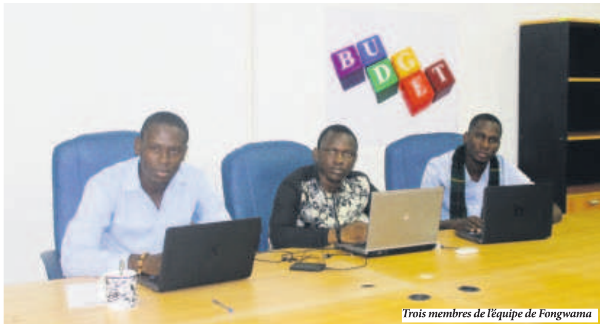
Trois membres de l'équipe de Fongwama

Le mot tiré de l'une des langues locales du Congo-Brazzaville signifie « s'ouvrir » en français. « Fongwama » est donc un programme de développement libre, qui prône une nouvelle manière de réfléchir, de partager et surtout de mettre ses connaissances et ses compétences à la disposition des autres.