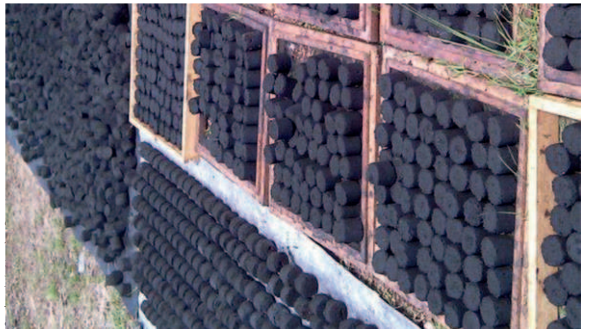
Une vue du charbon vert

Passée l'étape de la collecte, les déchets sont séchés pendant environ six heures pour les déchets légers et 2 jours pour les déchets lourds. « Comme séchoir, nous disposons d'un four solaire de 2 m de hauteur et d'environ 50 cm de largeur,