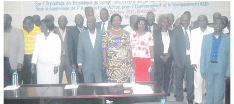
Une vue des participants

L'association Action sur l'environnement et le développement (Aed) a lancé depuis le 13 octobre dernier à Brazzaville, une campagne de sensibilisation sur l'impact sanitaire, social et environnemental de l'exploitation artisanale de l'or au Congo.