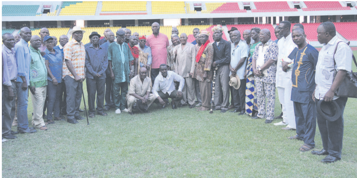
Rituel des notables au stade de l'Unité.

anciens Diables rouges, médaillés d'or aux premiers Jeux africains 1965 et champions d'Afrique 1972, ont également été associés à cette cérémonie. Face au ministre des