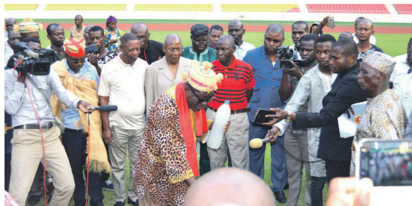
Le rituel sur la place de Kintélé (Adiac)

Dans leur imaginaire, de nombreux Congolais lient les contre-performances des Diables rouges au Complexe sportif La Concorde à un prétendu mauvais sort. A l'initiative du ministère des Sports, une cérémonie mettant en scène des notables de la contrée et des anciens sportifs congolais a été organisée sur place en vue de vaincre ce « signe indien ».