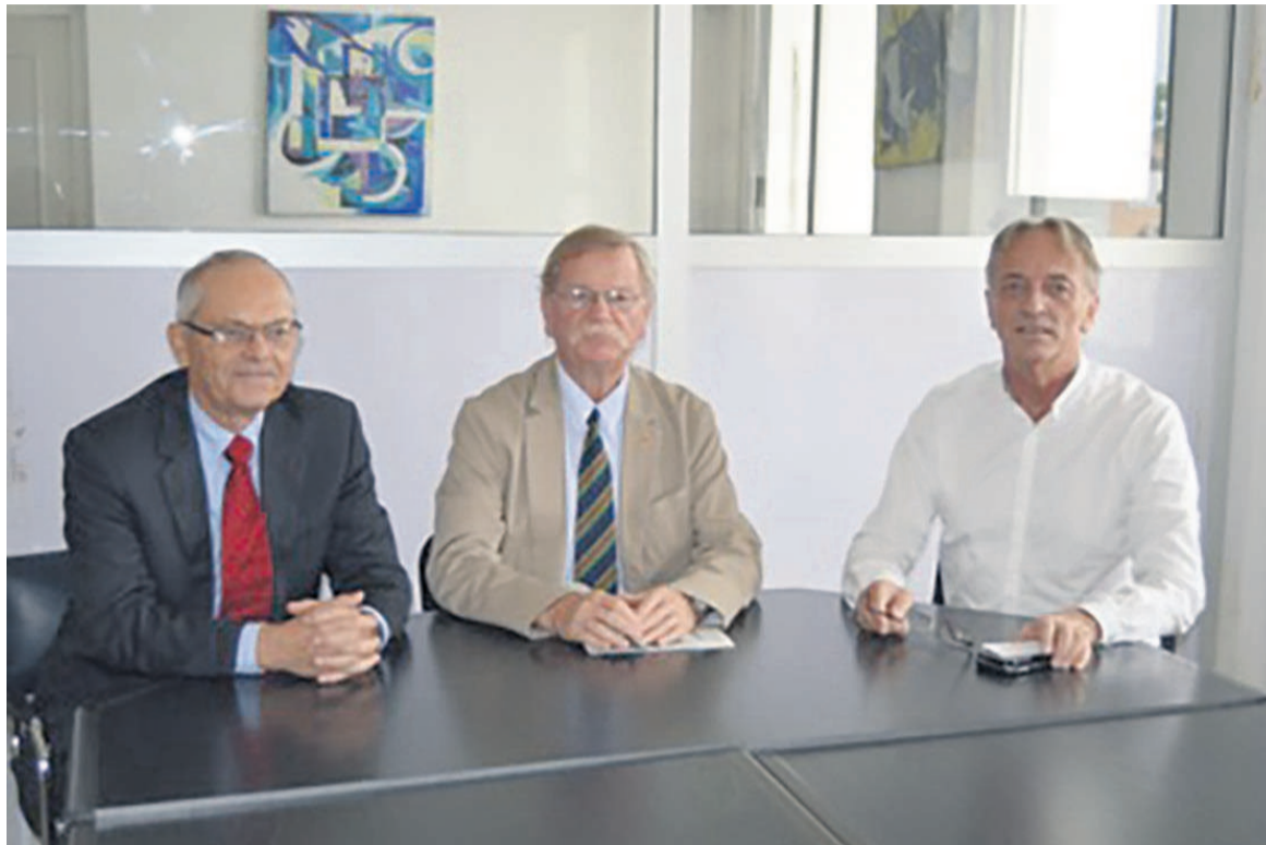
Les membres de la mission d'évaluation