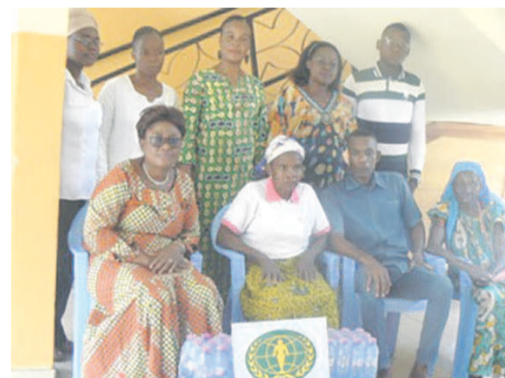
Des responsables de l'ONG en compagnie des pensionnaires de l'auspice Paul Kamba

La Journée internationale des personnes âgées