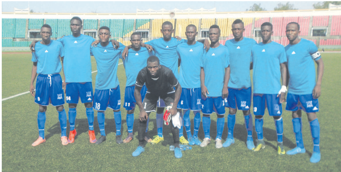
RC Olympique

Si la Fécofoot respecte le quota réservé à la Ligue de Brazzaville (2), le CFFGMT lui aussi jouera en Ligue intermédiaire. Cette équipe qui jouera le samedi prochain la finale de la coupe de la ligue