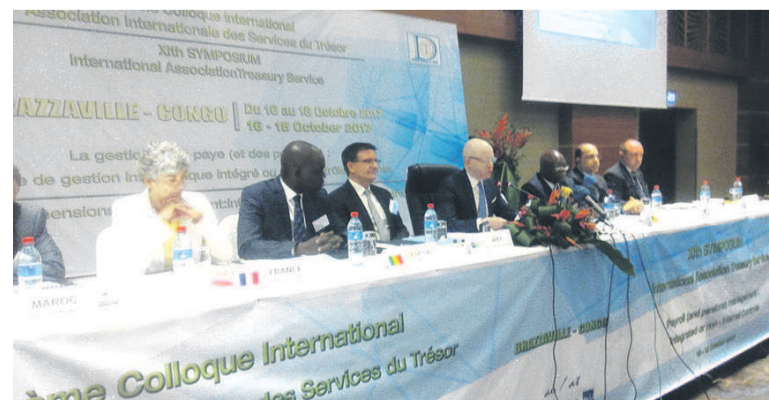
Une vue des officiels