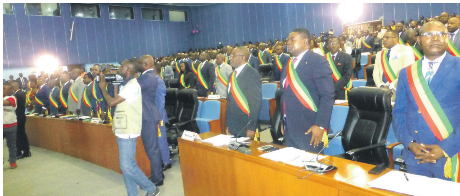
Les députés lors de l'ouverture de la session