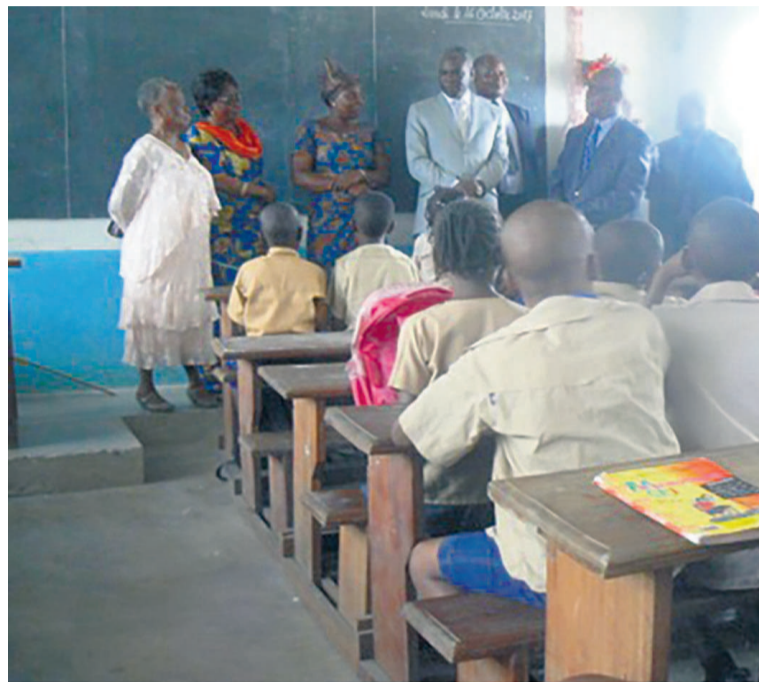
Le ministre Anatole Collinet Makosso face aux élèves du centre de re-scolarisation de Ngamakosso

Le ministre de l'Enseignement primaire, secondaire et de l'alphabétisation s'est rendu, le 16 octobre dans la capitale, dans quelques établissements pour s'assurer du démarrage effectif des cours et s'impéger des problèmes auxquels sont confrontés les enseignants.