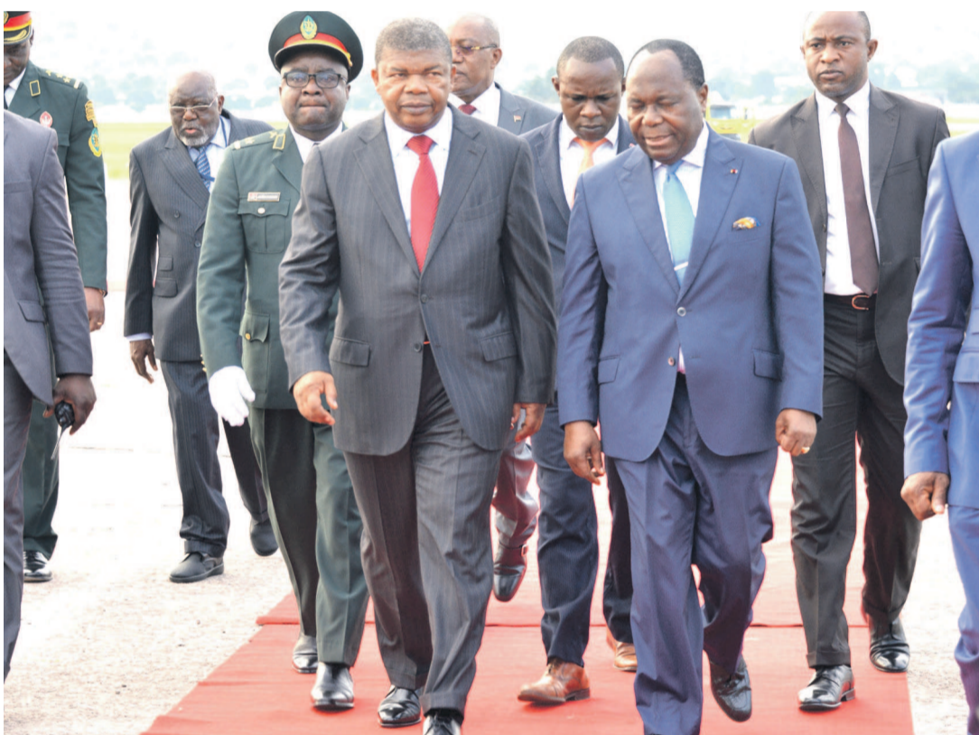
Le président angolais, João Lourenço, accueilli par le Premier ministre, Clément Mouamba à Maya-Maya