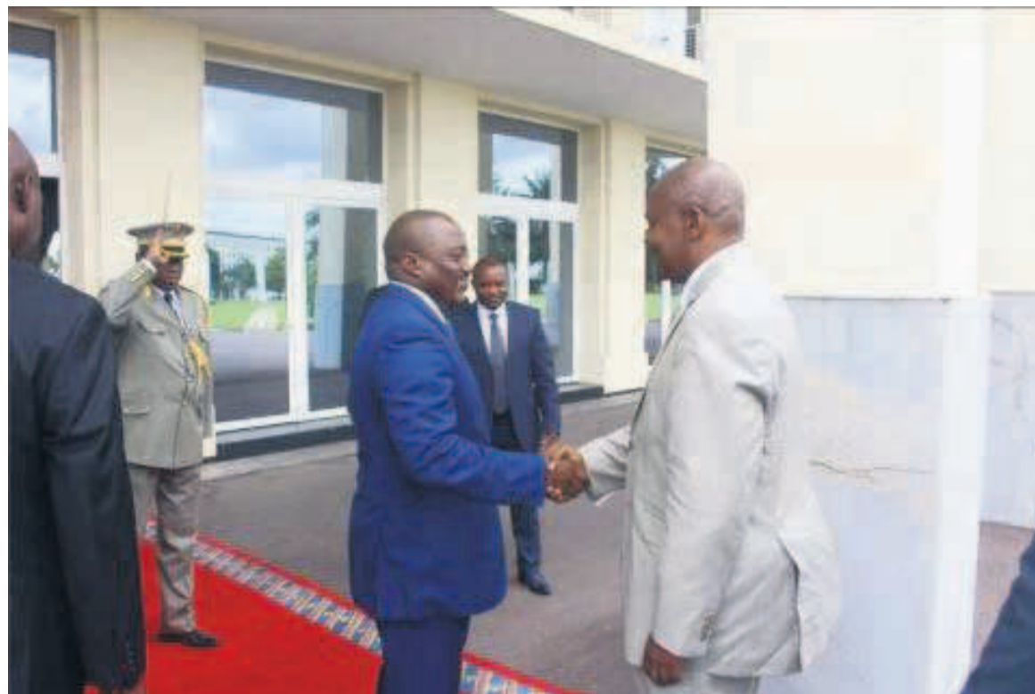
Les présidents Joseph Kabila et Faustin Archange Touadera

Les questions de paix et de sécurité en République Démocratique du Congo (RDC), en République centrafricaine (RCA), mais aussi au Burundi et au Soudan du sud, seront examinées par les chefs d'État des pays membres de la Conférence internationale de la région des Grands lacs (CIRGL), a indiqué, sous-couvert d'anonymat, un responsable de la présidence de la République. La rencontre a été précédée par des discussions entre experts et ministres des Affaires étrangères des douze États membres de la CIRGL