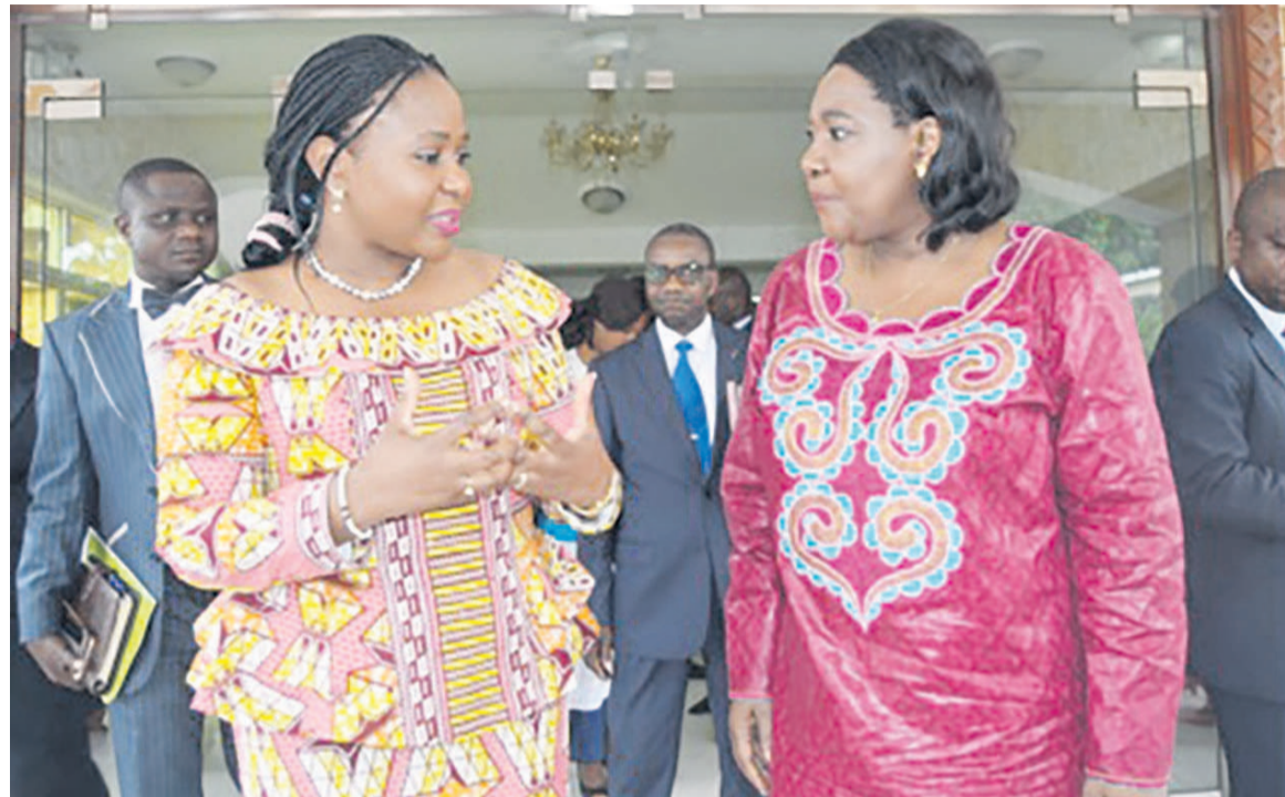
La ministre de la Santé avec la représentante de l'Unicef.