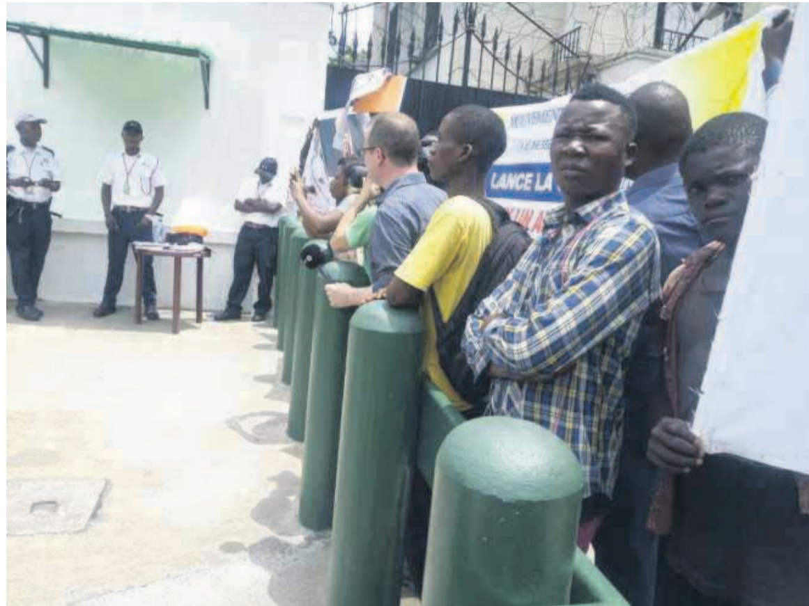
Des jeunes du mouvement Telema Ekoki devant l'ambassade américaine

La dispersion des activistes de Telema Ekoki est intervenue aux alentours de 11 heures quand ils se sont retrouvés devant l'ambassade des États-Unis. Une douzaine