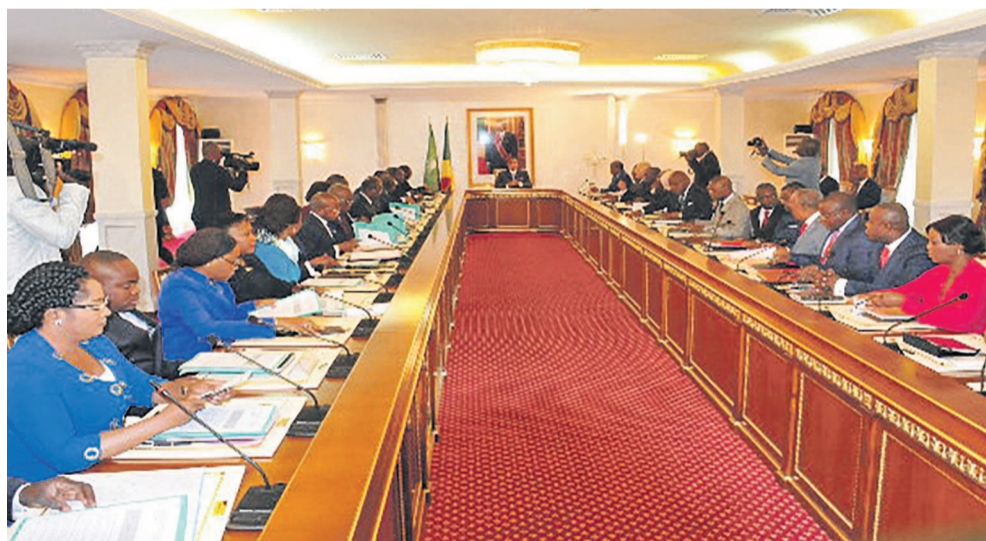
Le Conseil des ministres

Appelée à subir des réformes, la Société nationale des pétroles du Congo (SNPC) va se doter de nouveaux statuts. La SNPC, managée par un directoire depuis sept ans, le sera désormais par une direction générale comme l'a décidé le gouvernement au terme du Conseil des ministres tenu le 17 octobre à Brazzaville.