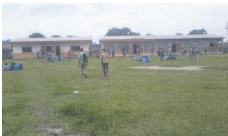
Une vue du lycée Mpaka