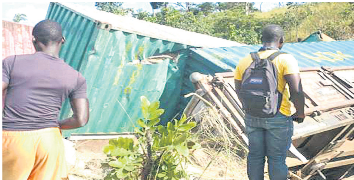
Le train se rendait de Lubumbashi à Luena dans la région minière du Katanga

Le drame s'est produit le 12 novembre, dans le sud-est de la République démocratique du Congo (RDC), selon une source officielle et la radio des Nations unies, «Okapi».