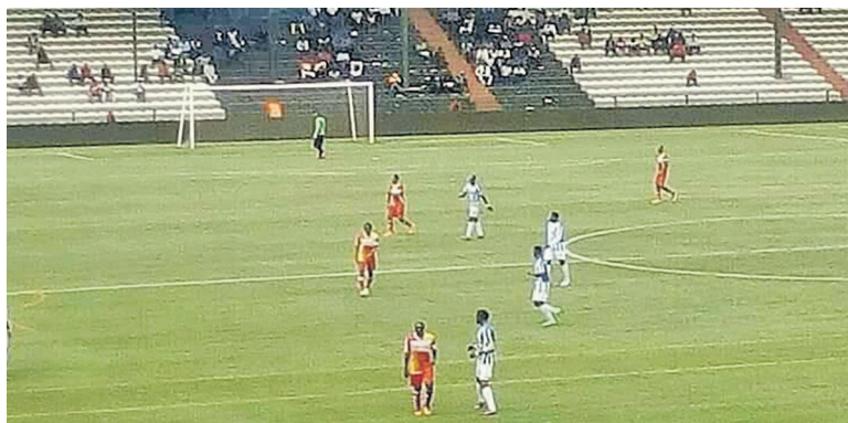
Vue du match entre Mazembe et Ecofoot Katumbi, le 13 novembre, à Lubumbashi

Finaliste de la 14e édition de la Coupe de la confédération, le TP Mazembe a bien démarré la phase des poules de la 23e édition du championnat national de football. Les Corbeaux de Lubumbashi se sont imposés, le 13 novembre, dans leur stade de la commune de Kamalondo, dans la capitale du cuivre, sur les joueurs de l'École de football Katumbi (Écofoot) dans la zone de développement centre sud