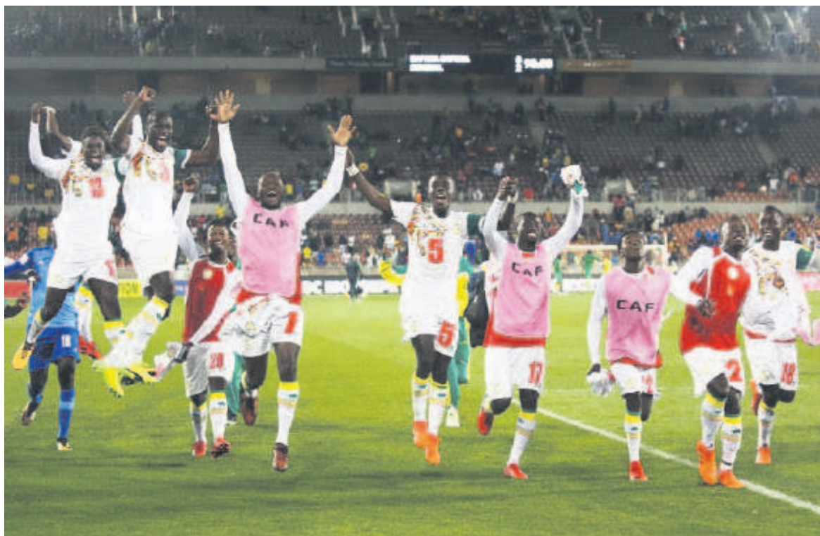
Quart de finaliste en 2002, le Sénégal va disputer le deuxième Mondial de son histoire

Classement : 1) Egypte, 13 pts, 2) Ouganda, 9 pts, 3) Ghana, 7 pts, 4) Congo, 2 pts