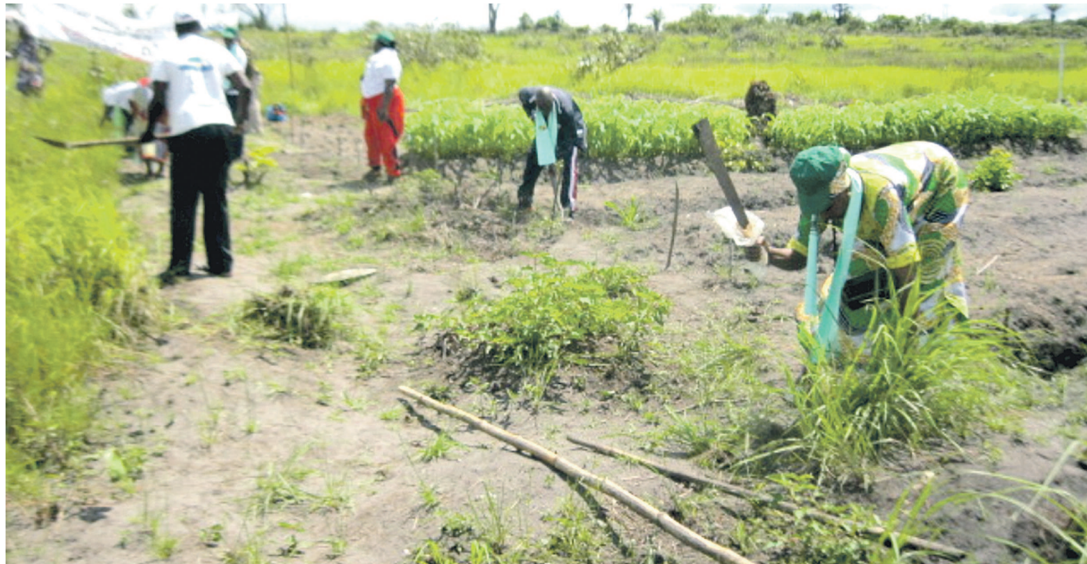
Les membres de la Dobe pendant le lancement des activités

Animée par une ambition positive après sa sortie officielle, la Dobe avait décidé d'élargir son champ d'action, de sortir du cadre social et d'aller vers la création des unités de production. Pour les membres de la Dobe, l'agriculture est la base et la force de la prospérité d'un pays. En se lançant dans cette activité, ils entendent également jouer un rôle d'acteur économique dans leur pays tout en soutenant la politique du gouvernement qui vise à promouvoir la production alimentaire. Le week-end dernier, l'association a mis en exécution son projet agricole d'investissement collectif à Hinda, dans le département du Kouilou. La manifestation a notamment permis à la Dobe de créer un contact et de marquer symboliquement la