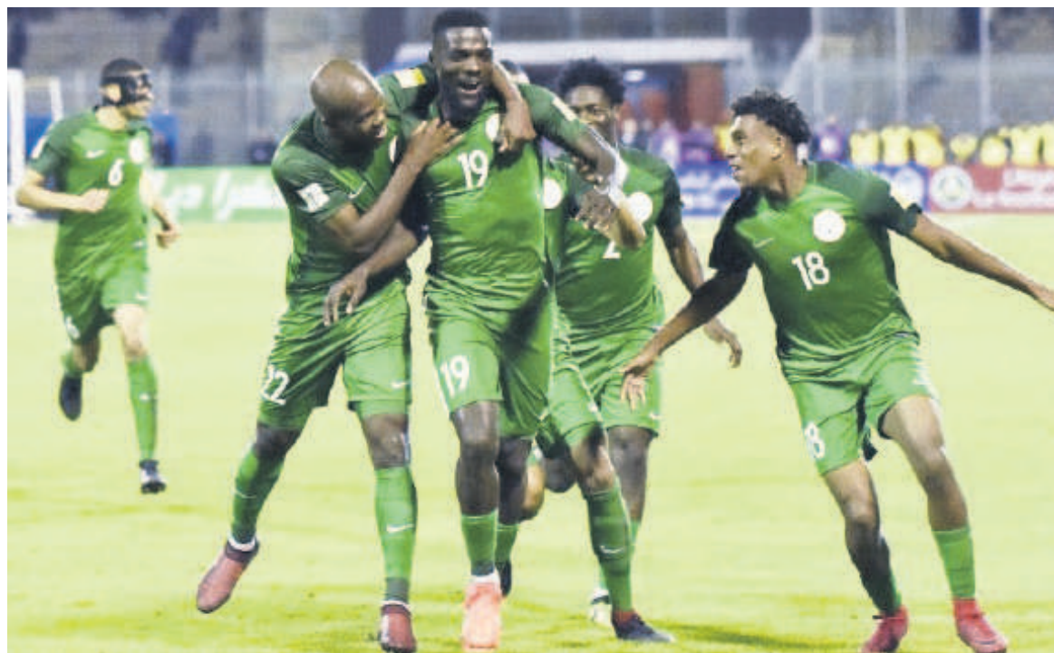
Les Super Eagles, déjà qualifiés, finissent par un match nul en Algérie

faut d'avoir été difficile (avec un Ghana vieillissant, un Ouganda volontaire et un Congo