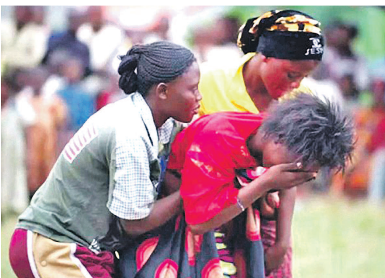
Une victime des violences sexuelles en pleurs

concernés directement par ce dossier est requis. La Primature est concernée par le processus en cours, d'autant qu'elle a apposé sa signature dans le communiqué conjoint de mars 2013 qui représente le cadre de collaboration technique liant la RDC et les Nations unies dans la lutte contre les violences sexuelles. Page 4