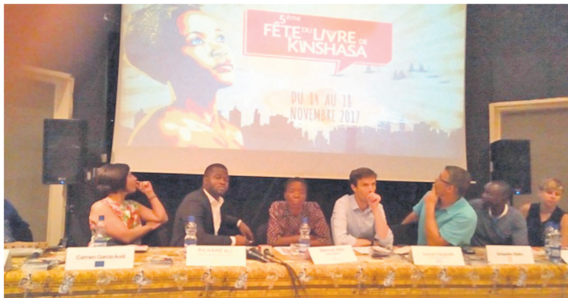
Les organisateurs de la Fête du livre lors de la conférence de presse

L'on retiendra aussi de la programmation de cette cinquième édition de la Fête du livre que c'est à l'IF que Yasmina Khadra tiendra sa première conférence. Ce sera à la médiathèque de la Halle de la Gombe, à quelques heures de l'ouverture solennelle de l'événement, le 14 novembre. Cette