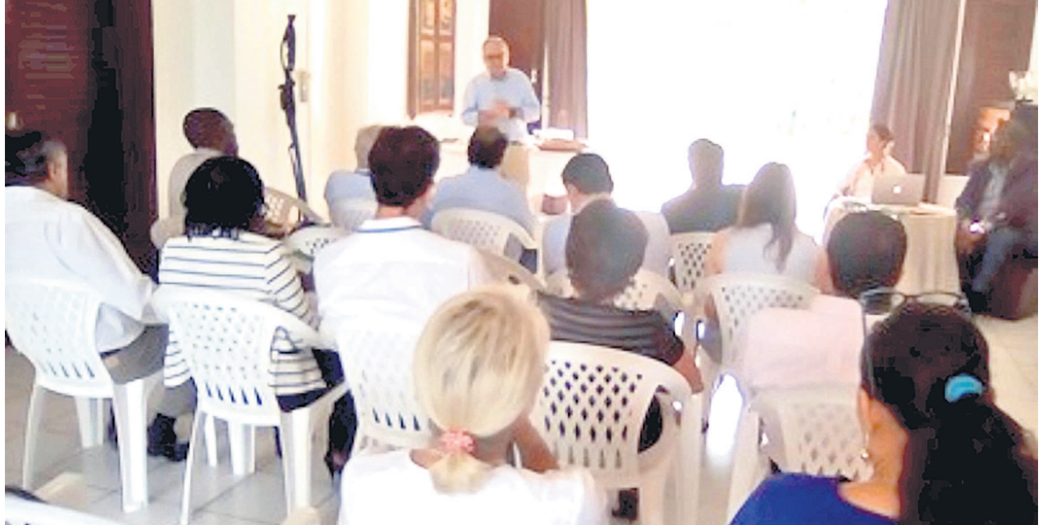
Une vue de la salle lors de la rencontre

Cette organisation assure aussi la formation du personnel médical. Il y a également une formation continue « In situ » du personnel soignant en tenant compte des besoins. Dans ce cadre, elle a déjà organisé 39 formations dans tous les domaines de la santé. 800 personnes au total ont été formées par des médecins bénévoles français qui se relaient sur le terrain afin de renforcer les capacités du personnel soignant local. Dans l'ensemble, environ 500 000 personnes bénéficient de soins de qualité et adaptés à travers