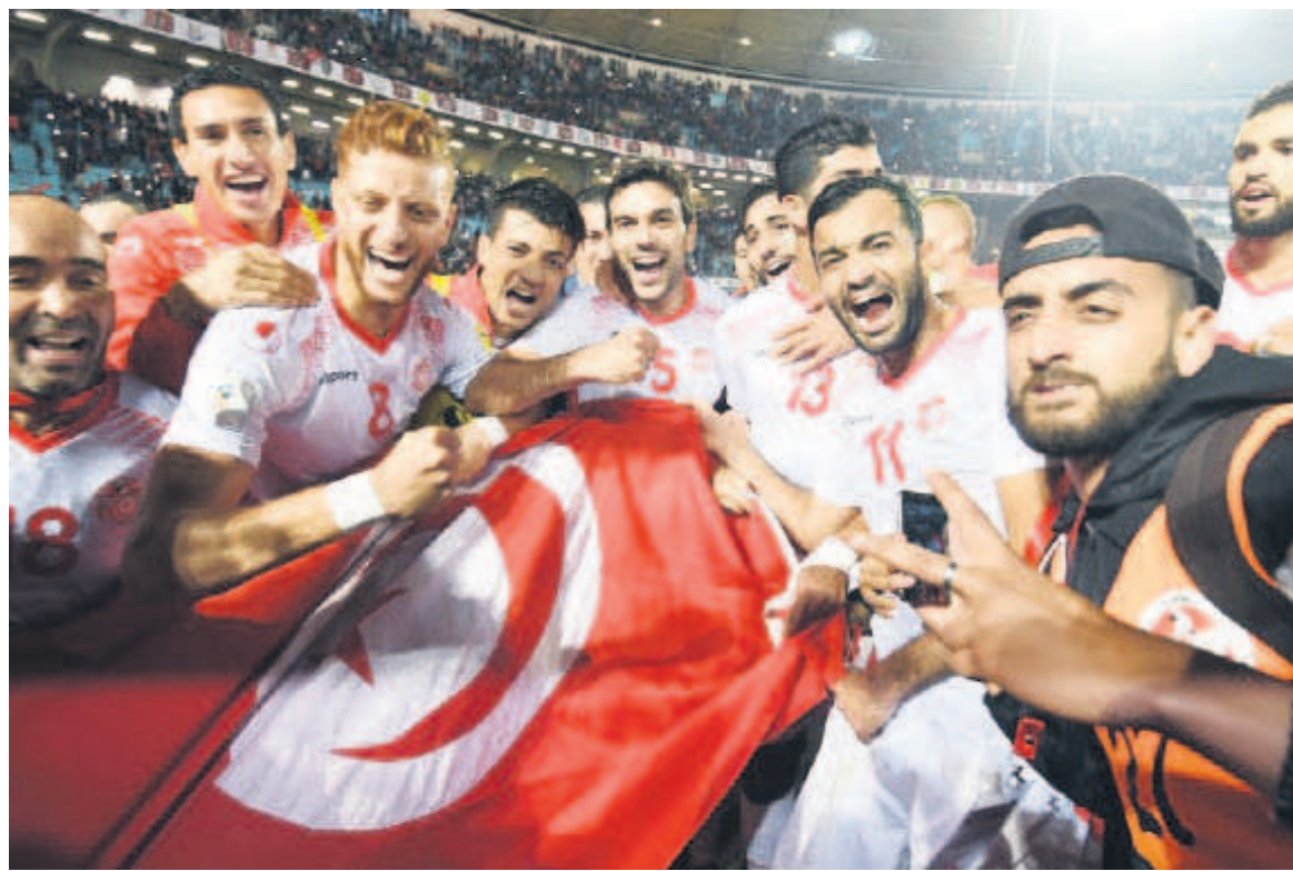
Les Aigles de Carthage savourent leur qualification

Si ces « cadors » ont déçu durant ces éliminatoires, d'autres ont convaincu, à l'image du Maroc, d'Hervé Renard. Les Lions de l'Atlas retrouvent une compétition qu'ils n'avaient plus fréquentée depuis France 98. Une longue parenthèse est ainsi refermée, permettant au technicien français, double champion d'Afrique, de vivre son premier Mondial. Dans un groupe C relevé, le Maroc termine invaincu (3 victoires et 3 nuls) avec en point d'orgue