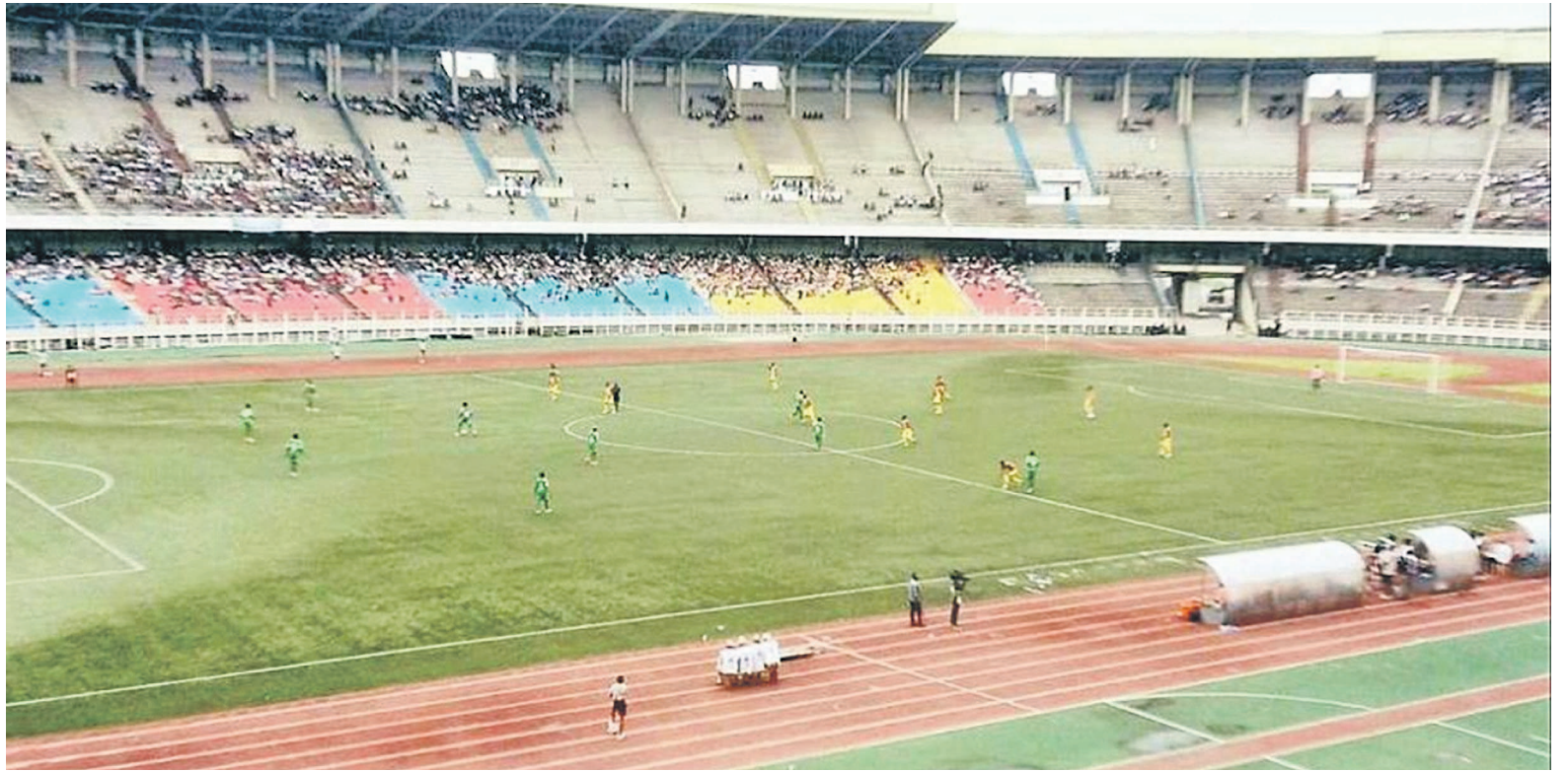
Vue du match entre Renaissance contre FC MK le 12 novembre