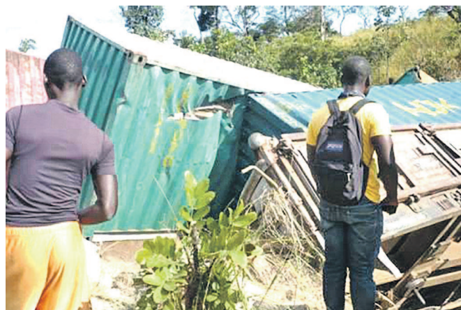
Le train se rendait de Lubumbashi à Luena dans la région minière du Katanga

avant de finir sa course dans un ravin. Outre des marchandises, le convoi transportait treize wagons dont des citernes d'essence. Les passagers se trouvant à bord seraient montés illégalement. Il est fait état de trente-trois tués, plusieurs blessés et brûlés dans cet accident. Page 4