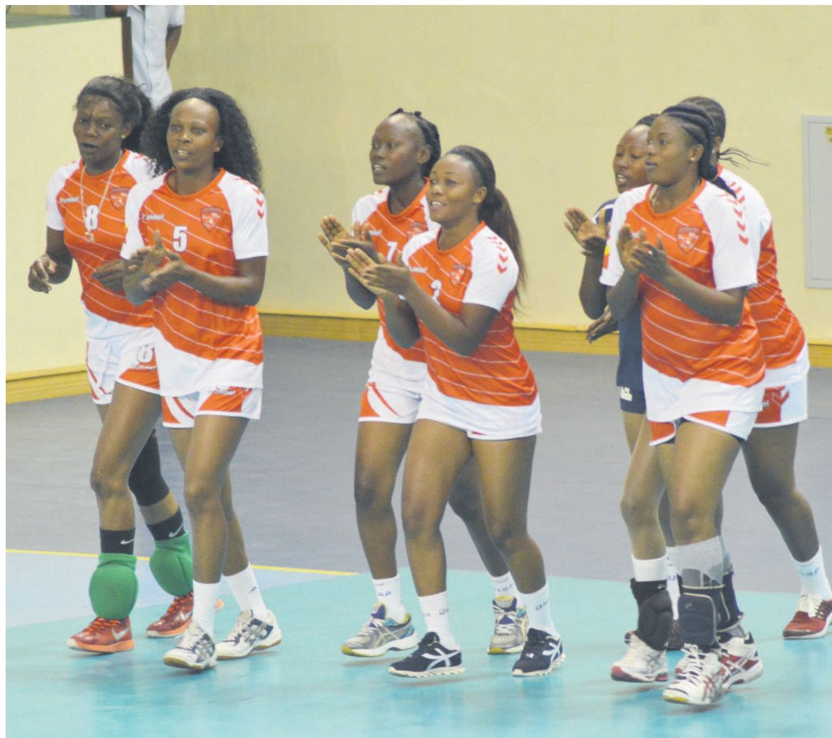
La DGSP championne d'Afrique centrale

Les joueuses de la Direction générale de la sécurité présidentielle (DGSP) ont remporté, le 12 novembre au gymnase Henri-Elendé à Brazzaville, la 4e édition des championnats d'Afrique centrale des clubs, en dominant Vita Club de la République démocratique du Congo (RDC) 3 sets à 2, au bout d'une finale au suspense incroyable.