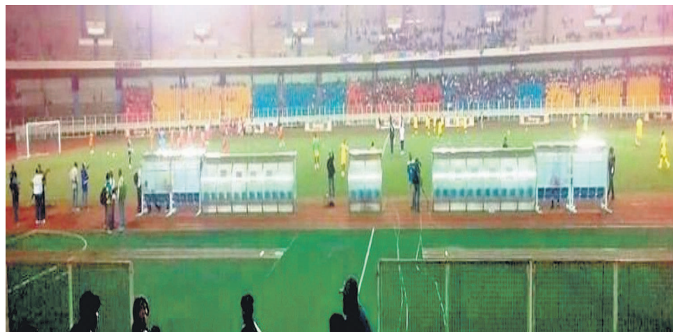
Vue du match entre RDC et Guinée, le 11 novembre, au stade des Martyrs à Kinshasa

On rappelle qu'Ibenge avait été chargé, lors de son arrivée à la tête du staff technique national, de qualifier la RDC à la phase finale de la Coupe d'Afrique des nations. Mais la qualification à la Coupe du monde Russie 2018 a été son ambition