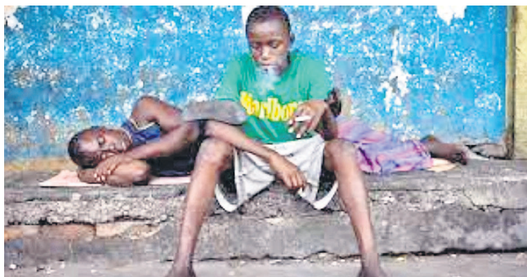
Enfants de la rue, potentiels acteurs de mauvais actes

Les causes du phénomène sont nombreuses, entre autres, sociales, économiques et culturelles. « Rien n'est plus important que de bâtir un monde dans lequel tous nos enfants auront la possibilité de réaliser pleinement leur potentiel et de grandir en bonne santé, dans la paix et dans la dignité », disait Kofi A. Annan, l'ancien secrétaire général de l'Organisation des Nations unies. Et lorsqu'on interroge certains chefs de famille sur ce phénomène des enfants de la rue, ils répondent sans hésitation que sa constance proviendrait de la marginalisation desdits enfants surtout sur le plan social. Mais sa persistance serait alimentée par des facteurs connus tels le manque de la protection familiale, le rapport à certaines croyances religieuses, l'irresponsabilité des parents, la fréquentation de cer-