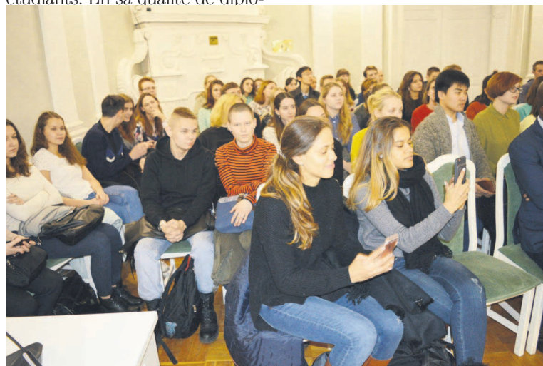
Une vue des étudiants russes

Le parcours universitaire de l'actuel ministre des Affaires étrangères dans la ville où il a exposé, sa connaissance du sujet abordé et le fait que son pays, le Congo, a évolué sous les couleurs du marxisme-léninisme, ont été également de beaucoup dans la confiance qu'il a pu susciter auprès de son auditoire.