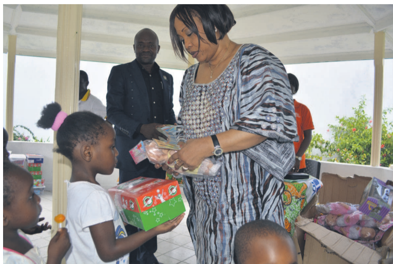
Séance de distribution des cadeaux aux plus petits

C'est le cas de l'orphelinat « Notre dame de divine miséricorde, Espace Morgane » qui a fait peau neuve grâce à la contribution de l'épouse du chef de l'Etat. En effet, l'intérieur de ce centre qui compte soixante-quatre enfants a été complètement aménagé et repeint. A l'extérieur, un hangar a été construit et des pavés installés pour mettre un terme aux