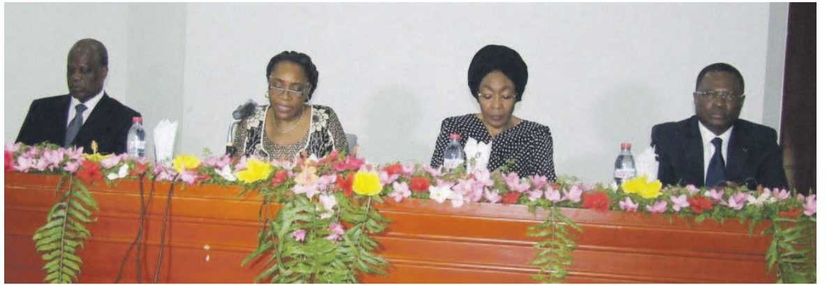
Les quatre membres du gouvernement au lancement de l'atelier

L'étude prospective proposée est la démarche qui vise, par une approche rationnelle et holistique, à réunir les conditions pour les projets futurs. Elle ne consiste pas à prévoir l'avenir mais à élaborer des scénarios possibles et impos-