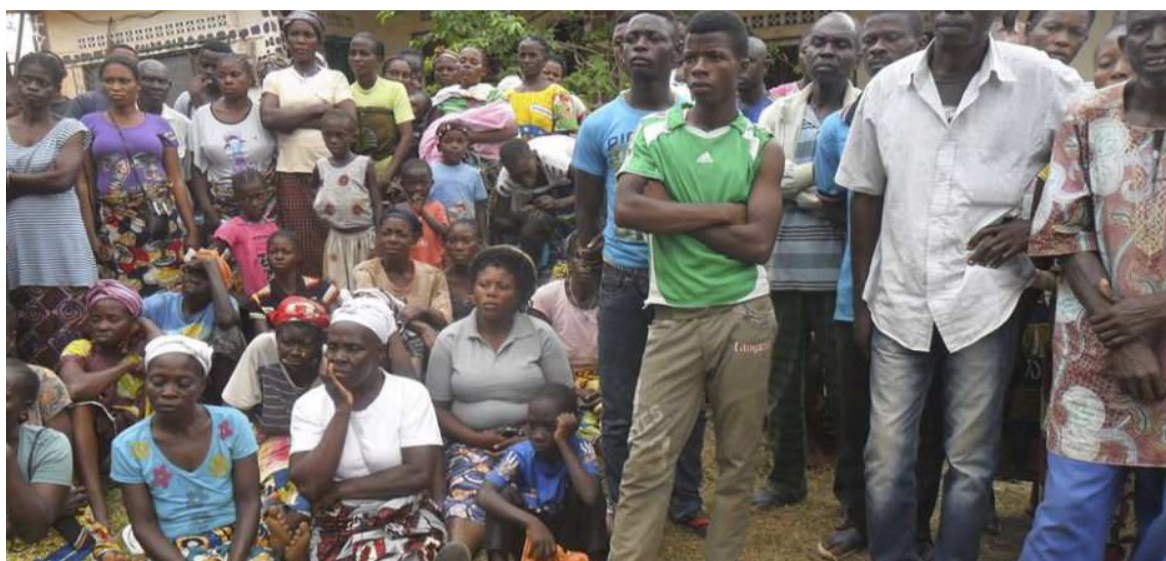
L'Accord prévoit le retour des déplacés dans leurs villages

Au fait, à quoi aura servi ce énième coup de sang du pas-