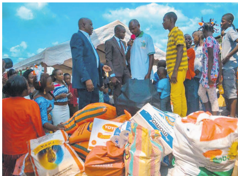
L'encadreur de l'orphelinat s'exprimant après avoir reçu le don