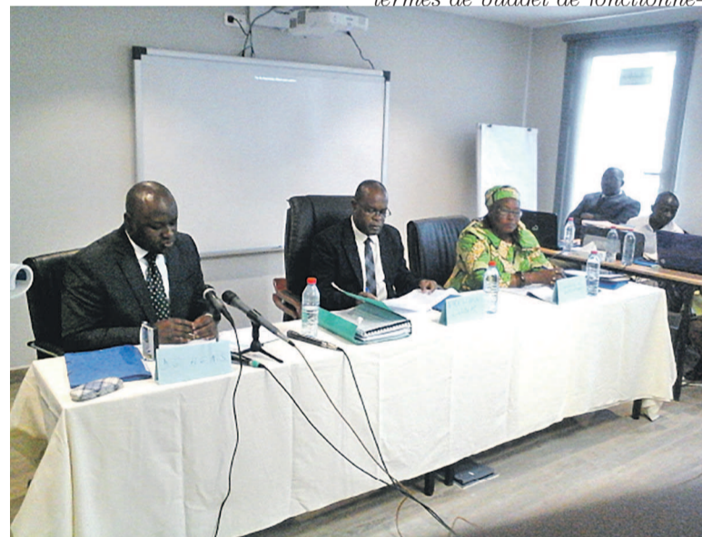
La tribune officielle lors des travaux du comité de direction

L'augmentation et l'amélioration de la qualité des soins et des services à l'hôpital général Adolphe-Sicé de Pointe-Noire ont été au centre des échanges de la session inaugurale du comité de direction de cette structure sanitaire pour répondre aux attentes de la population qui en est la principale bénéficiaire. « Au nombre de maux dont souffre l'hôpital général Adolphe-Sicé, on peut citer la structure pavillonnaire qui s'étend sur plus de sept hectares, l'encombrement des services d'hospitalisation et l'errance des parents et autres gardes malades, la vétusté des bâtiments datant des années 1930, les réseaux d'adduction d'eau et d'électricité, l'insuffi-