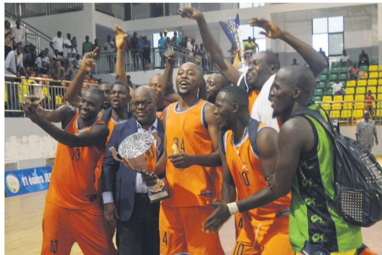
Le président de la Fécoket avec les basketteurs d'ASG

En dehors des performances collectives, des talents individuels se sont révélés: Kas-