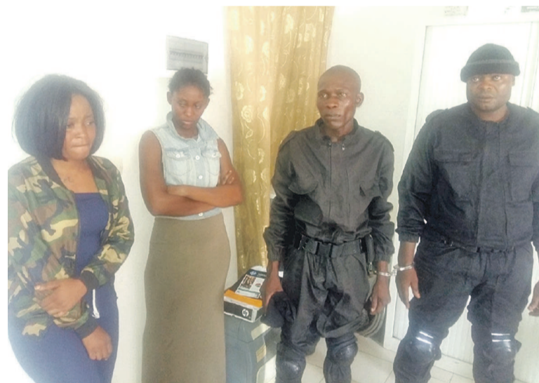
Les malfaiteurs et les filles arrêtés

Deux hommes hors-la-loi de nationalité congolaise ont été présentés, le 25 décembre à la presse, par les services de police du Kouilou et de Pointe-Noire commis à l'opération Uppercut plus 2017.