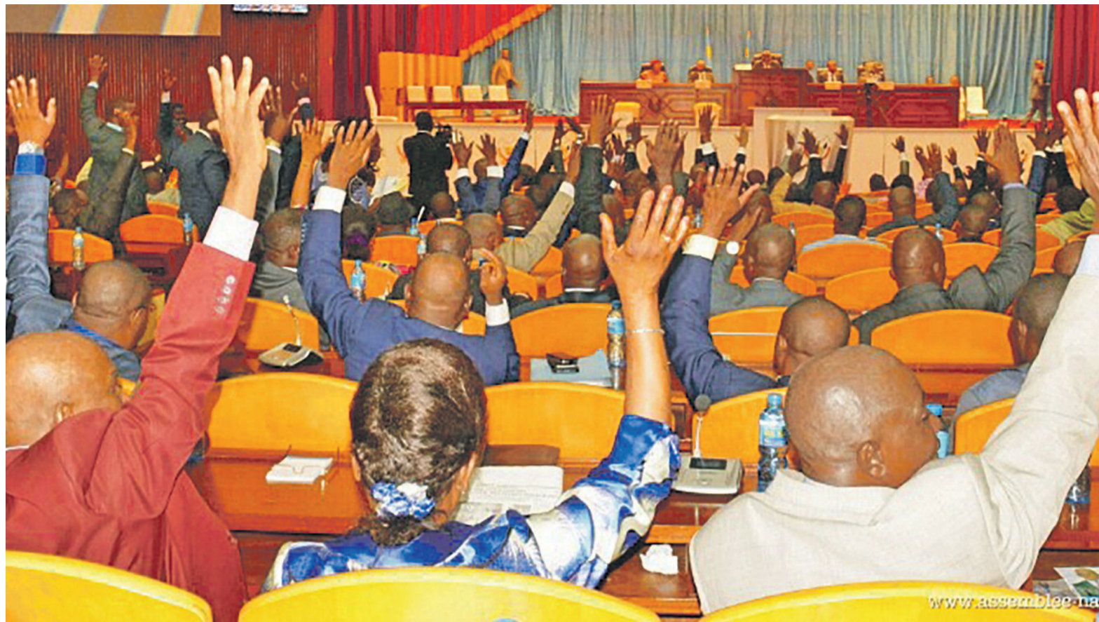
Des députés lors d'une séance plénière

Au niveau de la commission paritaire mixte Assemblée nationale-Sénat où le texte a été envoyé pour un dernier nettoyage, il s'avère que ces deux points principaux de désaccord sont restés en état, sans qu'un modus vivendi ne soit trouvé entre