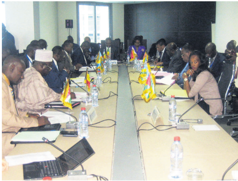
Les ministres de la CEEAC réunis à Brazzaville cipe de supranationalité du projet de Convention afin d'accélérer le processus de son adoption et de permettre à la Communauté de se doter d'un instrument de prévention et de résolution pacifique des conflits liés à la gestion des ressources en eau partagées », a signifié le conseil des ministres de la

Ils devaient, en outre, lever les réserves émises par certains Etats sur la portée du principe de « supranationale » introduit en 2009 dans la po-