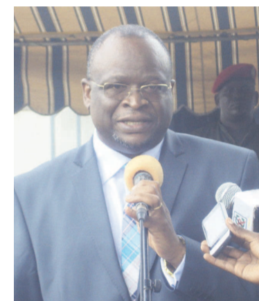
Guy Brice Parfait Kolelas

né le point de vue de son parti dans le communiqué final sanctionnant la réunion du bureau politique du 25 décembre. « Le bureau politique de l'Union des démocrates et humanistes (Udh-Yuki), en réunion extraordinaire ce jour, prend acte de l'accord de cessez-le-feu et de cessation des hostilités dans le Pool, conclu le samedi 23 décembre à Kinkala entre le gouvernement de la République du Congo et le