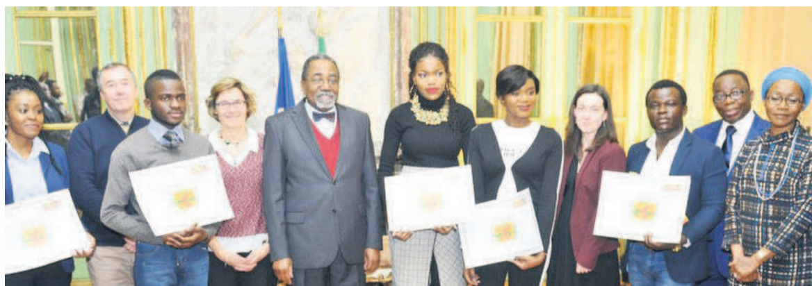
Les étudiants congolais posant avec l'ambassadeur du Congo en France Rodolphe Adada