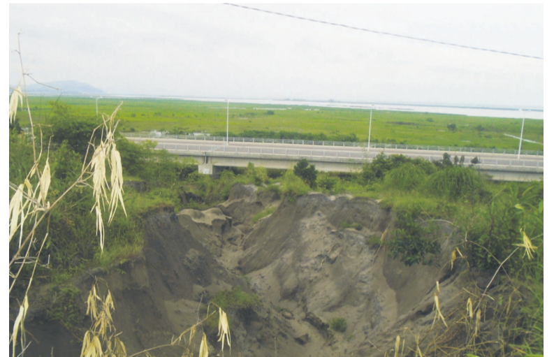
Une vue d'une érosion déclarée à quelques encablures du viaduc

Le ministre Pierre Mabiala a souligné que conformément à la loi, il ne s'agira pas d'une expropriation lé-