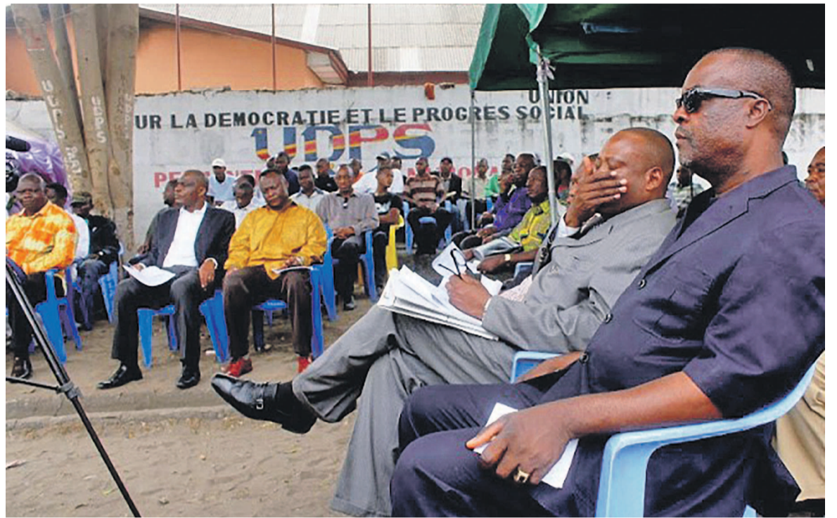
Une réunion de la Ligue des jeunes de l'UDPSOKOK

Et coup de théâtre. Alors qu'il s'attendait le moins du monde, le notaire sera appréhendé le 23 décembre par les services spéciaux de la Police nationale et déferé au parquet général de Matete. Principaux griefs retenus à sa charge : insubor-