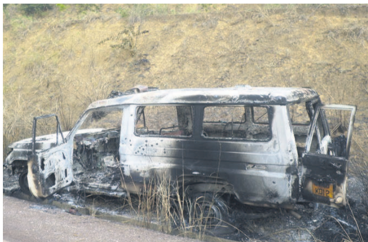
Cette ambulance incendiée par les miliciens dans le Pool a marqué les esprits

en situation macro-économique difficile, ne pourrait mener à bien sans le concours de ses partenaires extérieurs. Heureusement que certains de ces partenaires ont pris la mesure de la chose en apportant de l'aide humanitaire aux déplacés. Ils pourront sans doute accompagner le DDR envisagé. Combien sont-ils au total ces ex-combattants à absorber par la réinsertion ? Un millier ? Un peu moins ? La tâche qui attend la Commission ad hoc paritaire de suivi est lourde et mérite d'être menée avec doigté. D'autant que se posera aussi, finalement, la question de Frédéric Bintsamou lui-même.