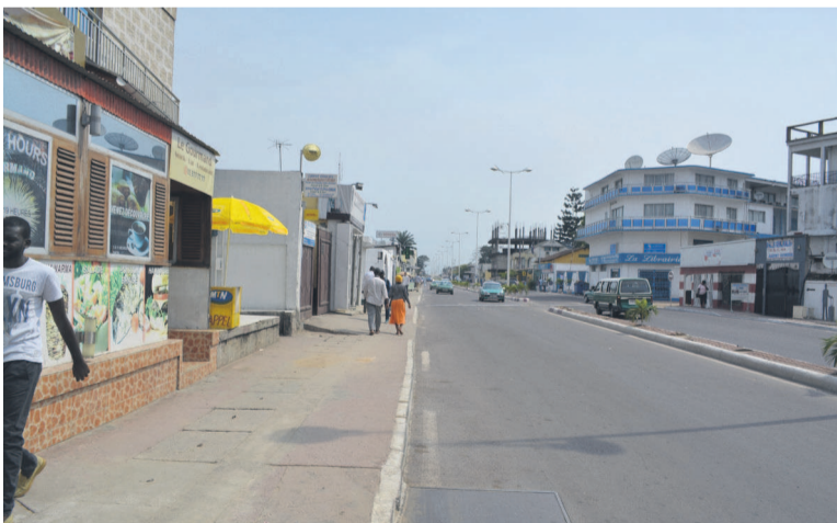
Pas d'embouteillages ce mardi sur les grandes artères de la capitale

a été fluide, contrairement aux bouchons et affluences dans les arrêts de bus constatés la veille.