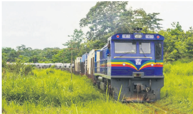
Peut-être le train pourrait-il à nouveau emprunter le CfcO