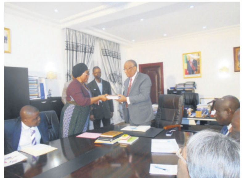
Le ministre recevant le rapport final

Notons que la première édition fait suite à la signature d'un accord de partenariat entre le ministère et la société Clavis Atlas Service, le 15 septembre