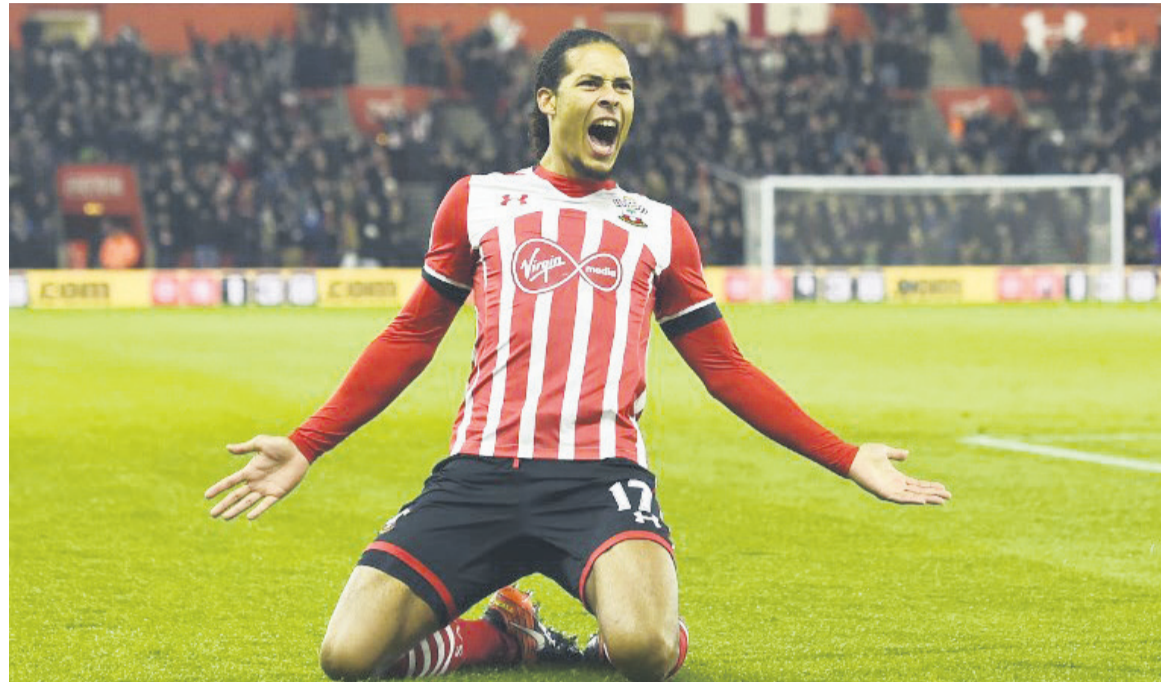
Passé de Southampton à Liverpool pour 84 millions d'euros, le Néerlandais Virgil Van Dijk devient le défenseur le plus cher de l'histoire

Quant à l'attaque, c'est notamment du côté d'Arsenal que le marché pourrait s'animer. L'attaquant chilien Alexis Sanchez semble sur le départ et les Gunners sont toujours dans le flou au sujet de Jack Wilshere et Mesut Özil, tous deux en fin de contrat en juin.