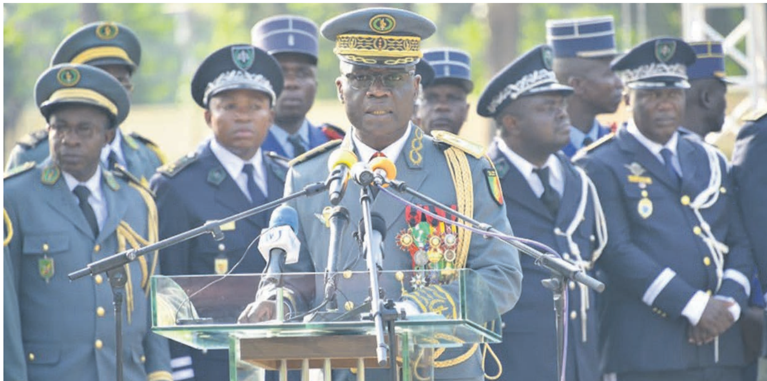
Le général Guy Blanchard Okoi dressant le bilan de la Force publique

profondissement de l'instruction des hommes, gage de performance et de qualité de leur rendement; de la poursuite résolue des engagements opérationnels dans un esprit de fermeté et d'adaptabilité pour la crédibilité des FAC; la sécurité des personnes, des biens et des institutions. Le CEMG a aussi indiqué que les réformes structurelles et doctrinales seront poursuivies, en vue d'une