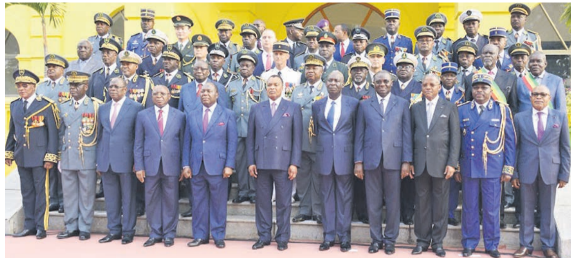
Le chef de l'État, des membres du gouvernement, le haut commandement de la Force publique et des attachés de Défense

Devant le haut commandement du 23 décembre, il pense à ce qui tion de la Force publique à tous