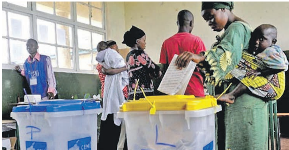
Une électorale dans un bureau de vote à Kinshasa

Autant dire que tous les yeux sont à présent rivés sur la Céni qui doit mettre à contribution son expertise pour conduire les Congolais aux élections à cette date, quitte au gouvernement de faire sa part en lui dotant des moyens nécessaires. Au stade actuel, tout paraît baigner dans l'huile. Le processus électoral mis sur orbite depuis la promulgation de la loi électo-