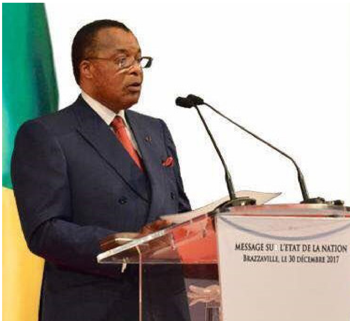
Le président Denis Sassou N'Guesso lors de son message sur l'état de la nation devant le parlement réuni en congrès

Le Pool, la crise économique et son volet social, la gouvernance publique, les négociations avec le Fonds monétaire international, le procès des détenus pour « trouble à l'ordre public » ou « atteinte à la sûreté intérieure de l'Etat », l'avenir des jeunes, la lutte contre l'impunité, la coopération bilatérale et multilatérale ont constitué les points de mire du message du président Denis Sassou N'Guesso sur l'état de la nation, délivré le 30 décembre à Brazzaville, devant le parlement réuni en congrès.