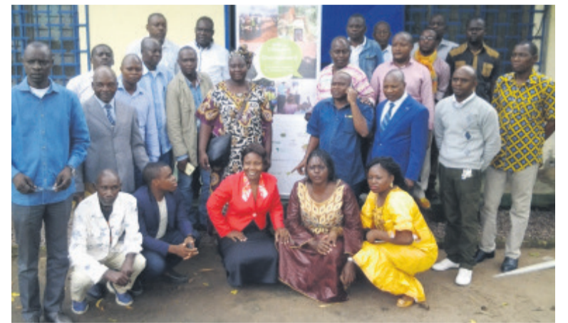
La photo de famille des participants à la réunion sur le CV4C

Le CV4C apporte notamment un appui logistique et technique dans la tenue des réunions, dans le développement des outils de vulgarisation de l'accord de partenariat volontaire et de la Redd+. Ce projet accompagne également les plateformes dans l'organisation des ateliers de renforcement de capacité puis des activités