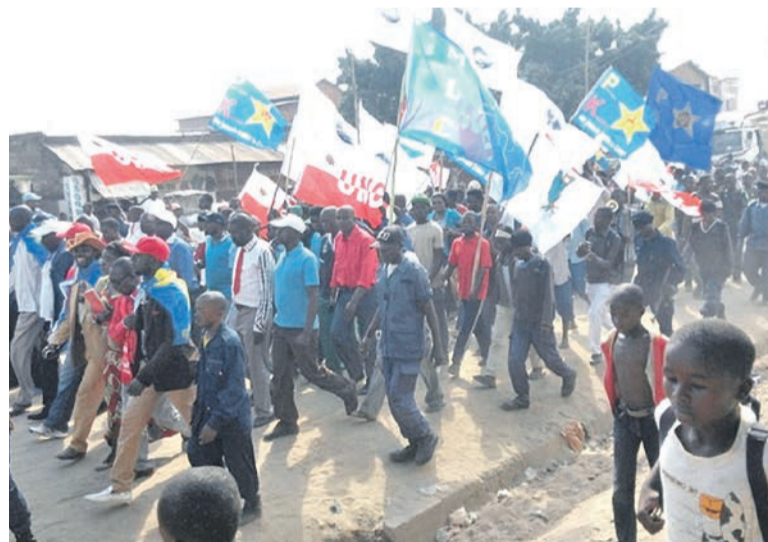
Une marche pacifique de l'opposition congolaise (tiers)

Cet institut rappelle, par ailleurs, qu'une marche pacifique est un droit fondamental garanti par des instruments juridiques internationaux dûment ratifiés et dans la Constitution de la RDC. Par conséquent, a-t-il affirmé, prendre ses distances face à l'appel des victimes de la même situation que leurs fidèles, non