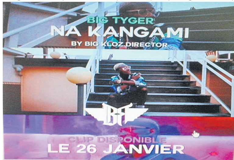
L'affiche du clip « Na Kangami »