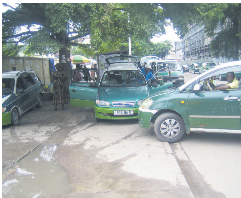
Arrêt de bus de la gare centrale à Brazzaville