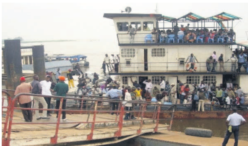
Un bateau au quai du port autonome de Brazzaville

de l'aviation civile et de la marine marchande, Fidèle Dimou, afin de trouver une solution à cette situation qui prévaut au niveau de l'établissement. Le Port autonome de Braz-