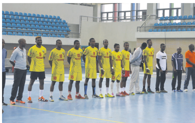
Les Diables rouges

Le Congo s'est incliné (22 à 27) face au Gabon, en match d'ouverture de la 23 e édition du Championnat d'Afrique des na-