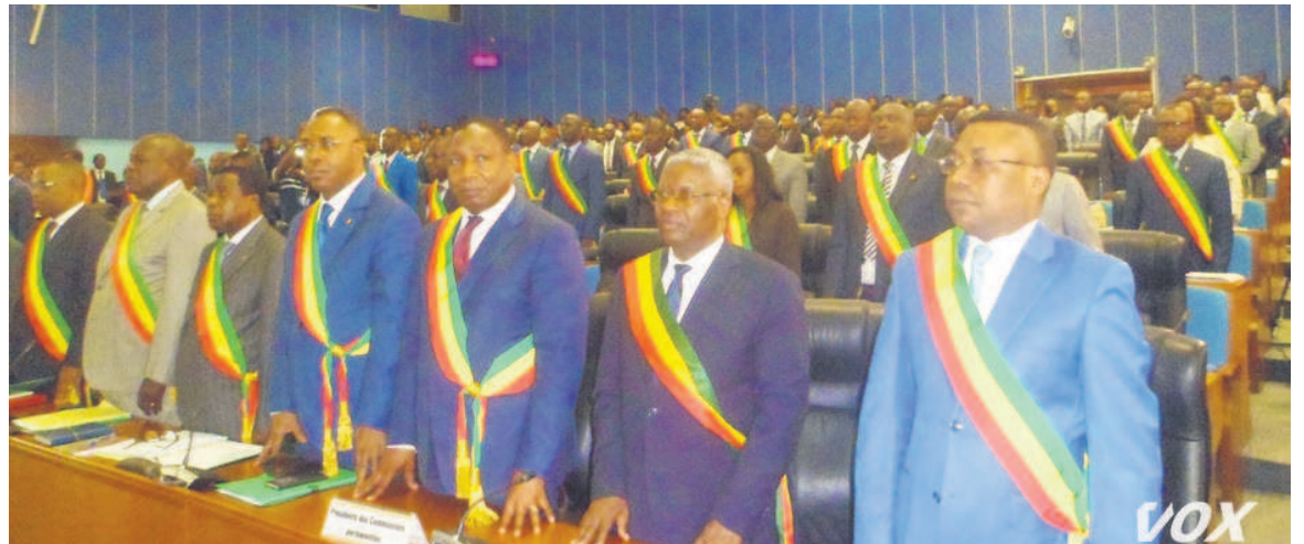
Une vue des députés lors du vote du budget

Le budget de l'Etat exercice 2018 a été adopté le 17 janvier, à l'unanimité, par les députés. Il est arrêté en ressources à 1 602 milliards 619 millions de francs CFA, en légère hausse par rapport à celui de l'année 2017 établi à plus de 1 500 milliards francs CFA.