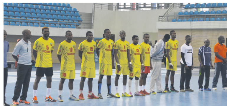
Les Diables rouges n'ont pas droit à l'erreur aujourd'hui face à l'Algérie

Le Congo s'est incliné 22 à 27 face au Gabon, en match d'ouverture de la 23 e édition du Championnat d'Afrique des nations (CAN) version masculine. Une défaite qui met les Diables rouges en situa-