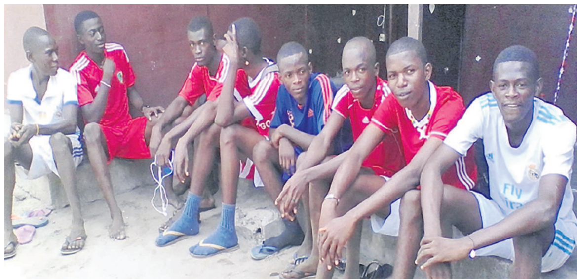
Des jeunes suivant le match des Diables rouges contre le Cameroun

Après la victoire du onze national, le 16 janvier au Maroc face aux Lions indomptables du Cameroun, 1 à 0, en match de clôture de la première journée du championnat d'Afrique des nations (Chan) réservé aux joueurs locaux, les jeunes de Pointe-Noire l'ont félicité l'encourage d'aller de l'avant.