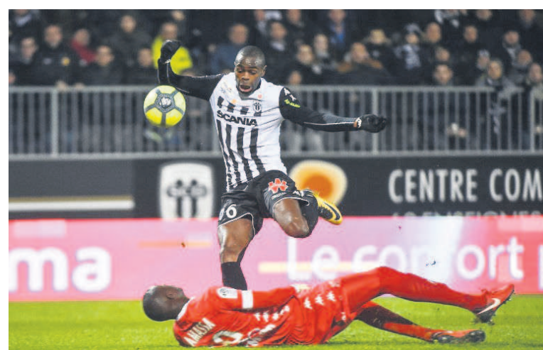
Prince Oniangué a livré une bonne prestation avant de céder sa place à l'heure de jeu

placé à la 45 e après une mi-temps raté : dix ballons, deux gagnés, sept perdus.