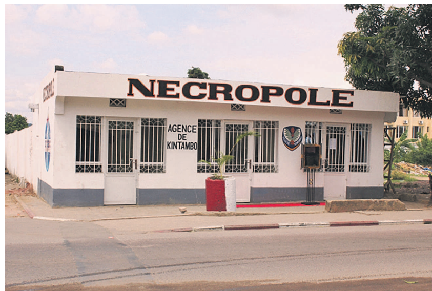
Bâtiment administratif de l'ETEC Nécropole à Kintambo

funéraire est assortie des exigences d'ordre social et non lucratif auxquelles les requérants promettent de se conformer. Mais une fois leur requête approuvée, les ONG se livrent alors, de manière effrénée, à un commerce illicite qui laisse transparaître leur