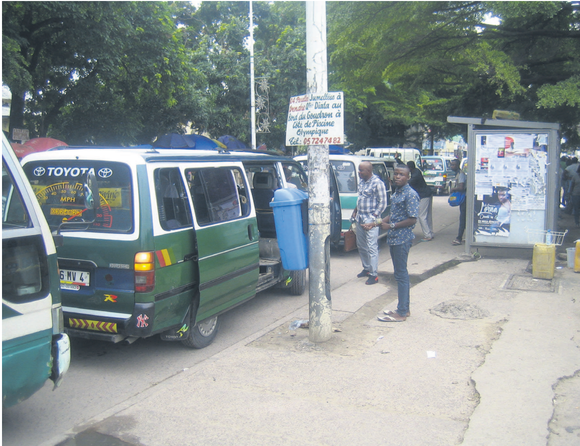
Arrêt de bus de la gare centrale à Brazzaville

La collecte des recettes des parkings de la place de Brazzaville est désormais assurée par des agents dûment désignés, sur autorisation de la mairie centrale.