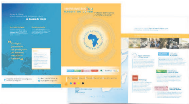
Chemises à rabat