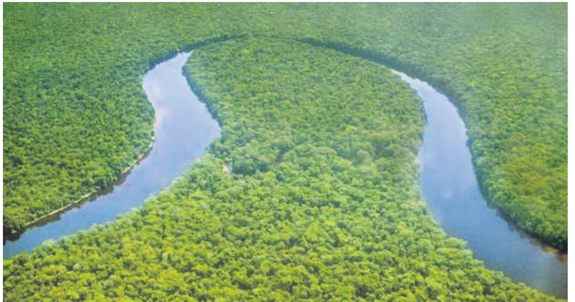
Étendue d'un bassin

L'utilisation durable des biodiversités terrestres, marines et côtières, ainsi que la préservation des ressources en eau et la promotion de l'économie bleue, recommandent des actions concertées des pays riverains. S'ajoute à cela l'épineuse question de la mobilisation des ressources financières nécessaires à soutenir les projets d'intérêt commun. Rappelons que le Fonds bleu