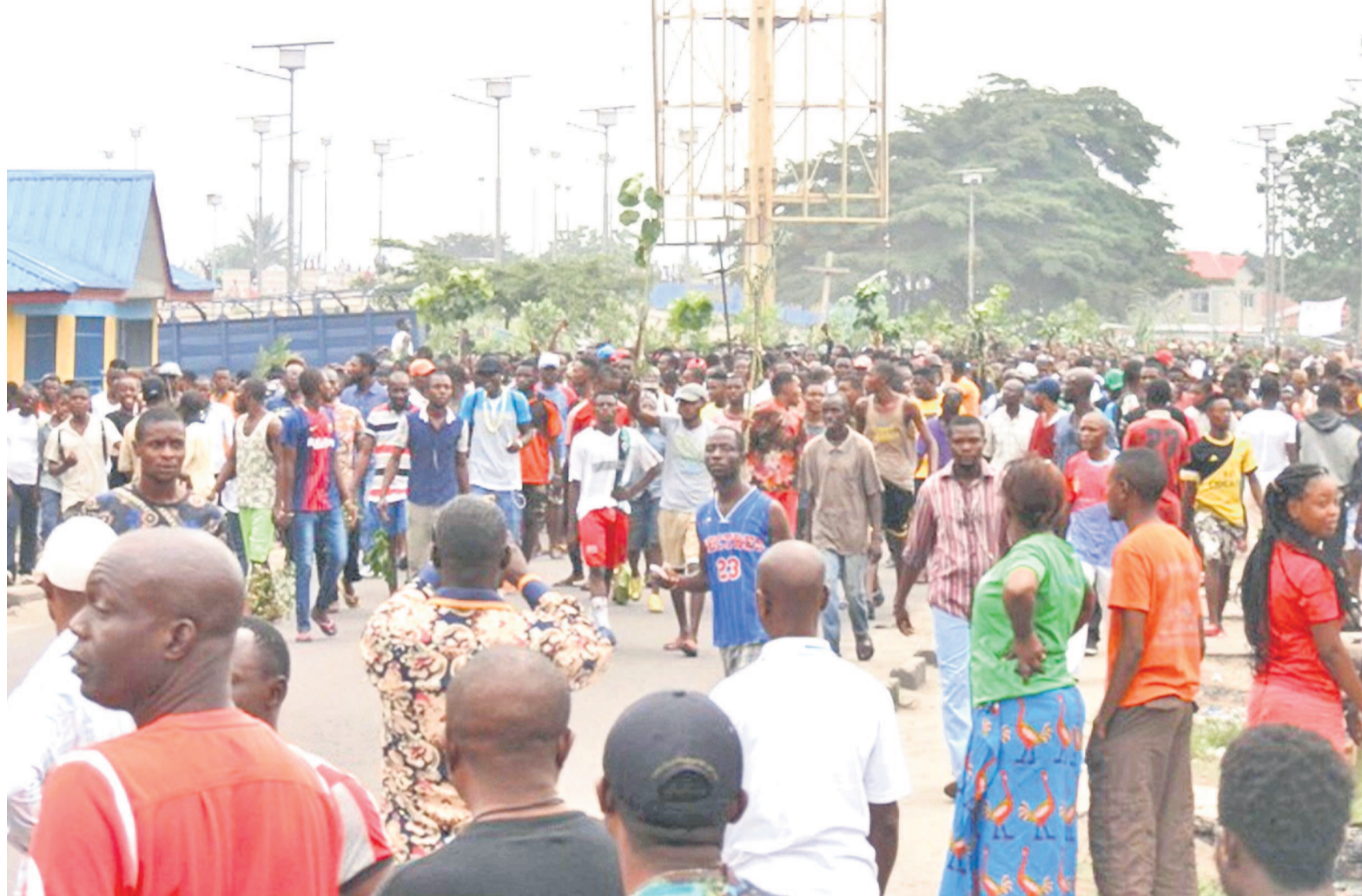
Des manifestants

Lors d'une conférence de presse organisée en marge de cette manifestation, l'Acaj a annoncé que les organisations des droits de l'homme et les familles des victimes seraient en train de constituer un dossier d'informations à déposer à la Cour pénale internationale (CPI). « Nous condamnons fermement la répression