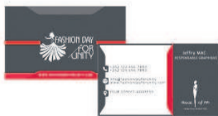
Cartes de visite