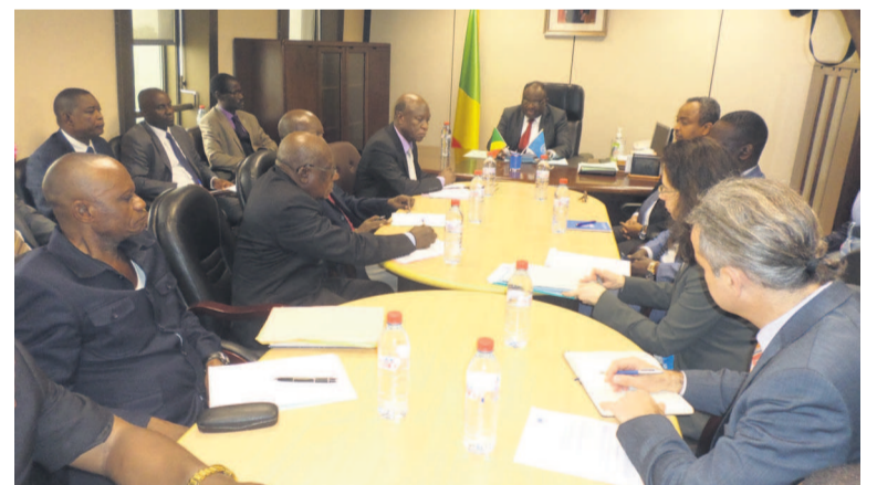
Les deux parties pendant la séance de travail

L'arrivée des trois fonctionnaires onusiens a été annoncée par le représentant spécial du secrétaire général des Nations unies pour l'Afrique centrale, François Lounceny Fall, qui a séjourné à Brazzaville, du 12 au 14 janvier.