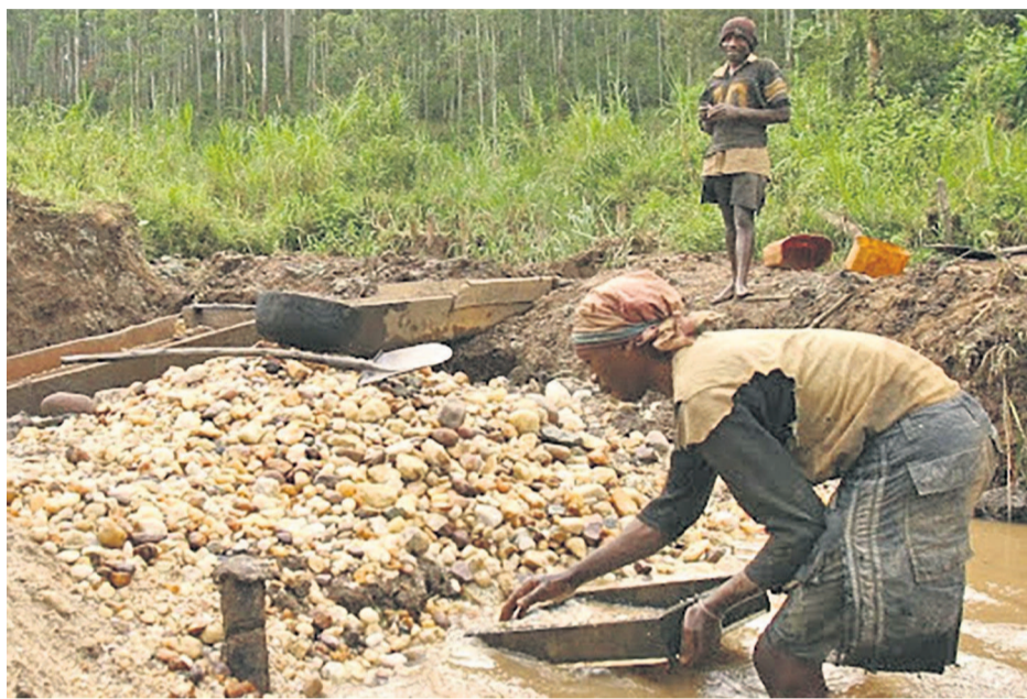
Creuseurs artisanaux de l'or

La mine devrait atteindre une production supérieure à sept cent mille onces d'or au cours de l'année 2018.