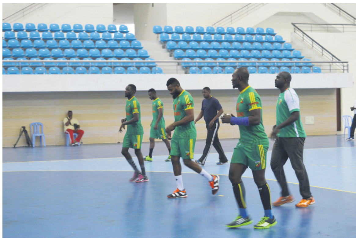
Les Diablies rouges à l'entraînement

La victoire du Congo sur le Cameroun a été salubre. C'est d'elle qu'est venue sa qualification en quarts de finale. Avec deux points, les Congolais se sont placés à la troisième place du groupe A, derrière la Tunisie, l'Algérie et le Gabon. Le match nul entre le Cameroun et le Gabon, lors de la dernière journée de la phase de poules, a conforté la qualification du Congo. Les trois autres quarts de finale se joueront également ce 24 janvier. La Tunisie, pays le plus titré du continent avec neuf trophées à son palmarès, rencontrera la République démocratique du Congo qui, en 1992 et 2010, avait occupé la 4 e place. Après ce match, le tour reviendra à l'Angola d'affronter l'Algérie. Les Algériens sont deuxièmes au classement continental avec sept titres tandis que la meilleure performance des Angolais est la troisième place occupée en 2016 et en 2014. Dans les an-