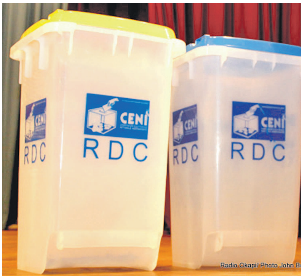
Les Congolais doivent se rendre aux urnes le 23 décembre 2018

En temps normal, la consolidation du fichier électoral devait être suivie de près par l'ensemble de la classe politique congolaise, parce qu'étant une étape déterminante dans la répartition des sièges. Cependant, elle se déroule dans l'indifférence la plus totale des acteurs politiques qui n'y trouvent aucun intérêt. Et pour cause, nombreux sont ceux qui ne croient