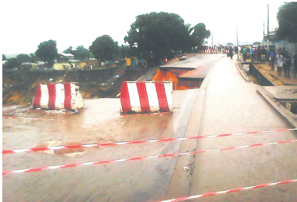
Une vue de la voie coupée par l'érosion (Adiac)

Signalons que même la passerelle qu'empruntaient les bus depuis que la principale a été bloquée n'est plus praticable à cause de la boue. Les habitants des quartiers Ngamakosso, Manianga,