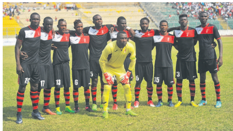
Club renaissance aiglons (Cara)

peuvent s'appuyer sur cette aventure pour surprendre les Togolais chez eux. A condition d'être concentrés.