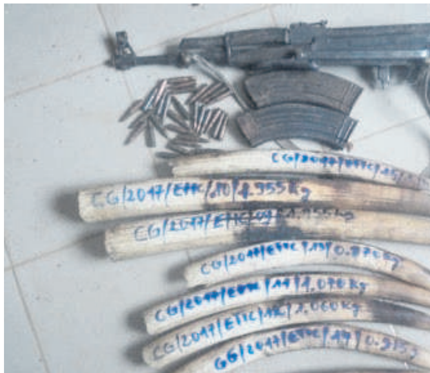
Les ivoires, munitions et l'arme des braconniers