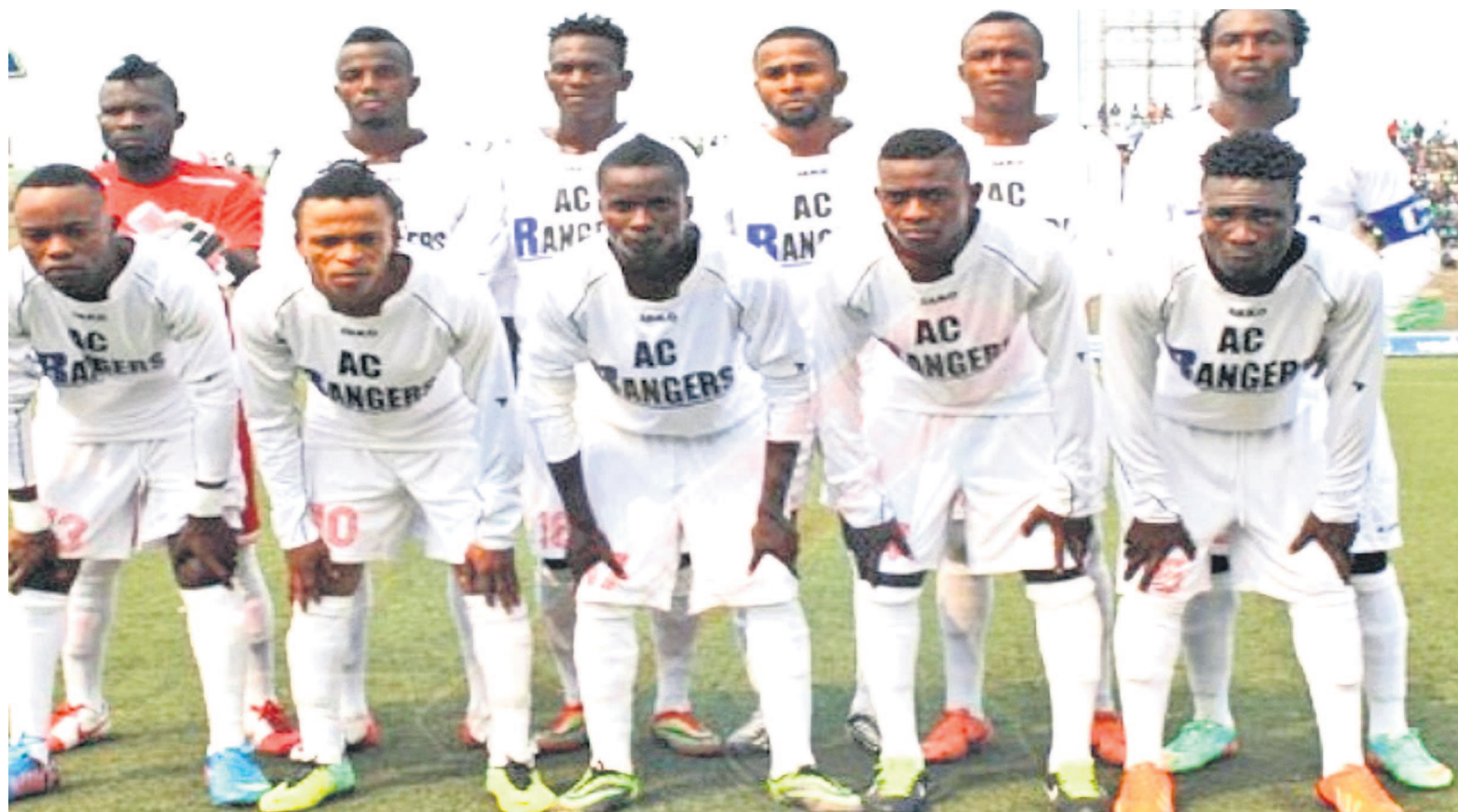
L'AC Rangers de Kinshasa va disputer pour la première fois le play-off