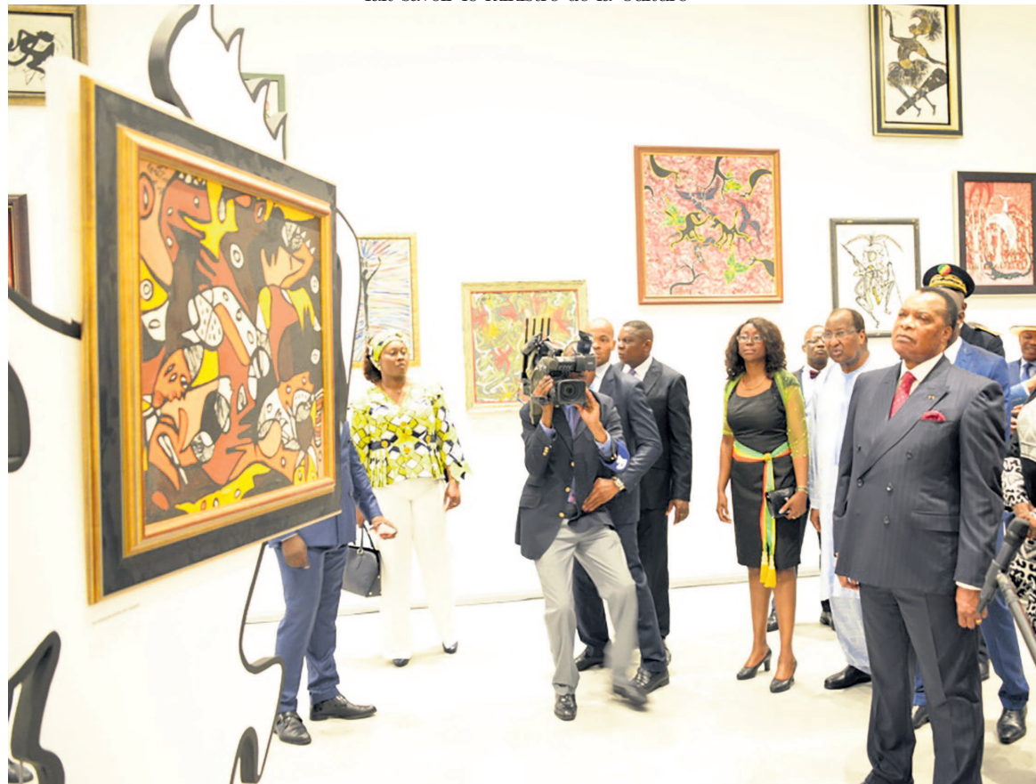
Le président de la République visitant l'exposition Marcel-Gotène