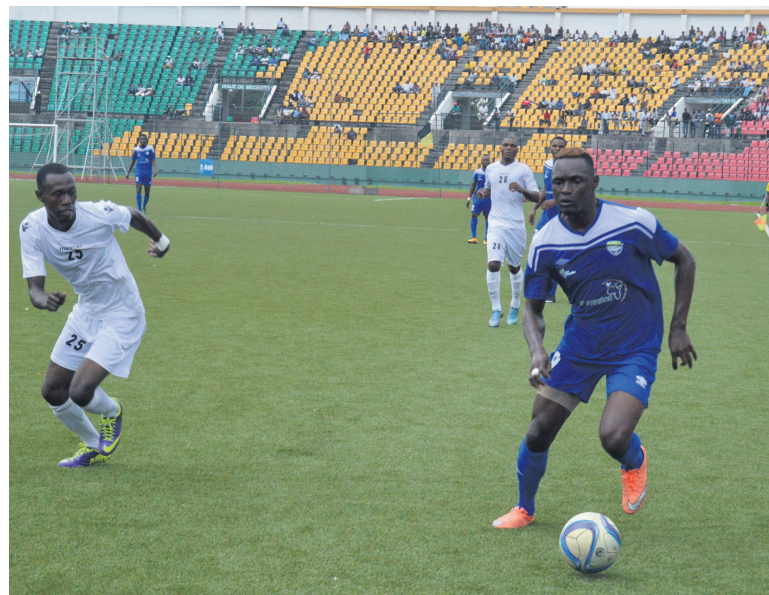
Une séquence du match (Adiac)

Suite au calendrier des compétitions interclubs de la Confédération africaine de football, les rencontres qui devraient se disputer les 21 et 22 février sont reprogrammées. Le mercredi, au stade Alphonse-Massamba-Débat, Cara rencontrera Asanti Kotoko de Kumasi, il n'y aura donc pas match du championnat. C'est plutôt le jeudi que Tongo FC recevra Patronage et la Jeunesse sportive de Talangai sera aux prises avec Etoile du Congo. Le 23 février, à Pointe-Noire, AS Cheminots sera face à la Jeunesse sportive de Poto-Poto, avant que V. Club et Diables noirs ne s'expliquent. Le 25 février, à Brazzaville, Saint-Michel de Ouenzé recevra La Mancha et Cara jouera contre Nico-Nicoyé. A Madingou, dans le département de la Bouenza, AC Léopards de Dolisie recevra Inter club, alors qu'à Owando (département de la Cuvette), AS Otohô sera face à FC Kondzo.