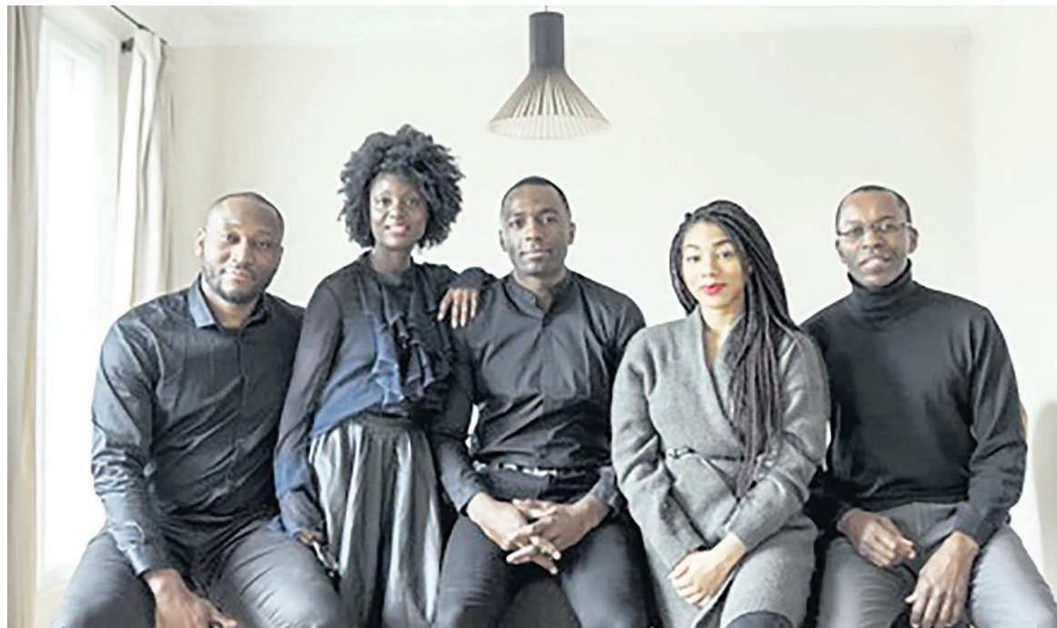
L'équipe Start IT Congo 2018

Près de trois cents entrepreneurs, cadres dirigeants ou influenceurs triés sur le volet se réuniront à Paris sur le thème « L'entrepreneuriat numérique et à impact social en République démocratique du Congo ».