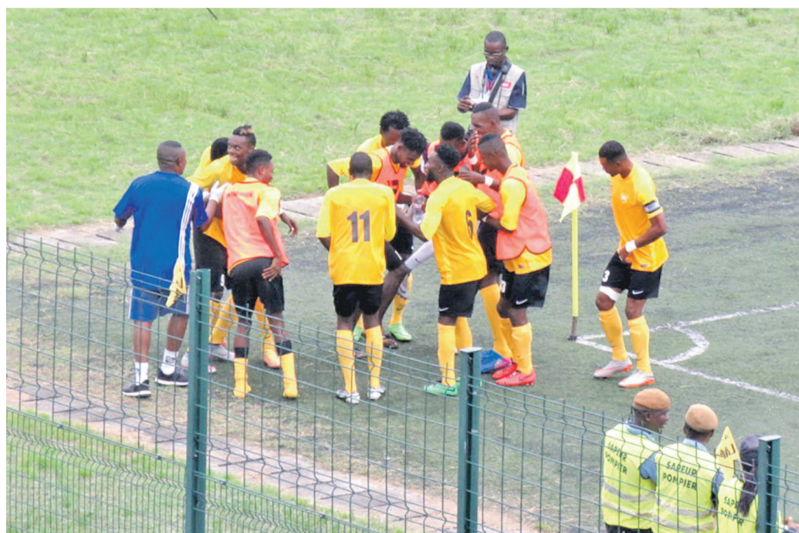
La Mancha célébrant le but

Le président de la Mancha, en larmes, a salué tout le groupe ainsi que le public qui s'est mobilisé pour son équipe. « Je suis très content et les mots me manquent. Les enfants ont respecté les consignes. Aujourd'hui,