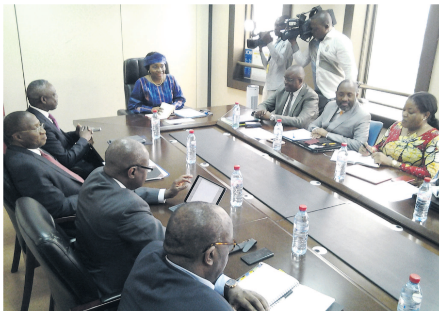
Les deux parties pendant les pourparlers.

Outre l'annonce relative au soutien qu'elle envisage d'apporter au Congo, la délégation de la BAD, conduite par