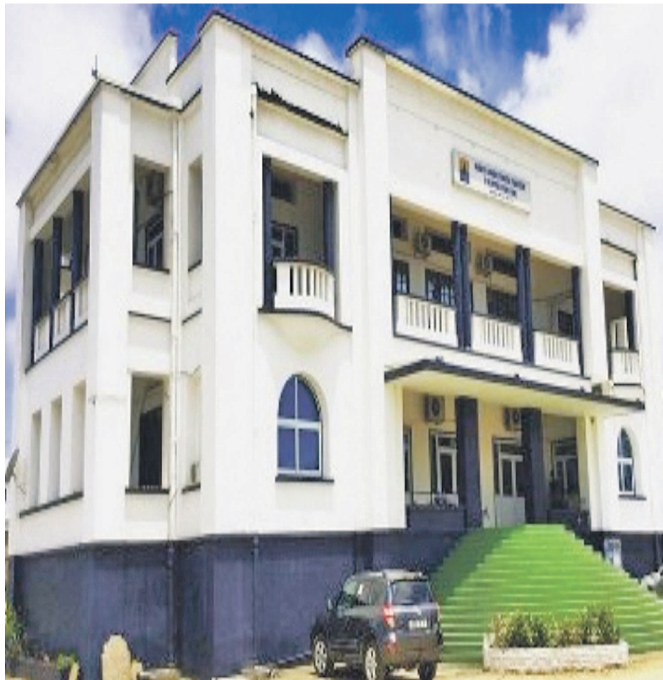
Une vue de la Chambre de commerce de Pointe-Noire

La mission entre dans le cadre du compagnonnage consulaire entre la CCIAM et la Chambre de commerce et d'industrie Nantes Saint Nazaire. Le salon de l'industrie et de la sous-traitance du Grand Ouest est un rendez-vous fixé par les entrepreneurs industriels à leurs marchés. L'événement qui se tient tous les deux ans est une plate-forme d'informations, d'échanges et de rencontres qui rassemble une offre complète de produits, d'équipements, services et solutions en matière de sous-traitance et production industrielle. Ce salon présente et valorise les techniques et technologies innovantes, créatrices de valeur et avenir du développement industriel. Il favorise l'amélioration de la performance collective des entreprises et l'optimisation des processus de production. L'événement donne la possibilité des rencontres «be to be». Cette année, il accueillera une