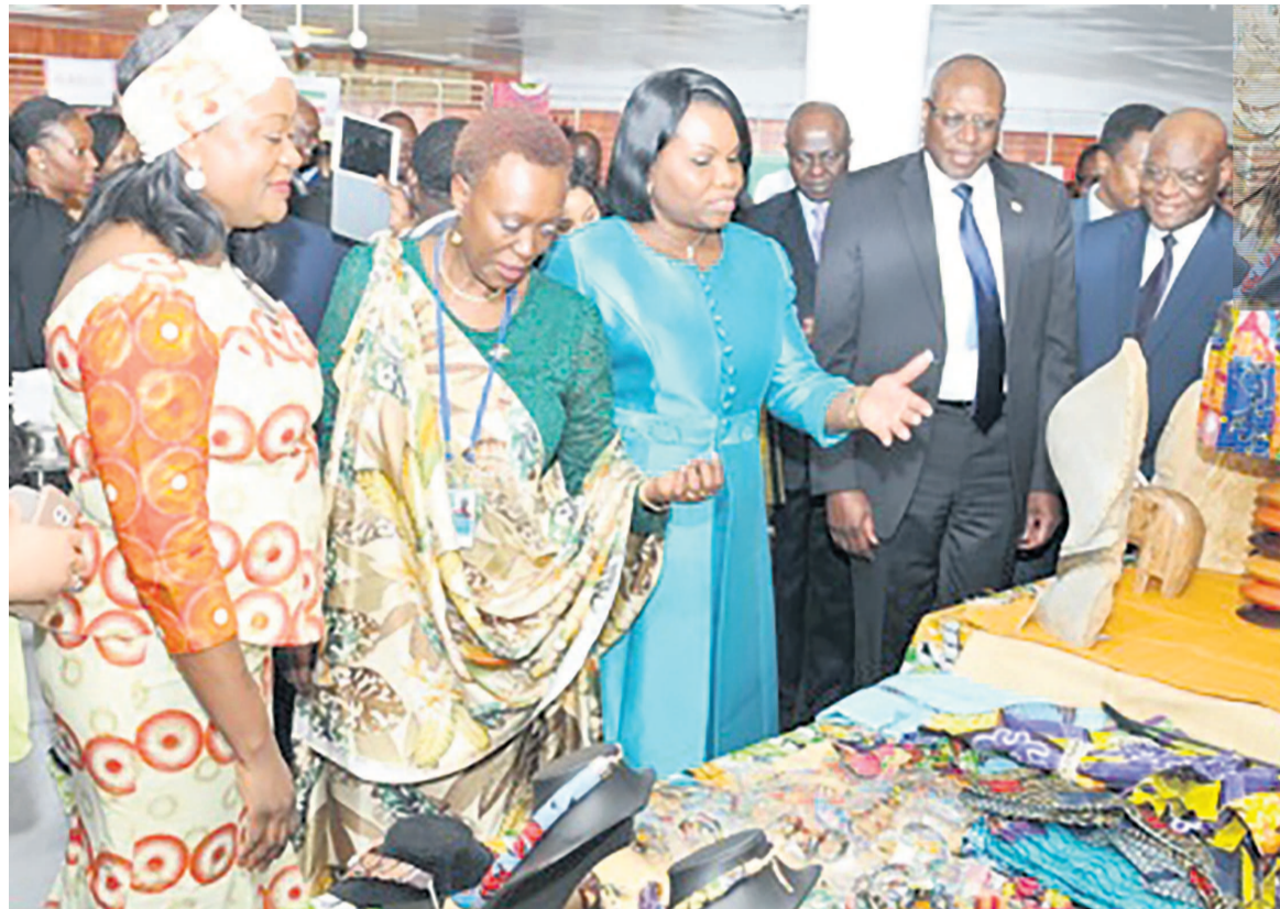
Vernissage autour des expositions et visite des stands lors de la Journée de l'Afrique centrale 2018 à la Maison de l'Unesco.

jourd'hui, c'est, entre autres, l'art culinaire constitué de plats à base de banane et de manioc, préparés différemment selon les pays. « Ce sont des ressemblances culturelles bien qu'avec de minimes différences. Cela nous permet de vivre dans la diversité et, en conséquence, de constituer une source d'enrichissement mutuel. », a-t-elle ajouté.