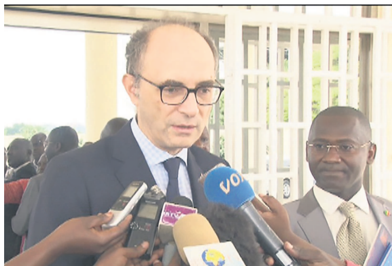
L'ambassadeur faisant le point à la presse

Un accord de coopération, dans le domaine du sport et particulièrement le football, sera signé entre les deux pays dans les prochains mois, a indiqué l'ambassadeur de la Turquie au Congo, Can Incesu, au sortir de l'audience avec le ministre des Sports et de l'éducation physique, Hugues Ngouélondélé, le 20 février à Brazzaville.