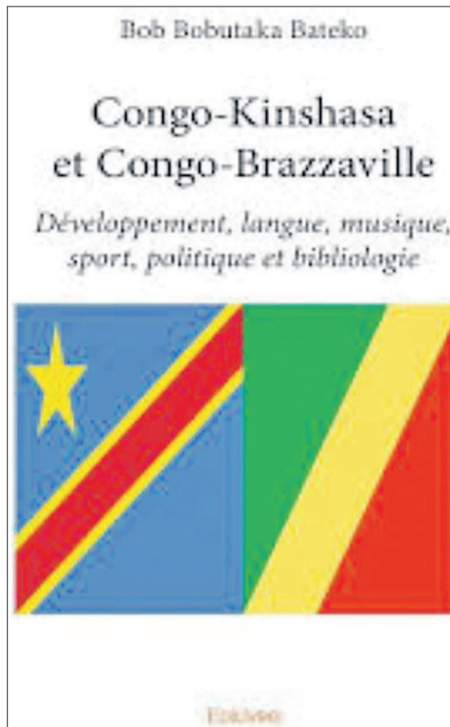
La couverture de l'ouvrage du Pr Bob Bobutaka sur les deux Congo

A l'endos du livre, il y est brossé l'économie de l'ouvrage. « En dépit du fait que