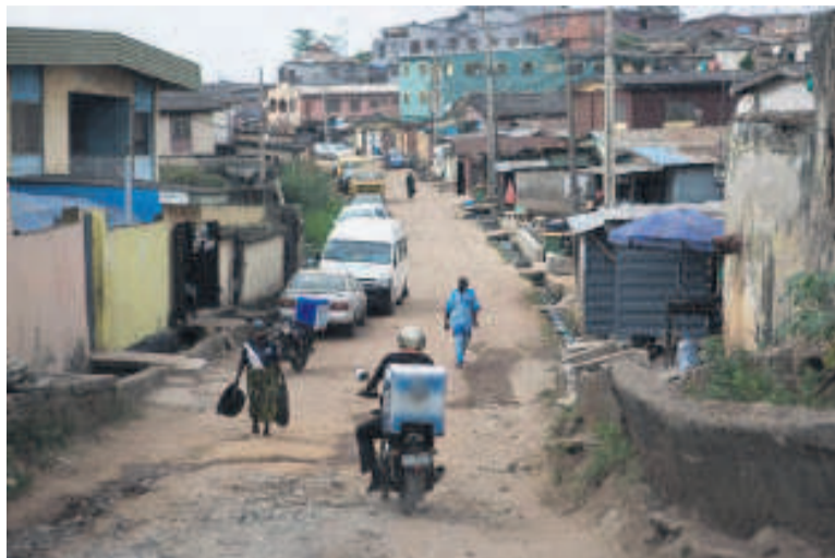
Livraison à domicile, à moto dans un quartier de Brazzaville