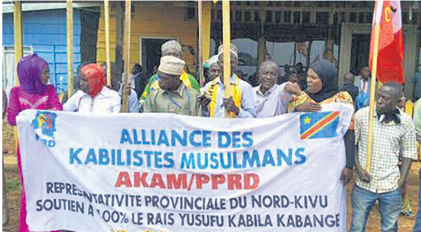
Les membres de l'Akam/PPRD

Les catholiques demandent au président Kabila, dont le deuxième et dernier mandat s'est achevé en décembre 2016, de déclarer publiquement qu'il ne se représentera pas à la présidentielle prévue pour le 23 décembre 2018. Les membres