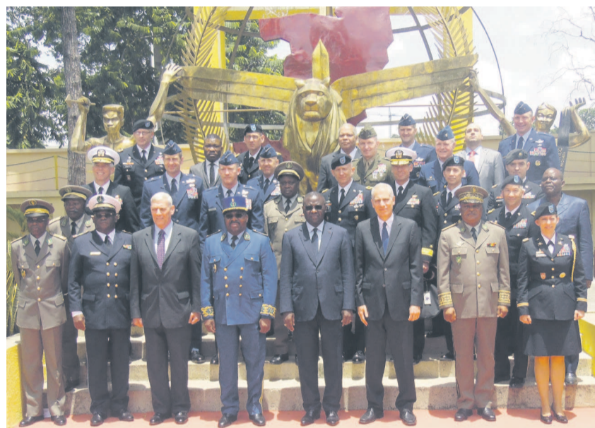
Les officiels congolais en compagnie de la délégation américaine