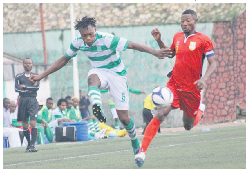
Vue du match entre DCMP et Dragons/Bilima le 21 février

Depuis le début de la phase de poules, le DCMP broie tout sur son chemin. Alors que le club consolide son leadership après sa victoire sur Dragons/Bilima tout en étant à quelques jours de son entrée en lice en Coupe de la Confédération, des troubles aux contours assez flous pourraient déstabiliser les Immaculés.