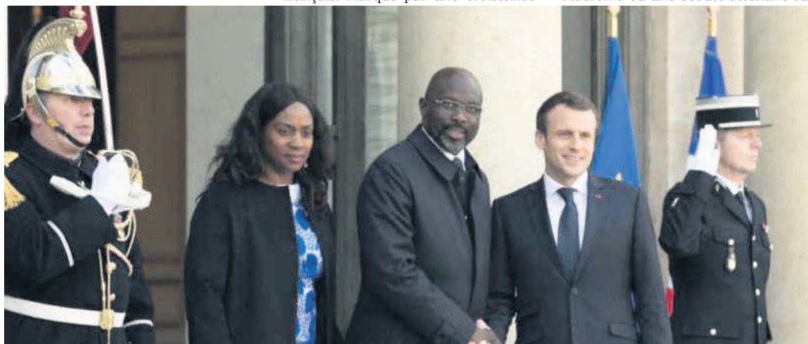
Emmanuel Macron et George Weah

Les deux chefs d'État ont évoqué la question de la croissance économique, de l'emploi des jeunes libériens, la place du sport comme facteur de développement et des questions d'intérêt commun, notamment un partenariat pour «une nouvelle génération de chefs d'État avec qui,