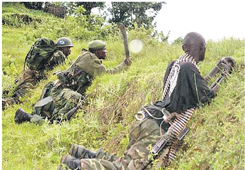
Des miliciens Nyatura attaquent des positions FARDC

L'ONG appelle le gouvernement de la RDC à tout mettre en œuvre pour éradiquer toutes les poches d'insécurité, sources des tragédies ignobles infligées aux communautés locales, traduire en justice et sanctionner sévèrement tous les coupables et restaurer l'autorité de l'État sur toute l'étendue du pays.