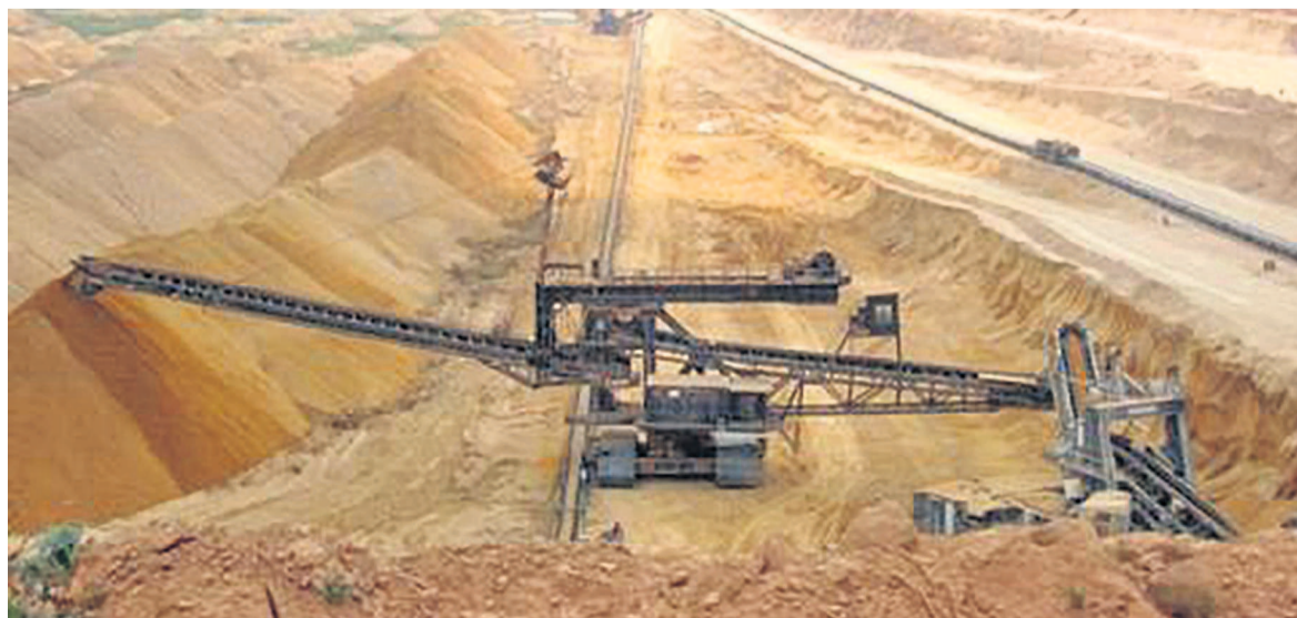
Un site d'exploitation de la société Invanhoe Mines