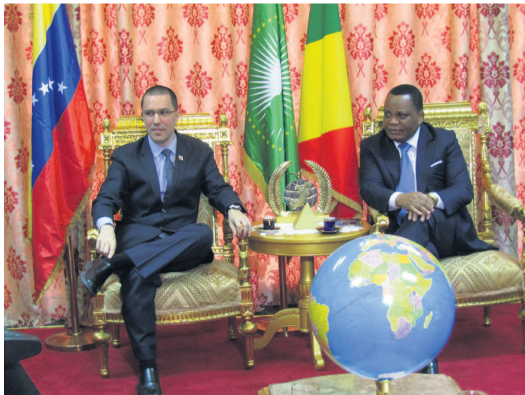
Le ministre Jean-Claude Gakosso s'entretenant avec son homologue vénézuélien.