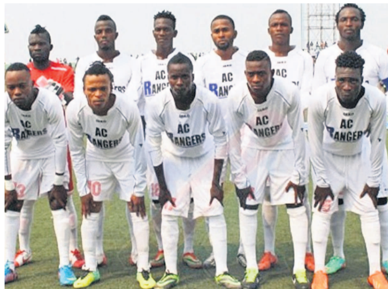
AC Rangers de Kinshasa

Dans le cadre de la 16 e journée de la zone de développement ouest du 23 e championnat national de football organisé par la Ligue nationale de football (Linafoot), l'AC Rangers de Kinshasa a balayé, le 20 février, au stade Tata Raphaël de Kinshasa le TP Molunge de Mbandaka par la marque de quatre buts à zéro.