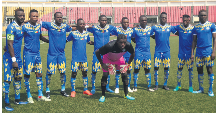
L'AS Otohô n'a pas été à la hauteur à Alger

sième but à la 33 e minute. 3-0, tel est le score à la pause. La reprise sera plus catastrophique. Quinze secondes seulement après la relance, Amada corse d'addition avant le festival de Nekkache, lequel a signé le 5 e et le 6 e but en l'espace de 5 mn (61 e et 66 e minute). Les joueurs de Mouloudia déjà assurés de leur qualification vont une fois de plus appuyer là où ça faisait mal. Ils profitent du manque de réaction de l'adversaire pour le punir sévèrement. Tour à tour,