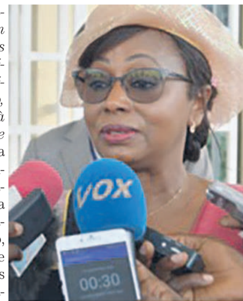
La représentante de l'OMS au sortir de l'audience