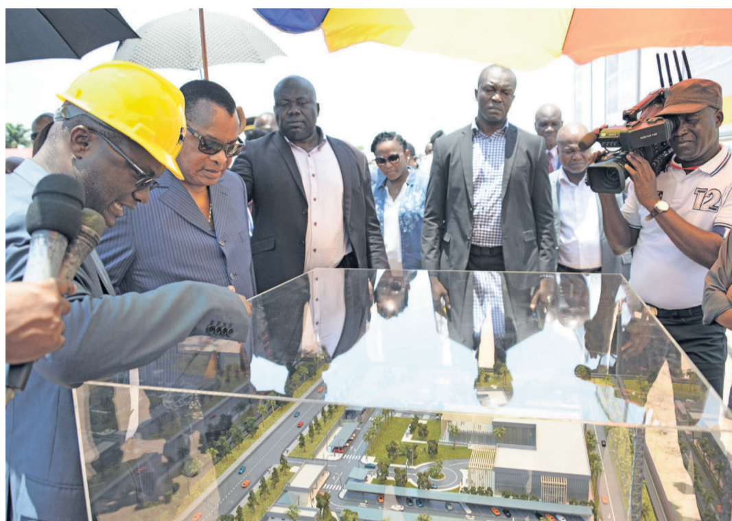
Denis Sassou N'Guesso devant la maquette du centre d'excellence