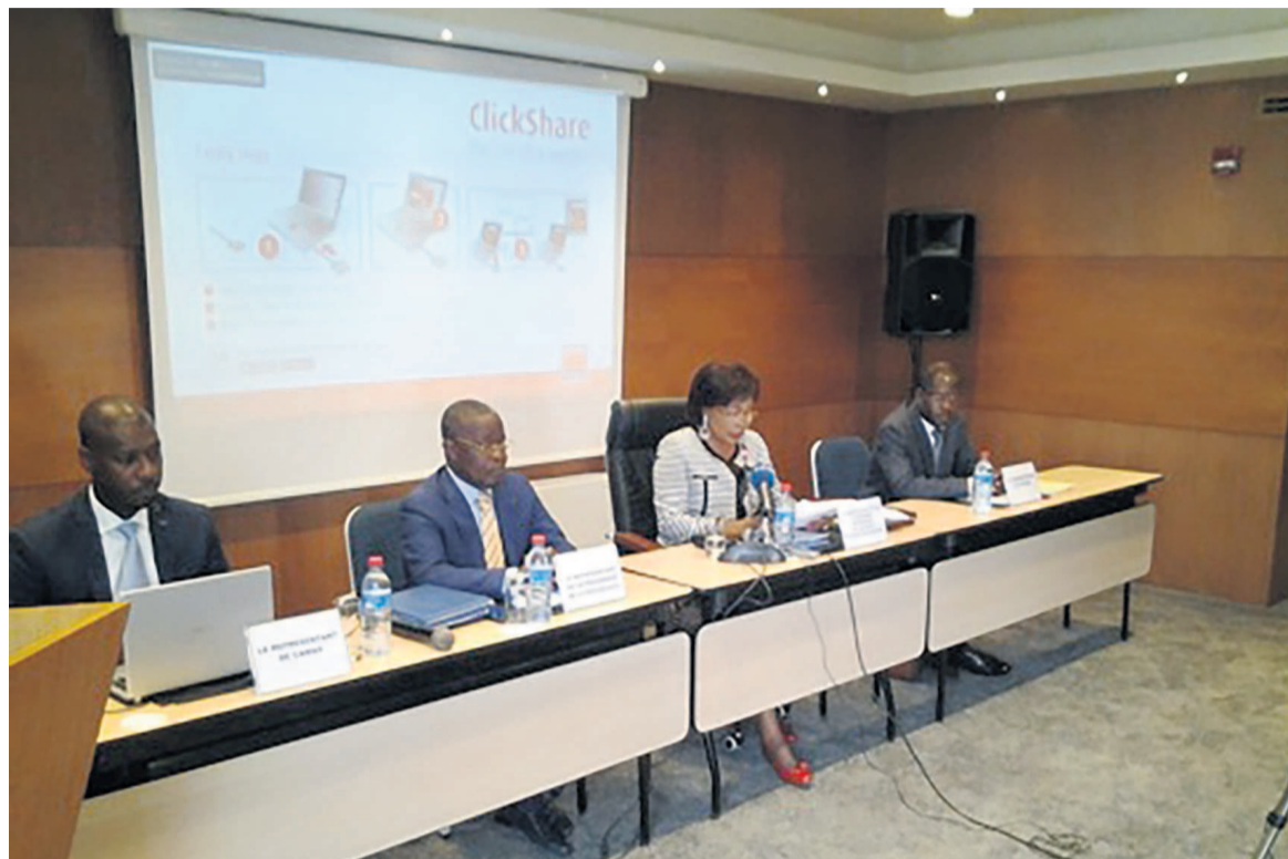
Le présidium lors du comité de pilotage

L'Agence congolaise pour la création d'entreprise (ACCE) va être dotée d'un logiciel qui permettra aux usagers de disposer, en un lieu unique et en temps record, de l'acte de naissance créant leur société.