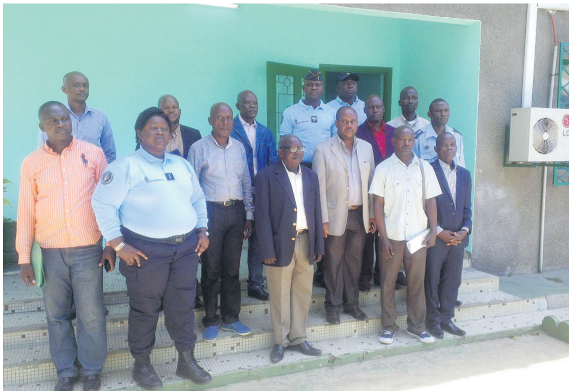
Les participants à l'atelier

La formation a mobilisé une vingtaine de participants des directions départementales des Droits humains et des libertés fondamentales, de l'administration pénitentiaire, de la Maison d'arrêt zone sud, de la police, du commandement de la Région de gendarmerie de Pointe-Noire/Kouilou, des représentants des ONG et associations de défense des droits et des libertés fondamentales de l'homme. Elle entre dans le cadre du projet Mandat, qui