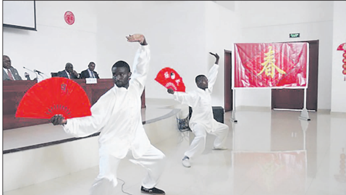
Des Congolais pratiquant les arts martiaux chinois

Sur le plan éducatif, Confucius a mis l'accent sur l'association de l'apprentissage et de la réflexion. A cet effet, il a proposé des points de vue comme « On sera perplexé si l'on ne réflé-