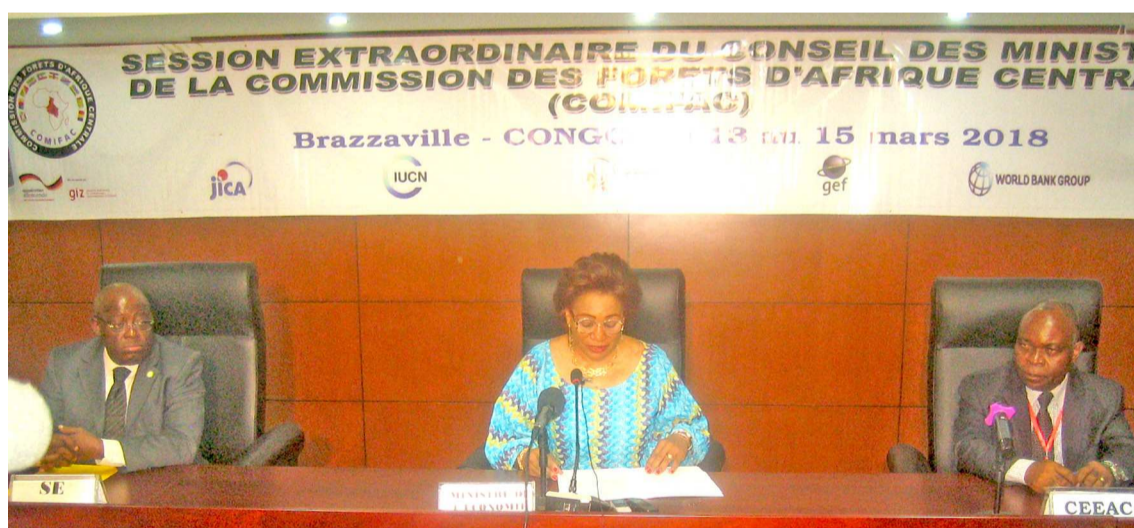
Le présidium des travaux