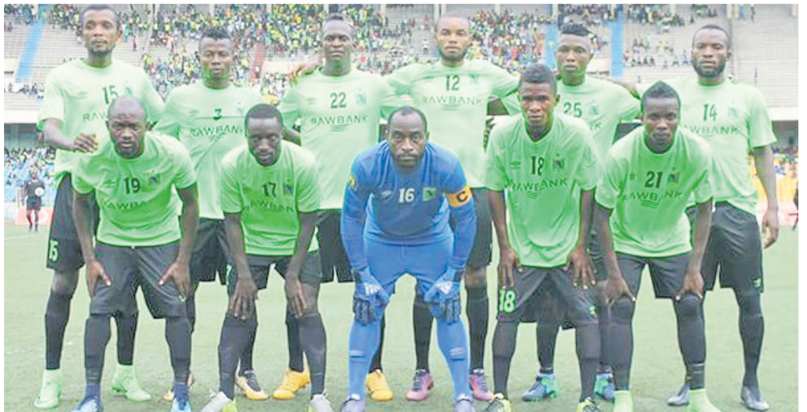
V.Club jouera contre La Mancha du Congo Brazzaville au tour de cadrage de la C2