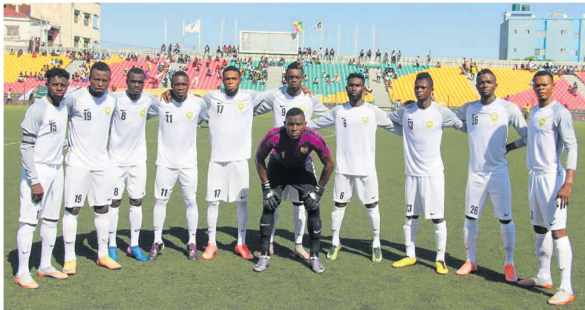
La Mancha

La Mancha de Pointe-Noire croisera l'AS Vita club de Kinshasa alors que le Club athlétique renaissance aiglons (Cara), de Brazzaville, en découvrira avec Saint-George d'Ethiopie. Les matches aller vont se disputer les 6 et 8 avril. C'est pour la première fois que les clubs des deux rives du fleuve Congo se retrouvent à cette étape de la compétition. La Mancha a le privilège de débiter cette manche décisive à Kinshasa, avant de recevoir l'AS Vita club le 17 avril, à Pointe-Noire. Pour les deux équipes, l'enjeu est la qualification pour la phase de poules. Sur le papier, le club de Kinshasa, vainqueur de la Ligue des champions en 1973 puis finaliste à deux reprises (1981 et 2014), est favori. Le club ponténégrin peut toutefois s'appuyer sur un détail non négligeable pour lui voler la vedette. L'AS Vita club n'a jamais brillé en C2. Elle a été éliminée à cette même étape