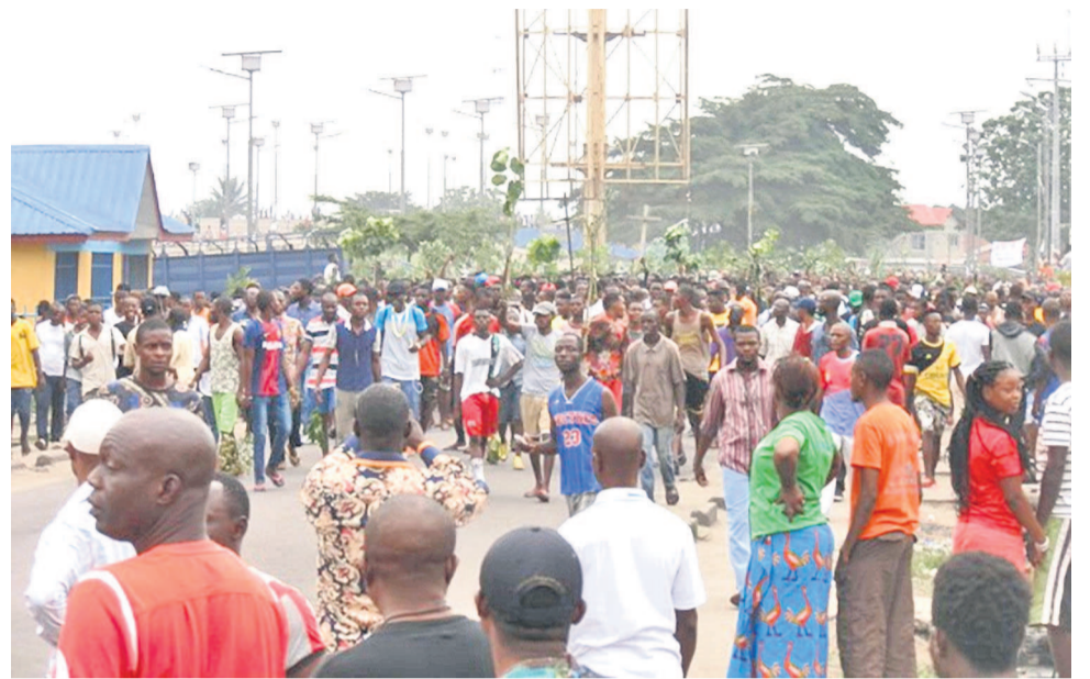
Les participants à la marche du 21 janvier 2018

Le gouvernement, rappelle cette ONG, avait ordonné la suspension ou la limitation de l'accès à l'internet et aux services d'envoi de messages, invoquant « des raisons de sécurité d'Etat » non motivées. Pour l'IRDH, cette instruction ne se justifiait nullement, car la RDC est astreinte à agir conformément à ses obligations découlant