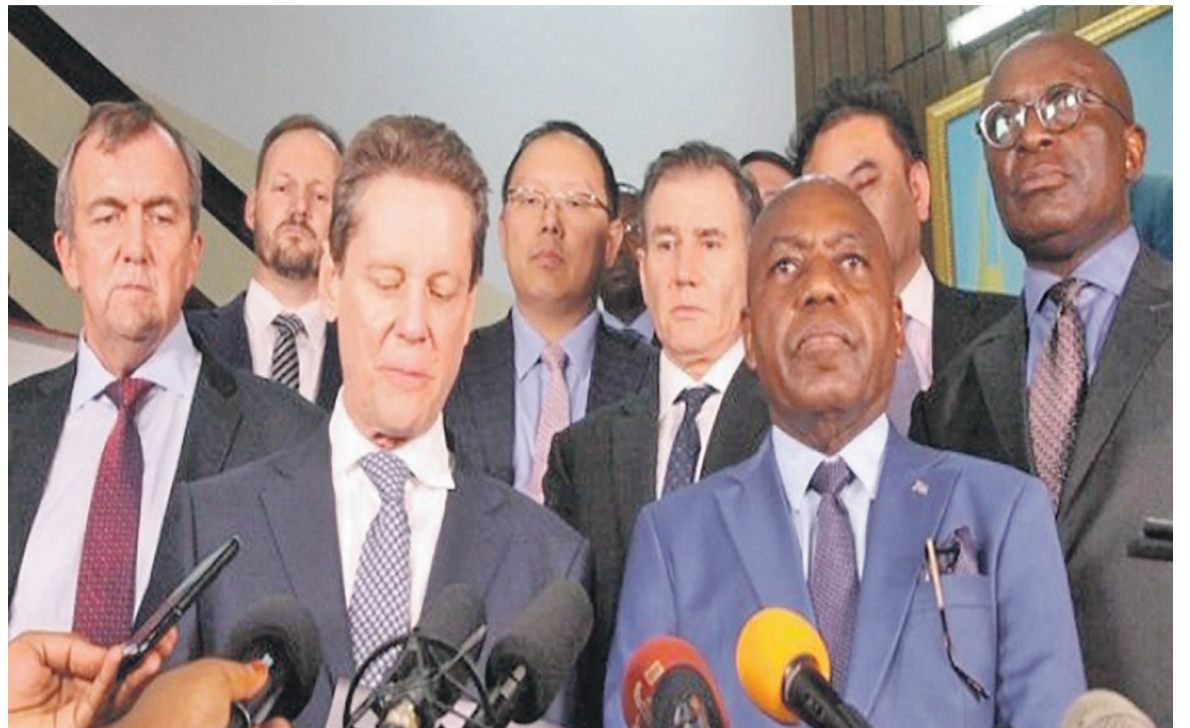
Le ministre des Mines, Martin Kabwelulu, et les patrons d'entreprises minières opérant en RDC, à l'issue de l'audience avec le président de la République, Joseph Kabila

L'ouverture de ces négociations va intervenir au moment où sept entreprises internationales du secteur minier (Rangold, Glencore et China Molybdenum) ont décidé, le 15 mars, de quitter la Fédération des entreprises du Congo (FEC), estimant que cette structure ne défend pas suffisamment leurs intérêts. Ces sept entreprises, qui produisent 85 % du cuivre, du cobalt et de l'or de la RDC, avaient, dans un courrier adressé à Joseph Kabila, le 8 février dernier, accusé la FEC de n'avoir pas suffisamment joué son rôle de promotion de leurs intérêts durant la période de révi-