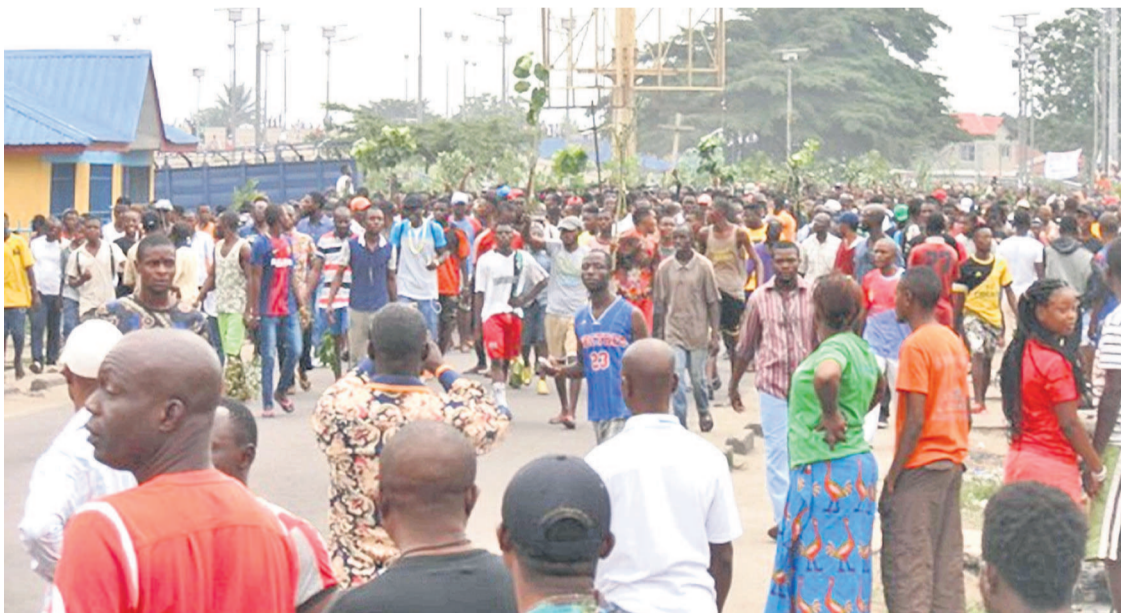
Les participants à la marche du 21 janvier 2018 gestion des manifestations publiques en RDC de janvier 2017 à janvier 2018 ».

L'Institut de recherche en droits humains a sollicité du Haut-commissaire aux droits de l'homme et de la cheffe de la Monusco d'inclure la condamnation de la violation du droit d'accès à l'internet et la responsabilité des multinationales de télécommunications dans le rapport intitulé « Recours illégal, injustifié et disproportionné à la force lors de la