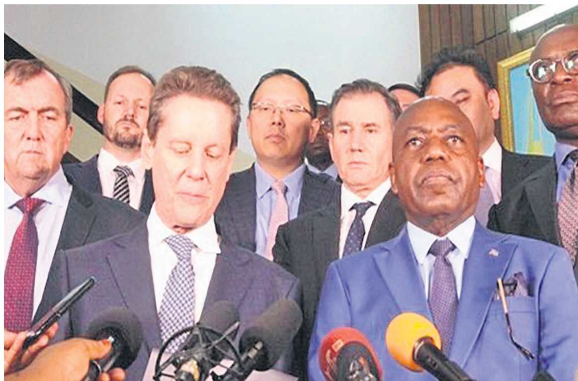
Le ministre des Mines Martin Kabwelulu et les opérateurs miniers après l'audience avec le chef de l'Etat, Joseph Kabila

Les négociations détaillées sur le code minier devraient débuter le 26 mars après une réunion initiale de haut niveau tenue à Kinshasa, le 7 mars, au cours de laquelle il a été dit que les préoccupations des entreprises minières seraient résolues par des dispositions transitoires. C'est ce que révèle l'entreprise Ivanhoe Mines Ltd dans son récent communiqué sur l'état de discussions entre le gouvernement et les sociétés minières opérant en RDC.