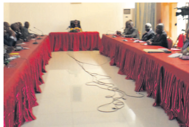
Le bureau du Sénat s'entretenant avec le collectif des sinistrés

Le collectif a souhaité que cette question soit totalement prise en compte dans la loi de Finances 2018 et qu'en même temps, la commission en