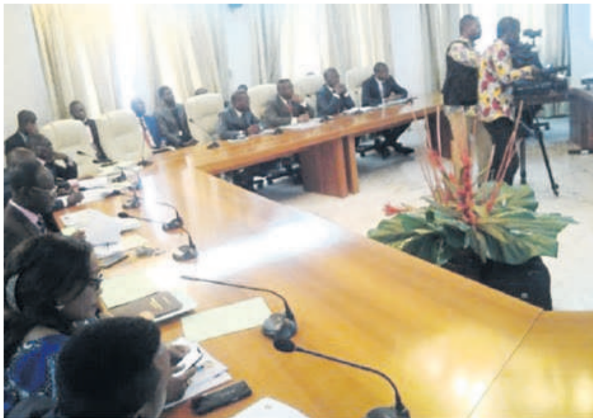
Une vue des participants au lancement des applications (Adiac)

« Le système de suivi des paiements des créances de l'Etat par les groupes contracteurs est la première d'une série de lancements. Il est la première application du ministère à