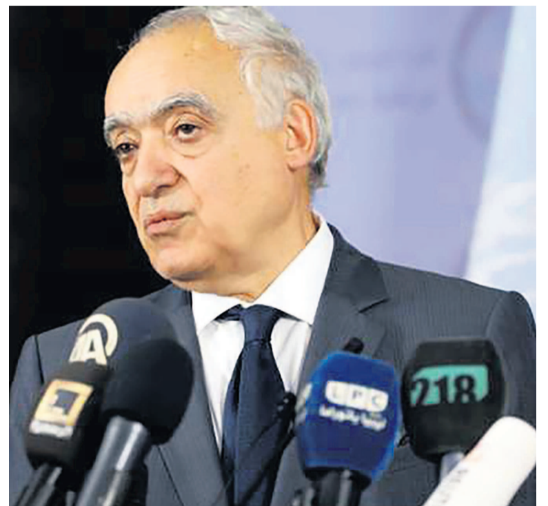
Ghassan Salamé

Au niveau de l'ONU, des efforts ont déjà été consentis pour tenter de résoudre la crise libyenne. A ce sujet, un plan pour ramener la stabilité a été élaboré. Il y est prévu, entre autres, des élections cette année pour tourner la page d'une transition chaotique, sept ans après le déclenchement de la révolte qui avait renversé le régime autoritaire de Mouammar Kadhafi. Mais le gouvernement d'union nationale, basé à Tripoli, et les