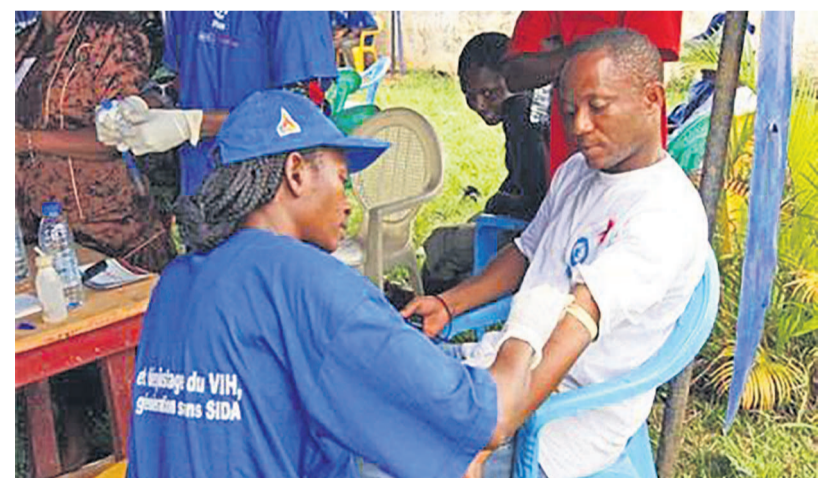
Des malades atteints par le VIH-Sida

L'engagement du gouvernement a été pris récemment par le ministre des Finances lors du lancement de la subvention 2018-2020 du Fonds mondial de lutte contre le sida, la tuberculose et le paludisme à Kinshasa. Henry Yav a confirmé la détermination de la RDC d'allouer au moins 20% du montant de ces fonds aux programmes des