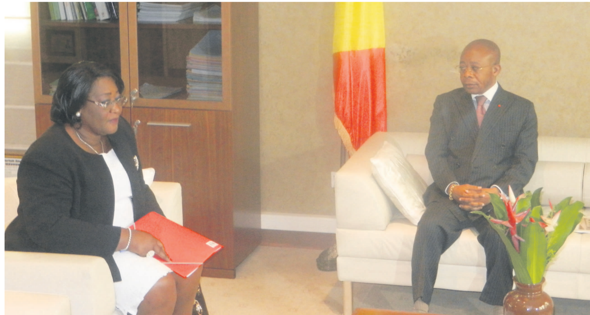
Le ministre Coussoud Mavoungou lors de l'audience avec l'ambassadeur de Côte d'Ivoire, Thérèse N'Dri Yoman (Adiac)

« Cette amélioration de la production, fondée sur la recherche scientifique, a permis de mettre en place des variétés qui résistent aux climats difficiles, aux parasites et aux insectes. Cela a permis à la Côte d'Ivoire d'avoir les cacaoyers de bonne qualité avec une production importante »