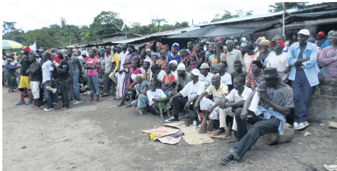
La population de Kibouéndé