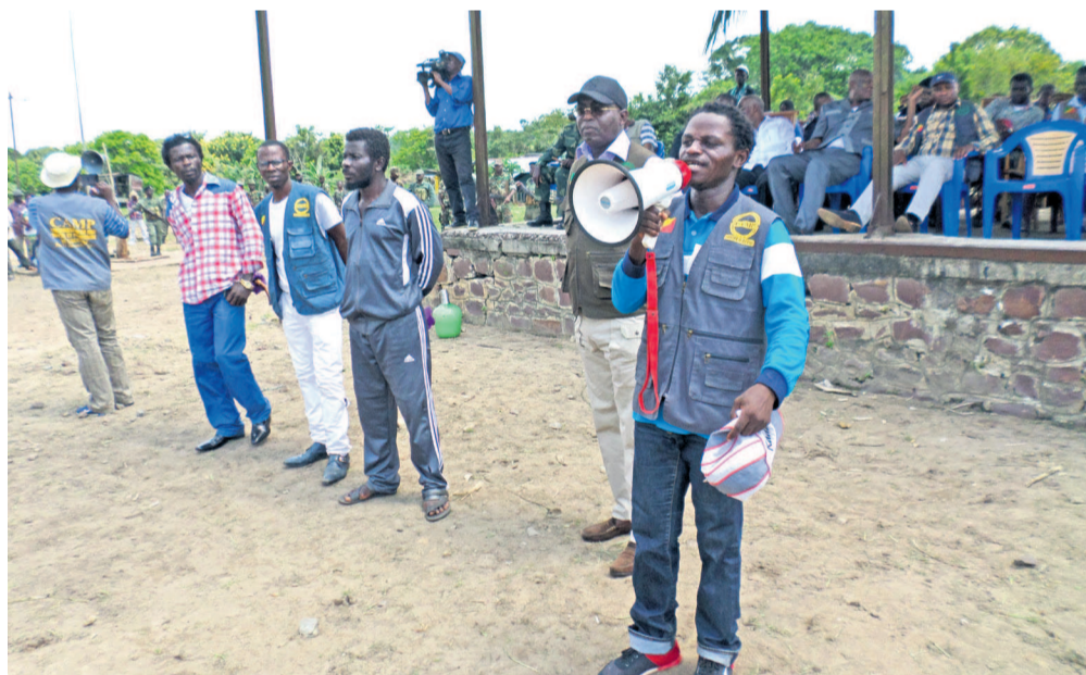
La sensibilisation des ex-ninjas dans le Pool