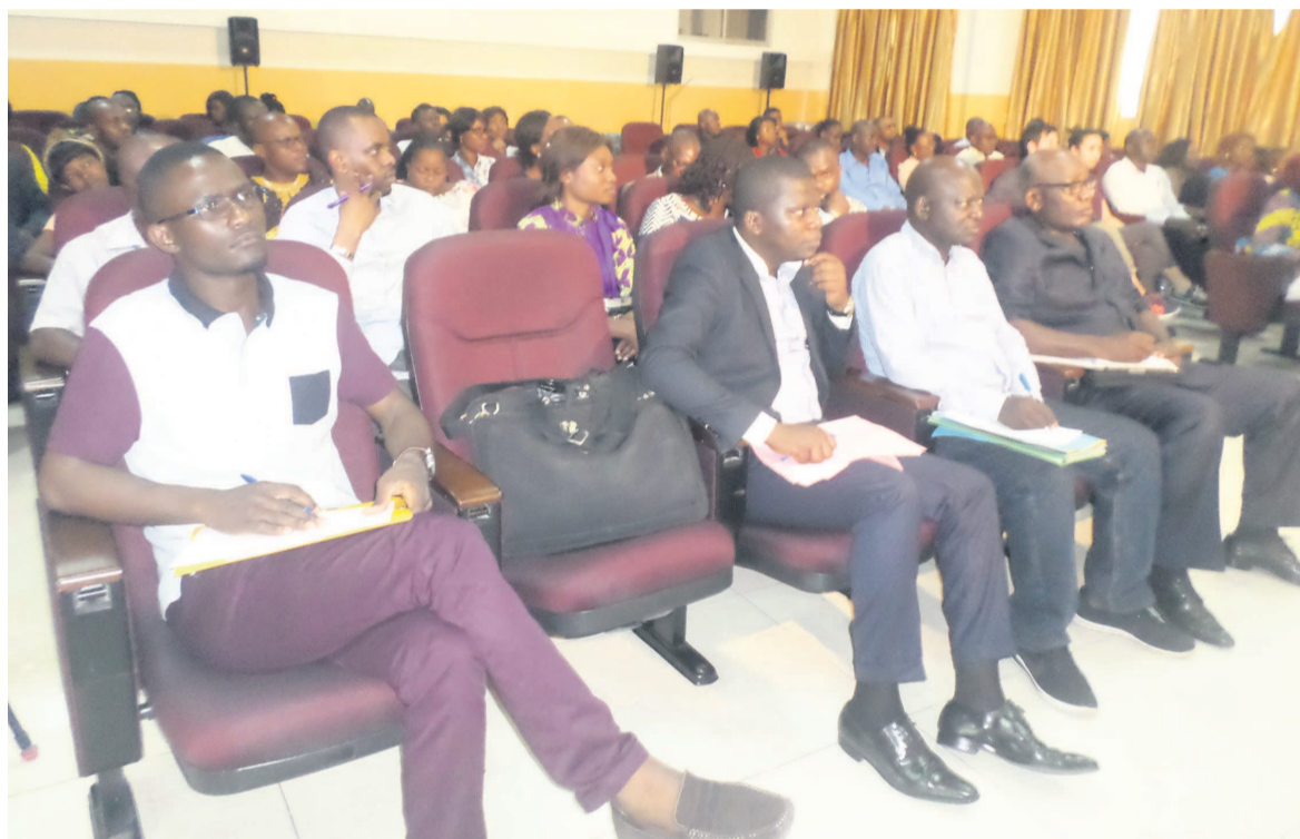
Les participants (Adiac)