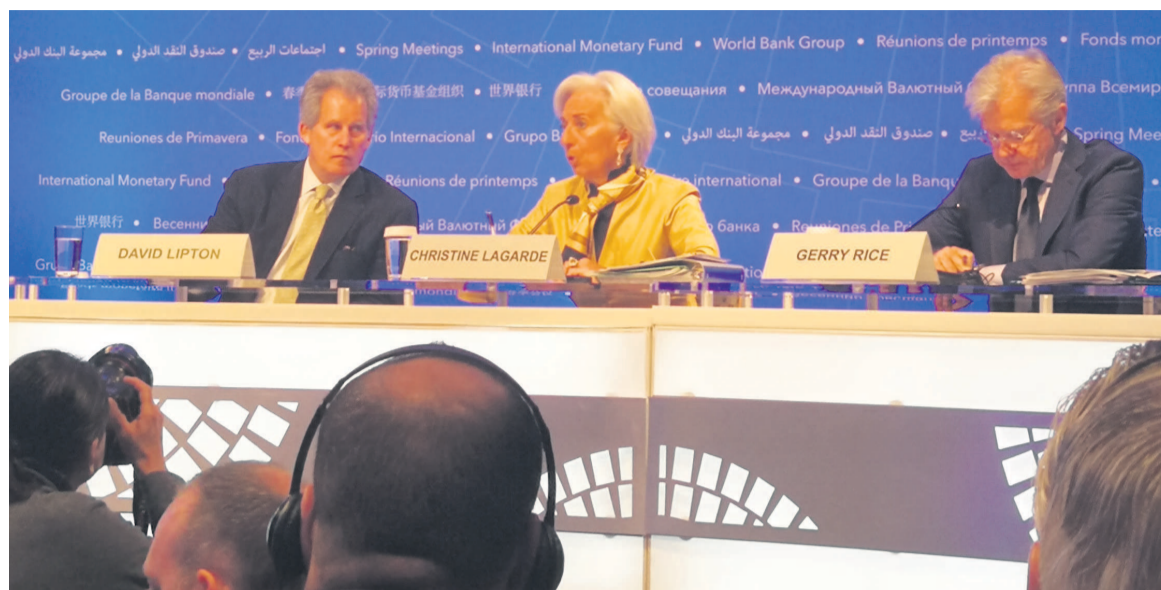
Le présidium de la réunion

Dans l'ensemble, au moins mille cinq cents personnalités : ministres des Finances ou leurs représentants venus des 189 pays membres des institutions de Bretton Woods, les directeurs des banques centrales, les parlementaires sans oublier les journalistes, prennent part aux assises qui précèdent les rencontres annuelles prévues en octobre, à Jakarta, en Indonésie. Les experts, spécialistes et autres analystes du Fonds monétaire international (FMI) et de la Banque mondiale scrutent les perspectives économiques mondiales dont les indicateurs ne sont pas les mêmes selon les régions ou zones. De façon globale, après une dé-