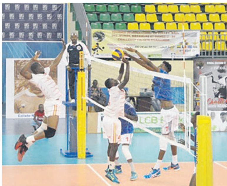
Une rencontre de volleyball

Les rencontres chez les cadets, cadettes et minimes, se joueront avant la cérémonie officielle, prévue le 22 avril, au gymnase Henri-Elendé où se poursuivra, d'ailleurs, la compétition. Après quoi, la DGSP (championne en titre seniors messieurs) en découdra avec Kinda Odzoho. En juniors messieurs, Espoir sera aux prises avec JCM, tandis que Renaissance de Mpila jouera contre JCM3 et OVSP rencontrera JCM2 dans la catégorie des minimes pour le compte de la première journée de la compétition départementale de Brazzaville. Les trois premières équipes de chaque catégorie seront qualifiées pour le championnat national, lui aussi, qualificatif aux différentes compétitions africaines de clubs de volleyball. La dernière saison, la DGSP a été sacrée championne en seniors messieurs et dames, BVC Espoir chez les cadets, Renaissance en cadettes, JCM en cadets. Il faut attendre la fin de la compétition pour savoir si ces équipes conserveront leurs titres où se feront prendre par d'autres formations engagées dans ce tournoi qui, du reste, ne démeritent pas.